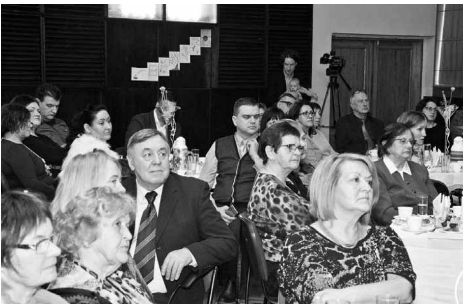
Kuldīgas novada 7. Lūgšanu brokastīs Ēdoles kultūras namā pulcējās gan vietējie ļaudis, gan dažādu iestāžu un uzņēmumu vadītāji un kristīgo konfesiju pārstāvji arī no citiem novadiem.