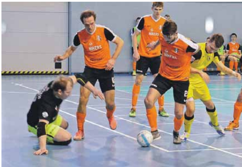
Tiekas Kuldīgas kluba Nikers un Preiļu bērnu un jauniešu sporta skolas telpu futbolisti .

Latvijas telpu futbola 1. līgas čempionāta kārtējā spēlē uzvaru svinēja Kuldīgas komanda Nikers , ar 9:1 sagraujot vienību Preiļu BJSS .