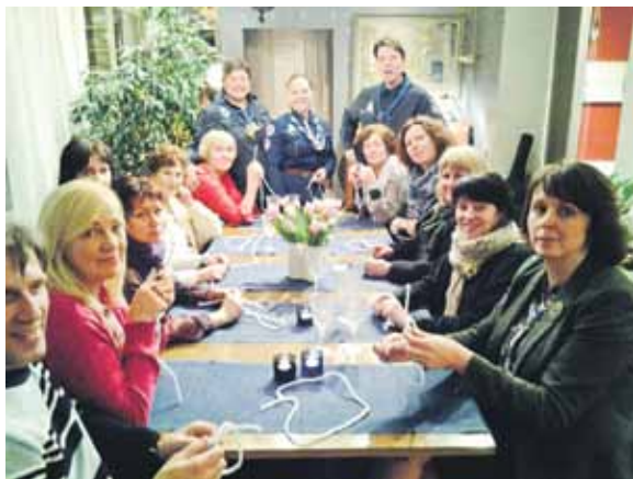
Kuldīgas novada pedagogi tiek ar skautu kustības organizatoriem Loimas pilsētā Somijā.