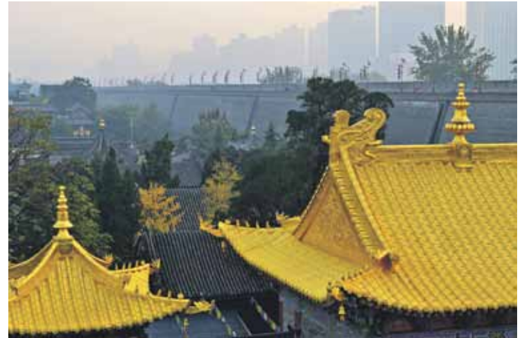
Siaņa ir viena no Ķīnas senajām galvaspilsētām. Uz to tūristi brauc, lai redzētu slaveno terakotas armiju.

skaists laiks, bet brīvdienās pēkšņi piesārņojums tāds, ka nevar iziet laukā. Man ir maska, bet ar to šķiet, ka smoku vēl vairāk. Dzīvoklī ir gaisa attīrītājs un ir labāk. Janvārī bija lielākais piesārņojums pēdējos divos gados. Dīvaini sajūta: esi vesels, bet katra kustība jāizdara ar piepūli, nav spēka.”