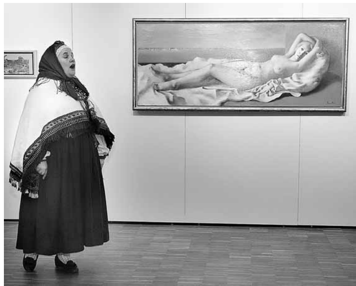
„Es māsiņa, tu māsiņa, Abām baltas villainītes.”