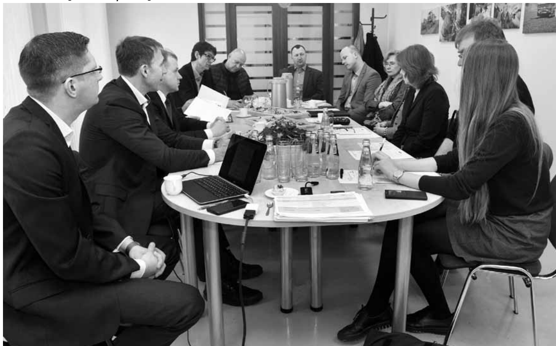
Gan par nodokļiem, gan citām uzņēmējiem svarīgām tēmām notiek diskusija pie SIA Amazone galda.

Pēdējās dienās medijos daudz izskanējusi nodokļu reforma bija sarunu tēma arī Latvijas Tirdzniecības un rūpniecības kameras (LTRK) Kurzemes reģionālās padomes izbraukuma sēdē. Tā šoreiz notika SIA Amazone Padurē, piedaloties gan padomes locekļiem, gan uzaicinātajiem uzņēmējiem.