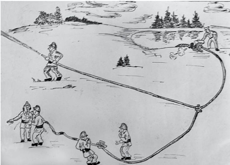
Vistrakāk ir, ja dzēšot liesmas vai startējot sacensībās, šļūtenē iemetas mezglis. Tā komandai gadījies sacensībās, tāpēc tapusi nezināma autora karikatūra.