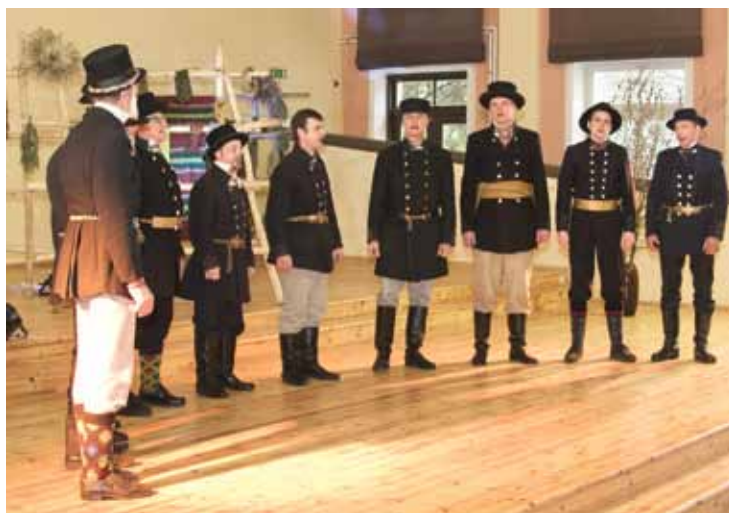
Kā teica Suitu vīri : ja vajag par puķēm, būs par puķēm (skan Visiem rozēs dārzā ziedēj ).