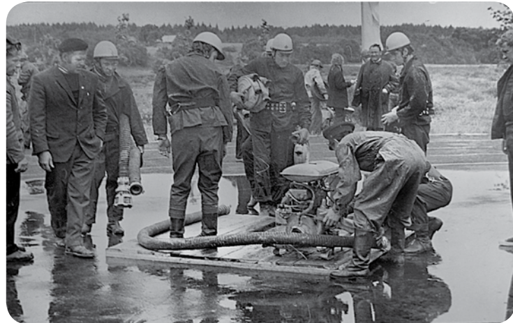
Vīru komanda pirms sacīkstēm.