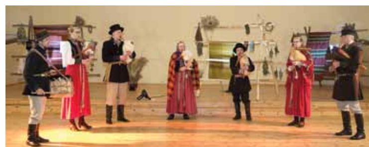
Folkloras kopa Suitu dūdenieki Kazdangā bija visjaunākā – tās aizsākumi ir vien pirms nepilniem trim gadiem.