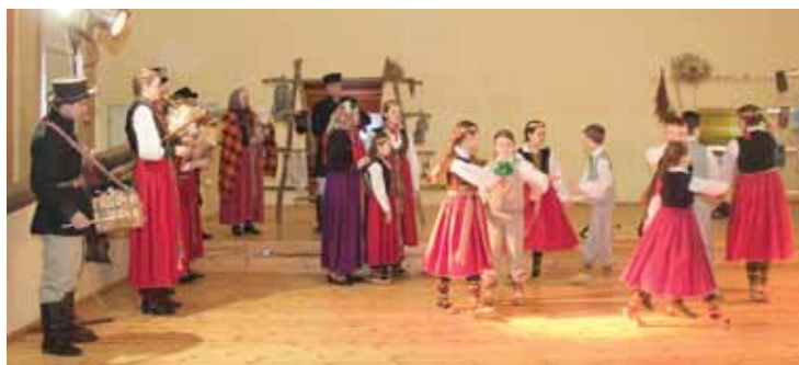
Bērnu folkloras kopa Suitiņi par spīti virusam, kas paretinājis tās rindas, turējās braši.