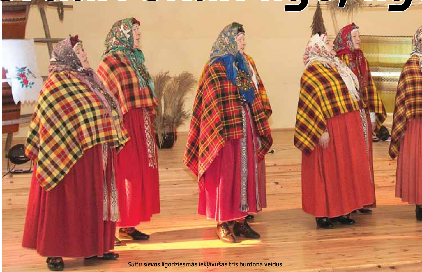
Suitu sievas līgodziesmās iekļāvušas trīs burdona veidus.

Līdz aprīļa beigām visā Latvijā notiek etnogrāfisko ansambļu un folkloras kopu skate par tēmu Jāņi, ziedēšana . Tā ir gatavošanās starptautiskajam folkloras festivālam Baltica 2018 , kas noritēs nākamgad no 16. līdz 21. jūnijam un beigsies ar vasaras saulgriežiem novados un Rīgā.