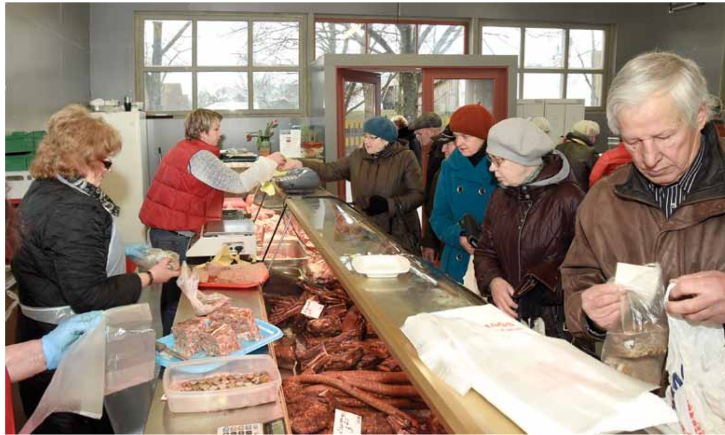
Kuldīgas pārtikas tirgus paviljons vēris durvis pēc gandrīz pusgadu ilguša remonta. Pagājušo sestdien pircēju un pārdevēju bija daudz.

Pēc gandrīz pusgada remonta atvērts Kuldīgas pārtikas tirgus paviljons. Pārdevēji priecīgi, ka nu pieejams siltais ūdens, bet reizē cēlusies maksa par tirgošanos.