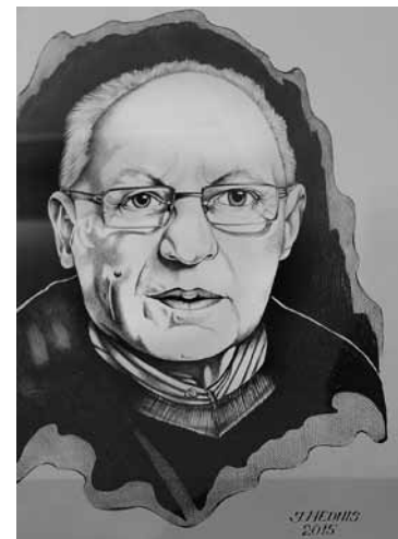
Jura Lipšņa teksts un foto

Lappuse tapusi sadarbībā ar Kuldīgas novada pašvaldību.