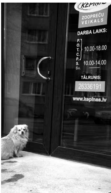
Gaidīšanas svētki.