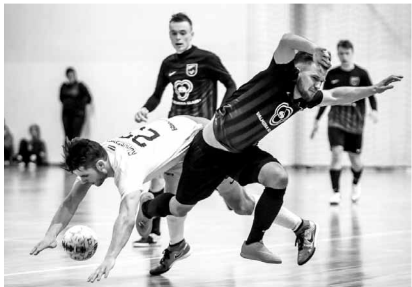
Latvijas Telpu futbola asociācijas 1. līgas finālspēle starp Kuldīgas Nikeru un Valmieras Glass/VIA .