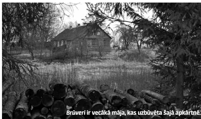
Brūveri ir vecākā māja, kas uzbūvēta šajā apkārtnē.