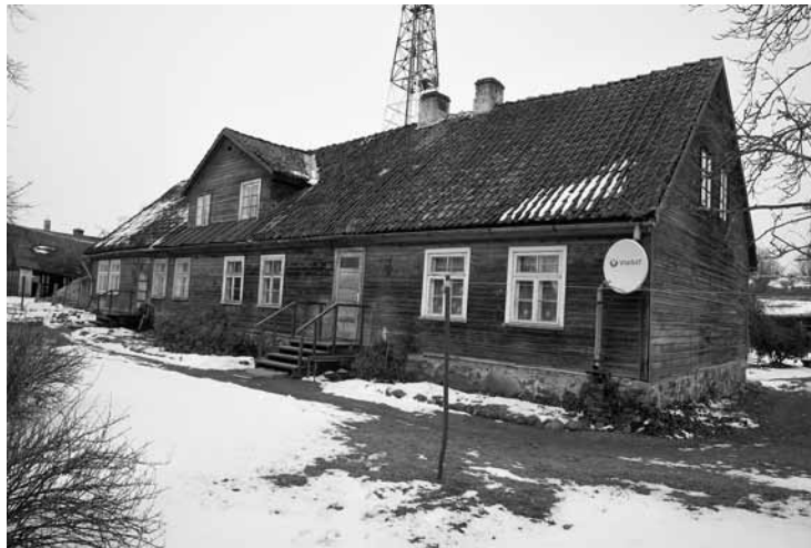
Līdz 1. aprīlim nams jāatstāj septiņu īrnieku ģimenēm, jo īpašnieks esot nolēmis to nojaukt.