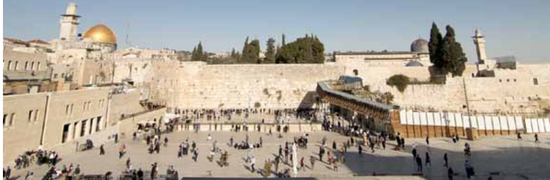
Skats uz Raudu mūri no augšas. Labajā pusē var redzēt koka tiltiņu, pa kuru tūristiem nokļūst pie Klinšu kupola mošejas.

Decembra vidus, piektdienas pēcpusdienā. Zvana brālis Kārlis – braucam uz Izraēlu! Izrādās, lidsabiedrība Wizz Air pa lēto izpārdod biļetes tiešajam reisam uz Telavivu.