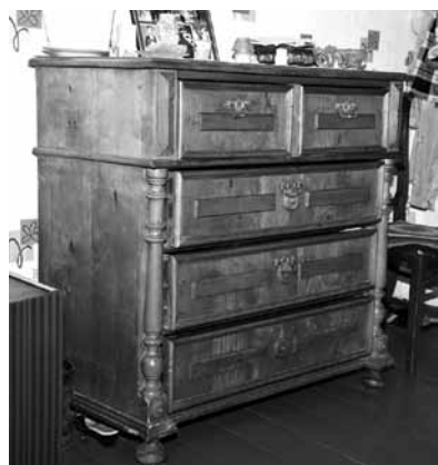
Koka kumode – atmiņa par kuldīdznieci, Lijas Lienas vecmāmiņas māsiņu.