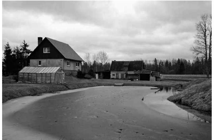
Stiebru apkārtnē ir sakopta, izveidots arī dīķis.