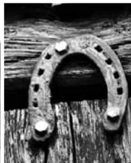
Laiques pakavs pie Brūveru durvīm stāv jau vairākus desmitus gadu.