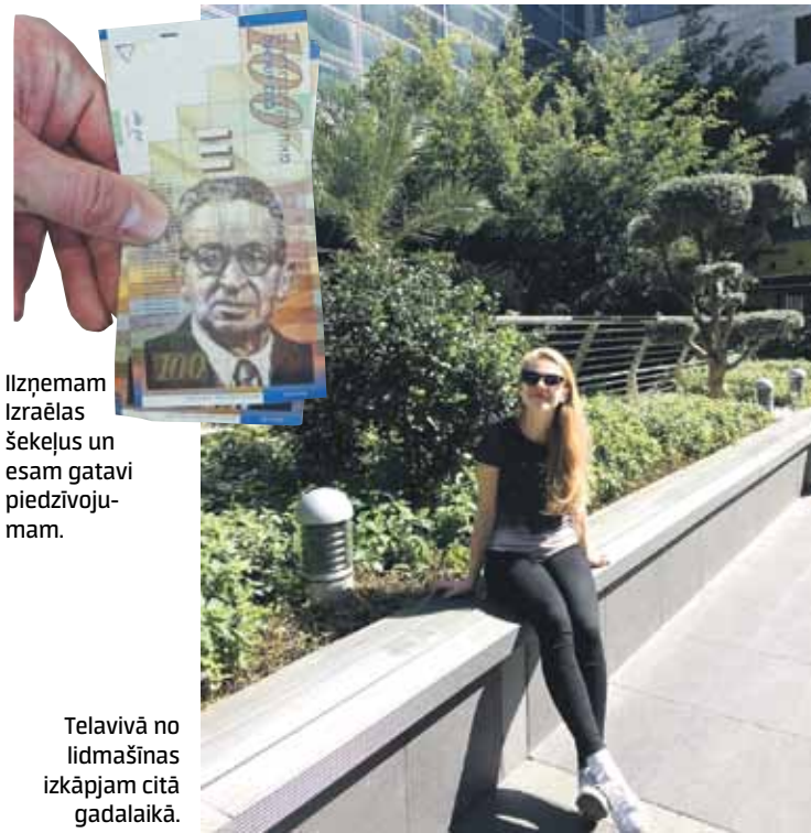
Izņemam Izraēlas šekelus un esam gatavi piedzīvojam.