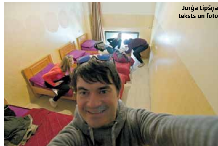
Istabiņa viesnīcā New Palm Hostel.

Atstājam mantas, paņemam kameru un jakas (somā) un dodamies izpētīt, kur īsti esam atbraukuši.