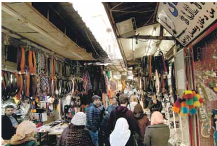
Jeruzalemes tirgū var nopirkt visu.

Lidostā atkal drošības pārbaude. Izpēta pasēs, jautā, cik mūsu ir un ko Izraēlā meklējam. Pie diviem jauniešiem, kuri laikam nav mācējuši atbildēt uz visiem jautājumiem, pienāk kungs melnā jakā un saulesbrillēs. Pēc nelielas vārdu apmaiņas šos kaut kur aizved. Nezinu, vai viņi lidoja no Latvijas vai citas vietas. Droši vien reizē ar mūsu lidmašīnu pienākusi vēl kāda, jo garajās rindās stāv arī ba-