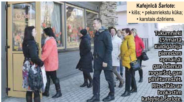
Kafejnīcā Šarlote: • kišs; • pekanriekstu kūka; • karstais dzēriens.

vakar veiksmīgi bija galā. Uzņēmēji atzīst, ka ēdinātājiem interesantas. nogalē bērnus atstāt vecvecākiem un doties romantiskās s. Pieredzes apmaiņā ieradās arī nozares speciālisti no citām