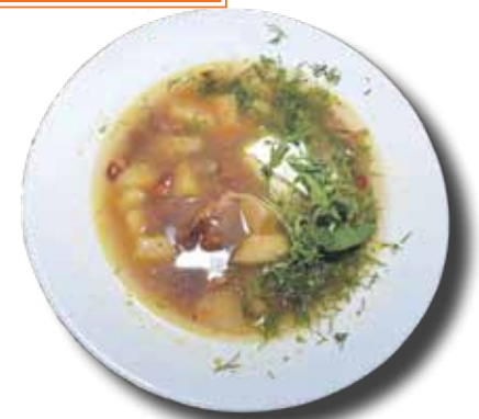
Ceturtdienas pēcpusdienā Stenderā pārsvarā ēda iebrāucēji. Restorānu nedēļas aromātisko pupiņu zupu tobrīd gan neviens nebija izvēlējis.

„Ēdienus domājam visi kopā. Gribējām, lai ir vienkārši un saprotami, bet ar Kuldīgas senatnīguma garšu.” Par pasākumu un atklāšanas sarīkojumu viņa saka lielu paldies J. Bergmanei – tas esot tā vērts, lai nākamgad atkārtotu. „Vietējie iznāk no mājām, brauc viesi. Ciemiņi no tālienes atbrauca jau nedēļu iepriekš – bija kļūdījušies ar datumiem. Labi, ka cilvēki izsaka vērtējumu, un pārsvarā tas ir pozitīvs.”