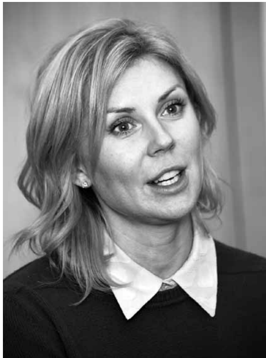
„Lai sasniegtu labus rezultātus, sportistam nepieciešama iedvesma. Es lasīju dzeju,” saka Ineta Radeviča.

„Pārstāvot Latviju, emocijas deva man spārnus,” tā par laiku, kad kā profesionāla vieglatlēte ar panākumiem pārstāvējusi mūsu valsti Eiropas un pasaules mēroga sacensībās, saka bijusī tāllēcēja un trīssolļēcēja INETA RADEVIČA.