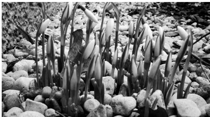
Šodien 12:29 pavasara sākums.