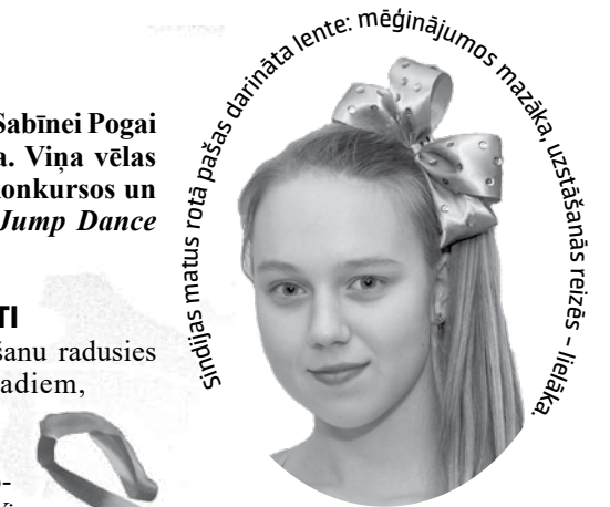
Sindijas matus rotā pašas darināta lente: mēģinājumos mazāka, uzstāšanās reizēs – lielāka.

Laila Liepiņa, Dina Poriņa Megijas Rudovičas arhīva un Lailas Liepiņas foto