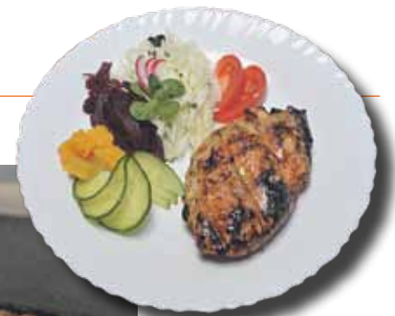
Tā top viltotā zoss no vistas krūtiņas, kas pildīta ar āboliem un plūmēm.