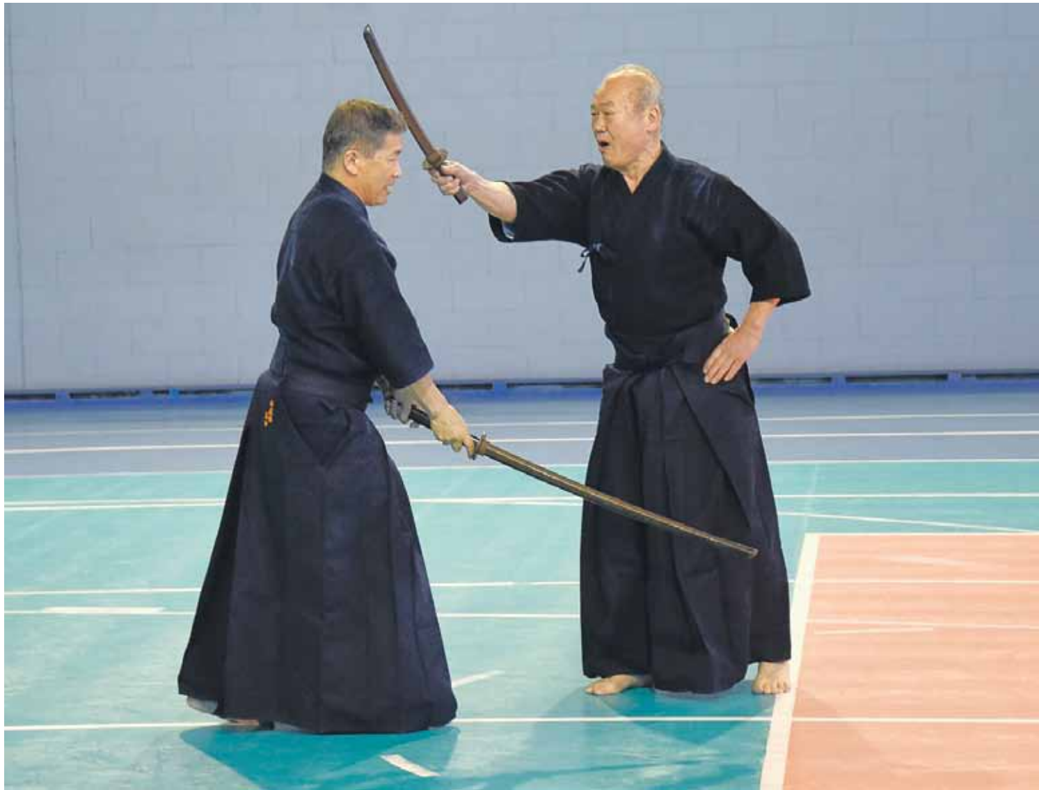
Kuldīdzniekiem tiek demonstrēta un izskaidrota Japānas senā kaujas māksla – kendo. Senseju cīņā ne vienmēr uzvar tas, kuram garāks zobens.

Kuldīgas volejbola hallē interesentiem bija iespēja ielūkoties Japānas paukošanas mākslas kendo un loka šaušanas mākslas kjudo ( kyudo ) paraugdemonstrējumos.