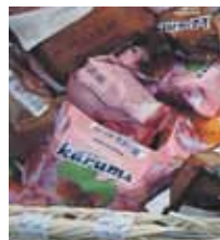
Kāruma sieriņš pat Jeruzālemē ir Kāruma sieriņš. Tikai neko vairāk uz iepakojuma salasīt nevar.