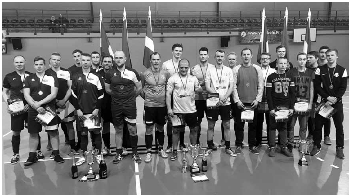
Kuldīgas novada telpu futbola čempionāta labāko trio: Alsunga, Nikers, Nikers/Sporta skola.

Svētdien par Kuldīgas novada atklātā čempionāta telpu futbolā uzvarētājiem kļuva Kuldīgas komanda Nikers , kas pēc tam devās uz Zvaigžņu spēli Rīgā un saņēma apbalvojumus Latvijas čempionāta 1. līgā.