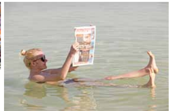
Avižu fotosesija jūrā.

ir kā mauriņš pirmajā ziemas rītā, kad naktī snidzis. Balts, pūkains un... sāļts. Mazliet balta un sāļta āda paliek arī pēc dušas, sevišķi vietās, kas kārtīgi nav nomazgātas.