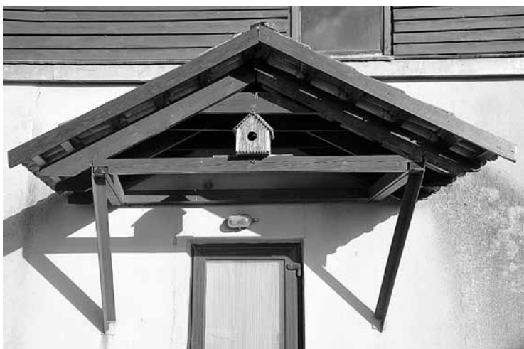
Dubulsts nepļīst. Aivara Vētrāja teksts un foto