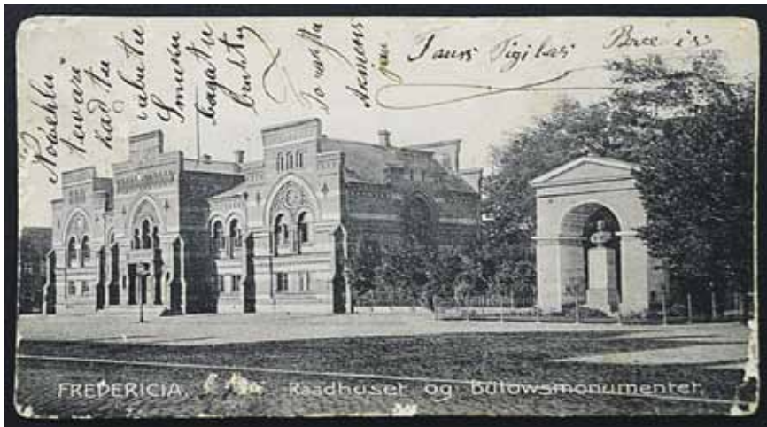
„Novēlu tev arī, kad tu dabūtu smuku, bagātu brūti,” kādam vēlējās nu jau nevienam nezināms cilvēks.