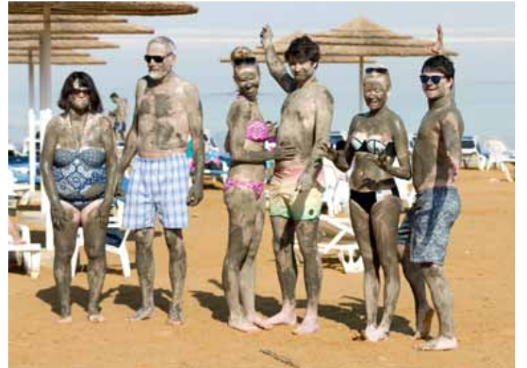
Nāves jūras ārstnieciskie dubļi.