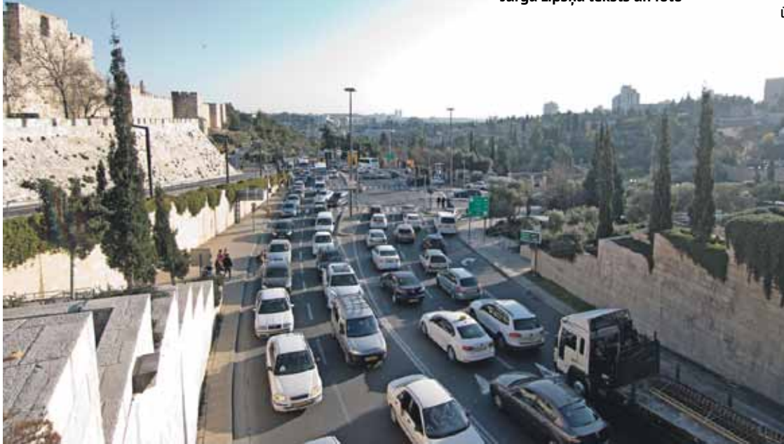
Nebeidzamie sastrēgumi un taurēšana.

(Sākums 17. martā.) Jurģa Lipšņa teksts un foto