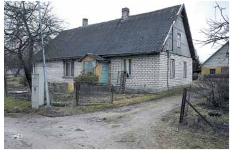
Ernas Šubes-Šubis nams celts tūlīt pēc kara - 40. gadu beigās.

Vecie iemītnieki pārlicināti: Darba iela beidzas pie Plostu ielas, jo jaunizbūvētais posms tāds piedēklis vien ir.