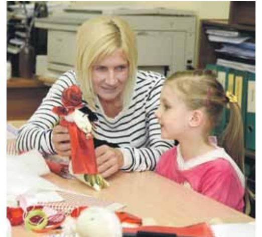
Ukrainiņu leļļu darbnīcā izmantots audums un dzija. Rezultāts patika gan lielām, gan mazām meitenēm.