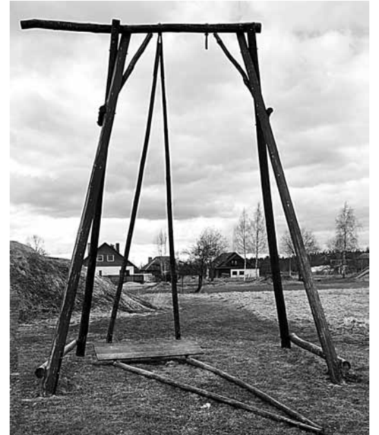
Šūpoles Pārventā līdz Lieldienām tiks salabotas. Pagaidām to uzlicēji lūdz nevienu apkārt neložņāt, lai nenodarītu sev pāri.