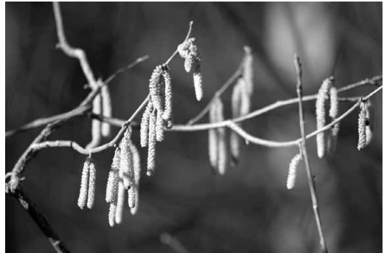
Pavasari ievāc lazdu pumpurus, arī mizas, nokasot tās ar nazi no ikšķa resnuma kāta.

Nepareizi novietota vai nospriegotā drošības josta var apdraudēt bērna dzīvību – avārijas gadījumā var tikt salauzta ribas un traumēti iekšējie orgāni. Visdrošākā vieta ir aizmugurējā sēdekļa labajā pusē. Mazākiem bērniem jābūt piņš sveram un vecumam atbilstošos autokrēsliņos,