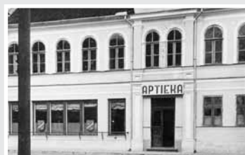
Kuldīgas pilsētas aptieka pirmskara gados.