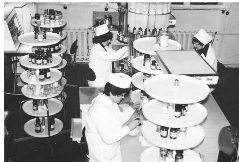
Asistenta istaba, kurā gatavoja zāles.