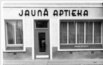
Baznīcas ielas aptieka.