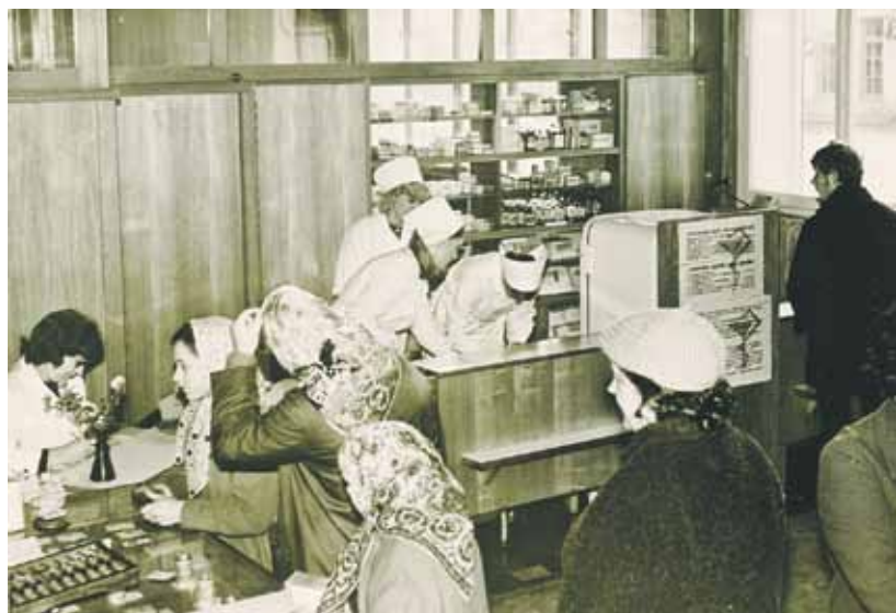
Lielajā aptiekā bieži vien bijušas garas pircēju rindas.