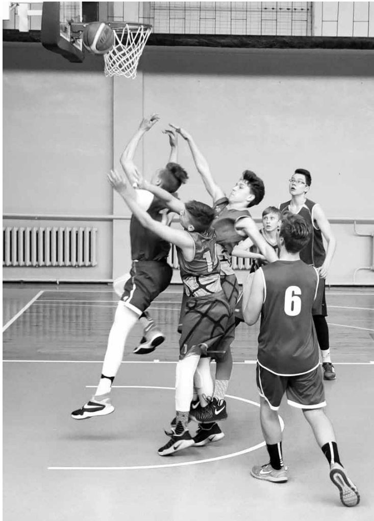
Kuldīgas jauno basketbolistu un Pārdaugavas 1. komandas sīvā cīņa zem groza.