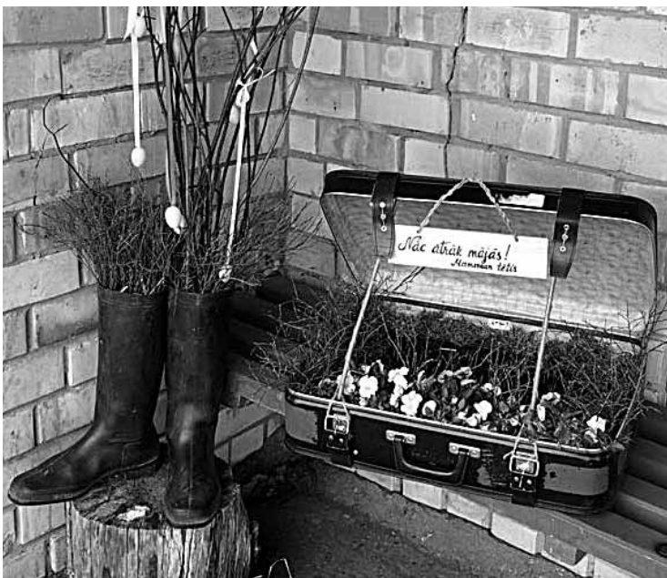
Bērni! Gaidām jūs mājās! (Fiksēts autobusu pieturā Ancē). Lasītāja iesūtīta fotogrāfija