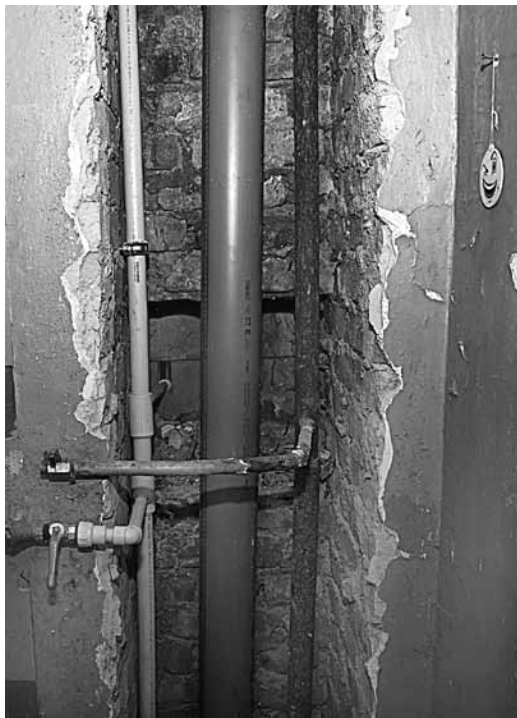
Kuldīgā, Piltenes ielā 14, nomainītie ūdens un kanalizācijas stāvvadi ļaus mazināt gadījumus, kad izrūsējušās caurules dēļ noplūst dzīvokļi.