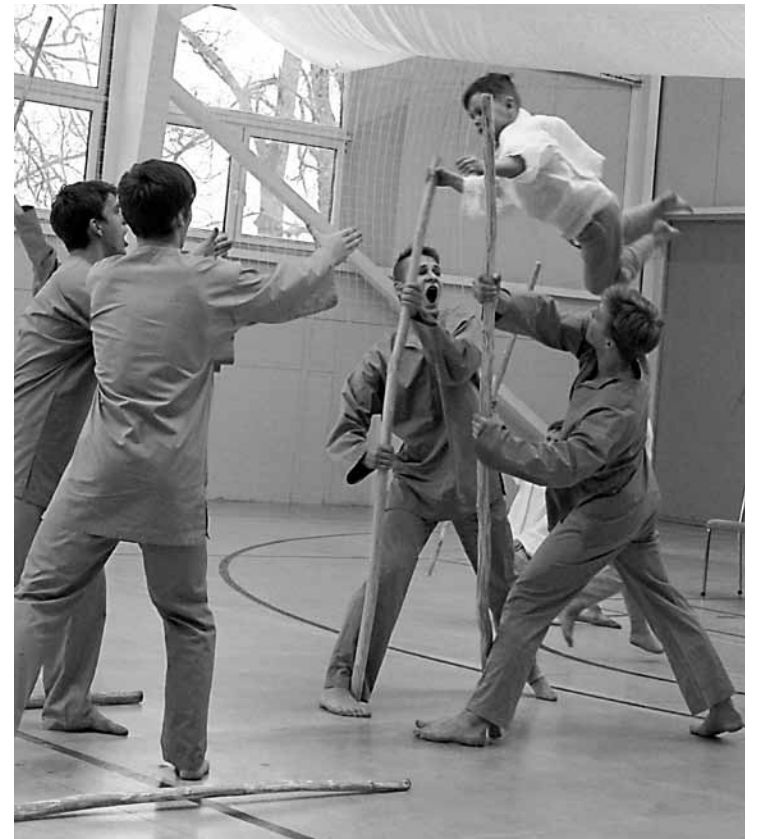
Deja Cīrulīti , mazputniņ : Kuldīgas Ventas puiši cīnās ar mietiem un mazos dejotājus met gaisā – tas skatītājiem lika brīnīties un pat nodrebēt.