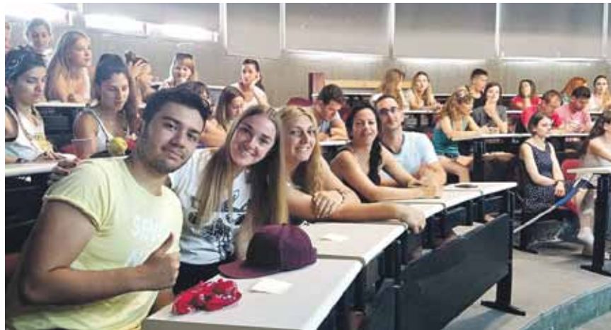
Mācības rit pilnā sparā. Galvenā tēma – jauniešu nodarbinātība Eiropā.

4 Ceturtais solis – gaidīt atbildi, uz kuru no trim izvēlētajām universitātēm varēsiet doties.