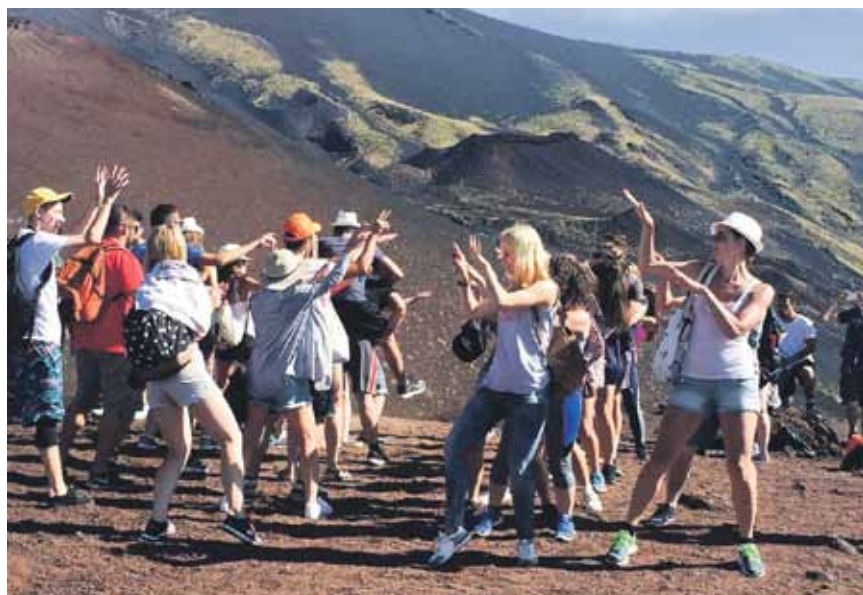
Dejas Etnas vulkāna kalnā. Karstums tik liels, ka kāpienu sākām jau agrā rītā.