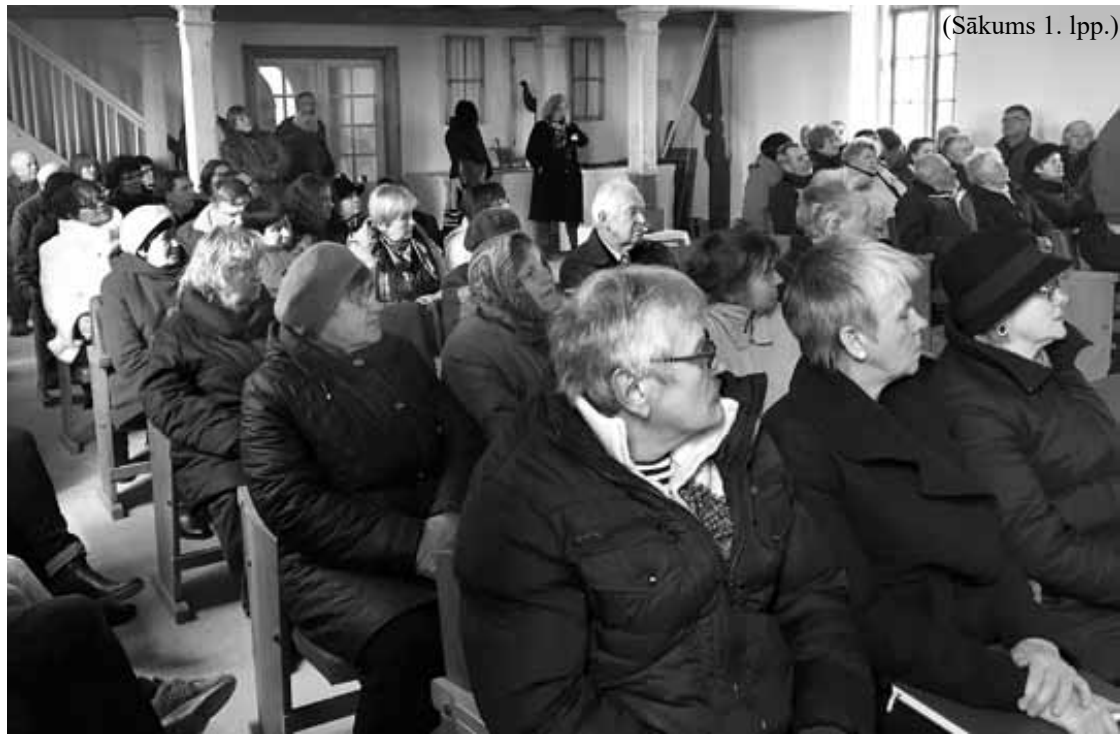
(Sākums 1. lpp.)

Lieldienu dievkalpojumā un ērģeļu ieskandināšanā Turlavas pagasta Klosteres Sv. Pētera baznīcā bija ļaužu pilna.