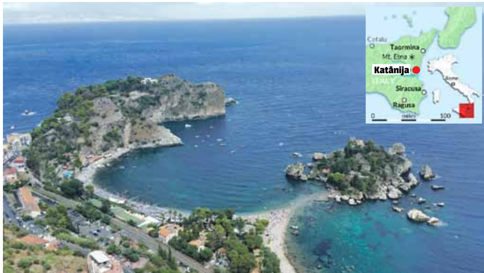
Taormina – pasakaini skati no pilsētas augšas.