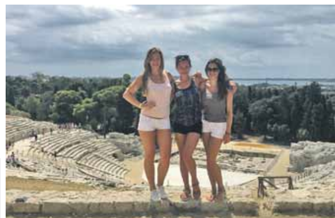
Ungāriete, latvieti un ungāriete Sirakūzās, grieķu amfiteātrī.

Šīs vasaras universitātēm pieteikšanās beidzas 28. aprīlī 12.00.