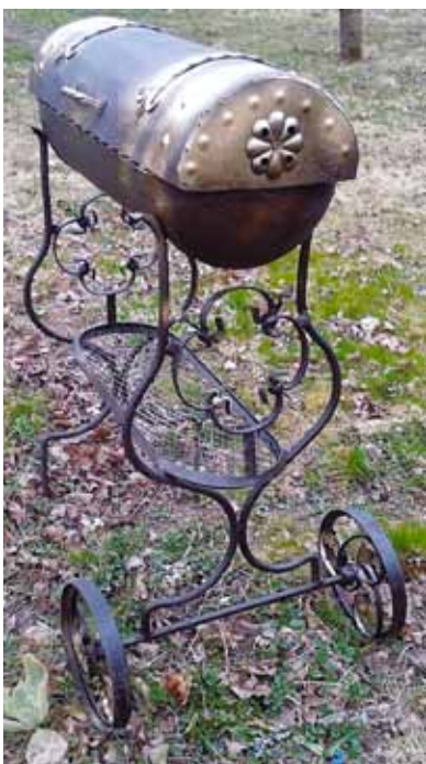
Pūralāde jeb dārza grils uz riteņiem.

Tāpēc kalējs atbalsta pašvaldības ieceri amatniekus un mājražotājus (vismaz lielāko daļu) apvienot biedrībā, lai kopā piedalītos projektos un, kā saka, sveci neturētu zem pūra. Jo Skrundai taču ir, ko pasaulei rādīt dažādās tautas daiļamata jomās.