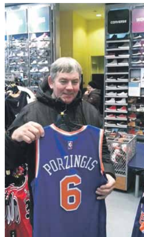
5. avēnijas sporta veikalā NBA Store . Te viss ir dārgāks, toties izvēle plaša.