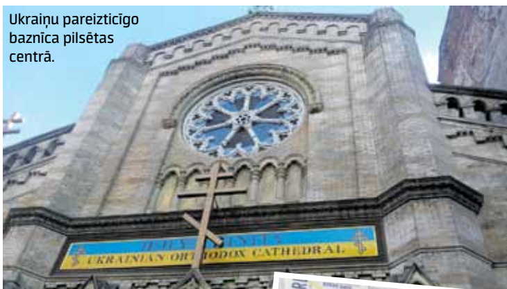
Ukrainu pareizticīgo baznīca pilsētas centrā.