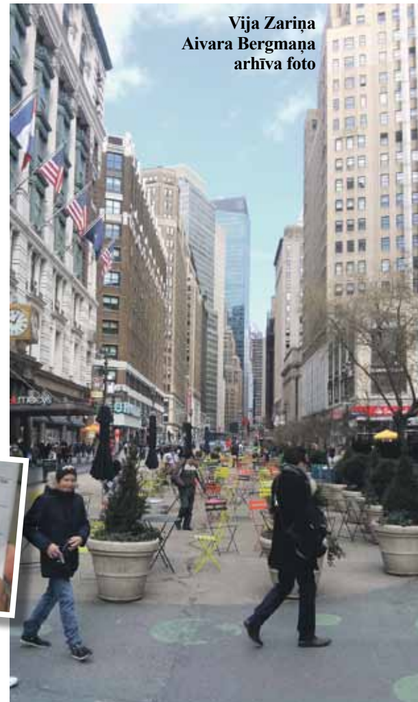
Vija Zariņa