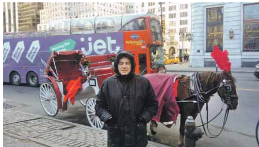
Aivars Ņujorkas Centrālparkā, kur viesus vizina ar pajūgiem. Zirgi ir isti metropoles iemītnieki un no auto nebaidās.