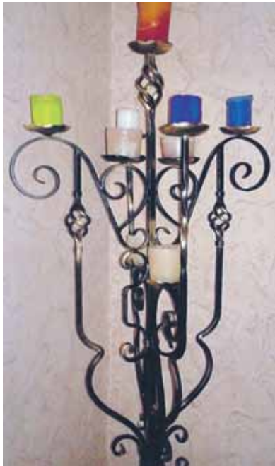
Svečturis pēc 9. klases meitenes īpatnējā pasūtījuma: „Mana dibena platumā, augstumā līdz krūtīm un ar deviņām svecēm.”