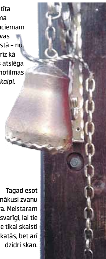
Tagad esot pienākusi zvanu ēra. Meistaram svarīgi, lai tie ne tikai skaisti izskatās, bet arī dzidri skan.