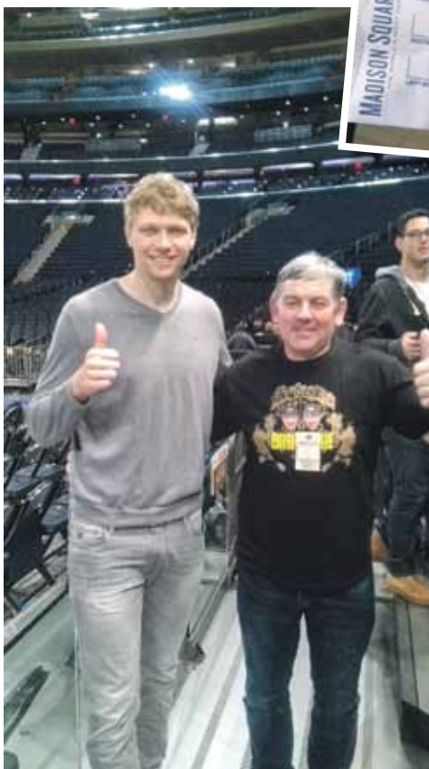
Aivars un Ņujorkas Knicks spēlētājs Mindaugs Kuzminskas pēcspēles tikšanās laikā.