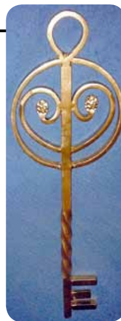
Apzeltīta dāvana Ķoniņciemam Turlavas pagastā – nu, gandrīz kā Rīgas atslēga no kinofilmās Vella kalpi.