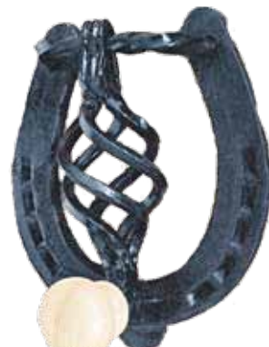
Liela daļa darbu ir pārkalti pakavi, bet šis ir meistara speciāli radītais durvju klauvēklis – laimes nesējs.