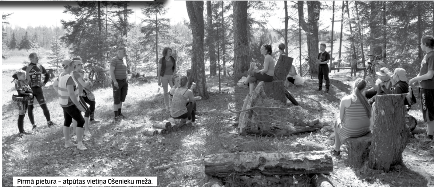
Pirmā pietura – atpūtas vietīņa Ošeniņu mežā.

Velodiena Vārmē kļuvusi par tradicionālu pavasara pasākumu, kas pulcē ģimenes, draugu kompānijas un citus aktīvistos. Tā ļauj aktīvi pavadīt brīvdienas, iepazīt tuvāko apkārtni un tādos laikaatpūtes kā šogad arī nosauļoties.