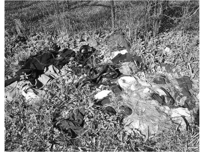
Privātā zemes gabalā Mucenieku ielā (netālu no Vējiņa ), kuru šķērso iemita taciņa, labu brīdi mētājās no maisiem izvandītas drēbes.