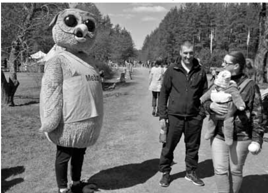
Pasākumā Meža ABC visus sagaida biedrības Meža konsultants lielā, gudrā pūce.

Apkopojošā atsauksmes, var secināt: tāpat kā iepriekšējās reizēs skolēniem pirmajā trijniekā ir ugundzēsēju demonstrējumi jeb pietura 112, kurā ikviens varēja darboties ar lielo šļūteni, arī arboristi, kas cilvēciņu iekarina kokos un ļauj pastaigāt pa galotnēm, un mednieki, kuriem beigās jau rokas sāpējušas, lādējot ieročus un mācot pareizi notēmēt. Mazākus bērnus vilināja kukaiņi, putni, zvēri, rotaļas, koka spēles