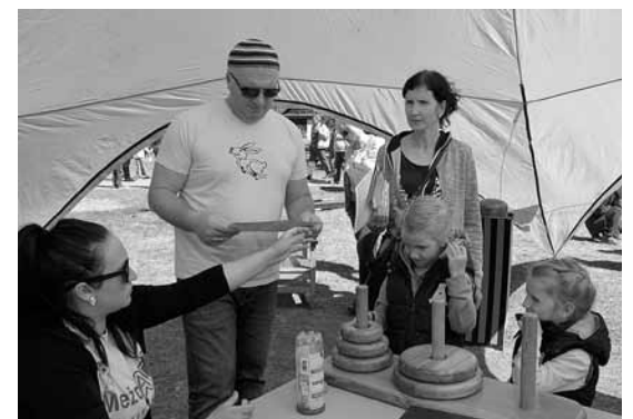
Katrā pieturā jāpaveic uzdevums, lai kartē saņemtu zīmodziņu. Pščenko ģimene tūlīt būs salikusi piramīdas.

Vairāk foto www.kurzemnieks.lv .