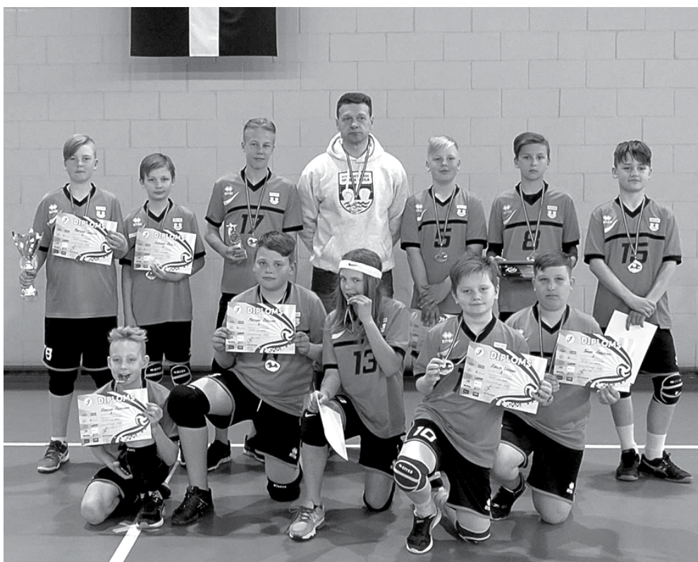
Par bronzas medaļām Latvijas jaunatnes čempionātā lepnī ir Kuldīgas novada sporta skolas U-13 grupas volejbolisti.