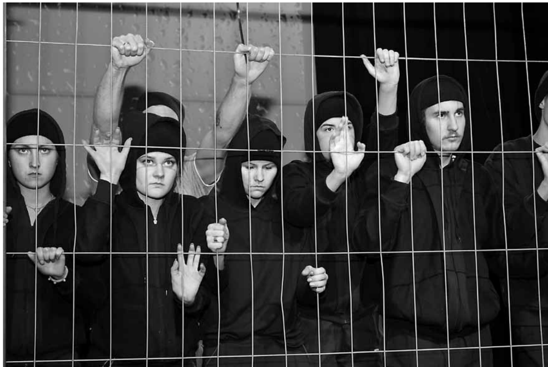
Kuldīgas jauniešu teātra Focus 20. gadadienas izrāde Pēdējā barjera . Tikai aiz restēm nonākot, var apjaust, kas atstāts otrā pusē: mīlestība, saule, brīvība.

„Par rezultātu noteikti nav jākaunas,” tā pēc Kuldīgas kultūras centra (KKC) jauniešu teātra Focus jubilejas izrādes Pēdējā barjera atzina radošais kolektīvs.