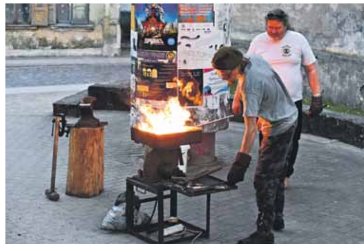
Darbojas Kalēju brālības vīri.