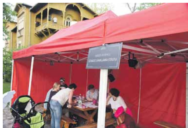
Kuldīgas novada muzejā naktī ielūkojās 2134 apmeklētāji. Daudzi no viņiem devās arī uz radošo darbnīcu telti.