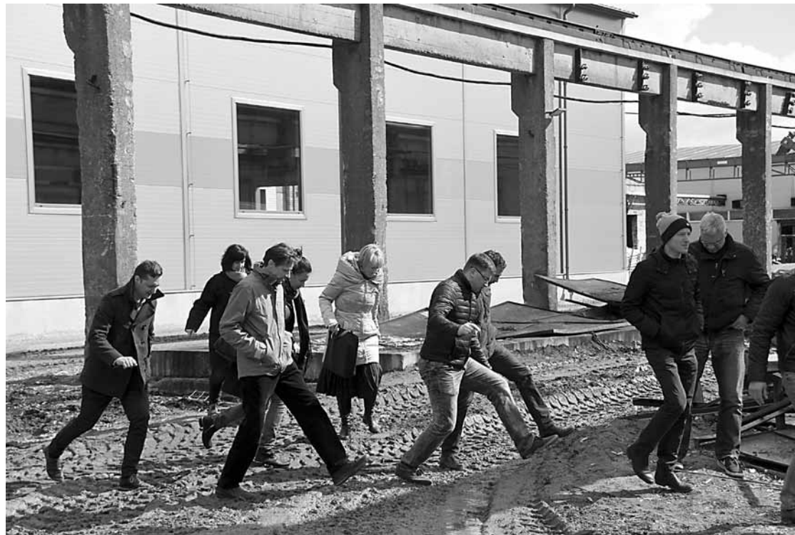
Latvijas Investīciju un attīstības aģentūras biznesa inkubatoru vadītājiem reizi mēnesī notiek mācības. Kuldīgā visi apmeklēja uzņēmumus Stiga RM (attēlā), Milzul un Goldingen Train .