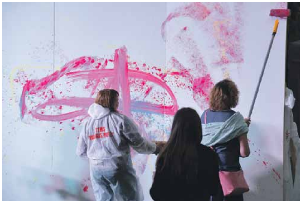
Kuldīgas palete 1905. gada parkā rada improvizētu izjūtu gleznu.