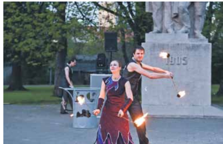
Pavasara nakts krēslā labi izceļas cirka mākslinieku valdītās un vadītās uguns bumbas.