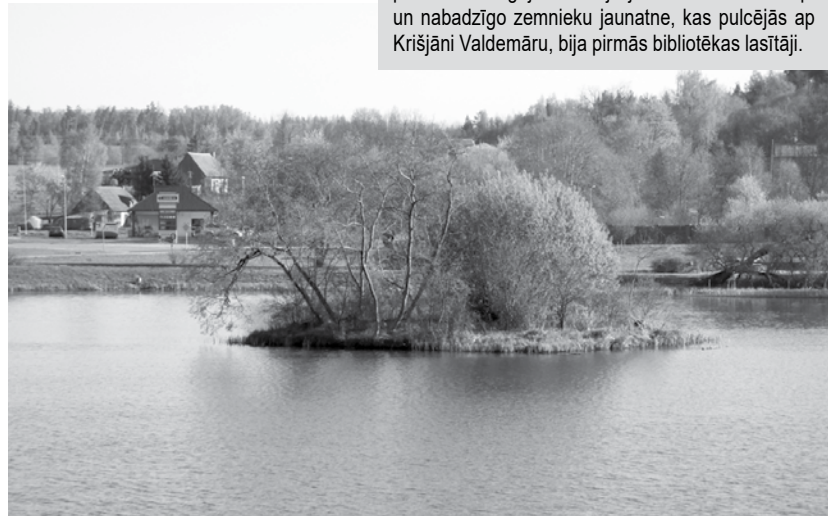
Ēdoles Dzirnava ezera saliņa mūsdienās. Tur Krišjānis Valdemārs pulcēja Baltijas jūras izsmelšanas biedrības dalībniekus.

Maksa par vienas grāmatas lasīšanu – kapeika, pavisam trūcīgajiem nebija jāmaksā. Ēdoles kalpi un nabadzīgo zemnieku jaunatne, kas pulcējās ap Krišjāni Valdemāru, bija pirmās bibliotēkas lasītāji.