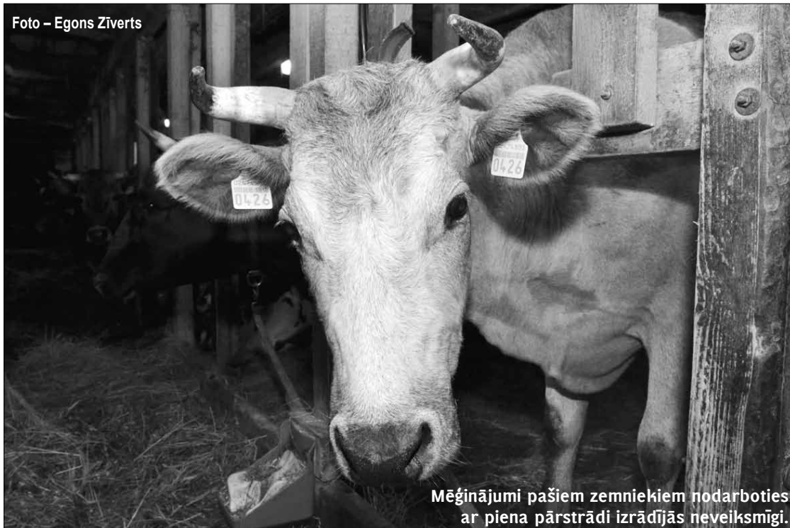
Mēģinājumi pašiem zemniekiem nodarboties ar piena pārstrādi izrādījās neveiksmīgi.