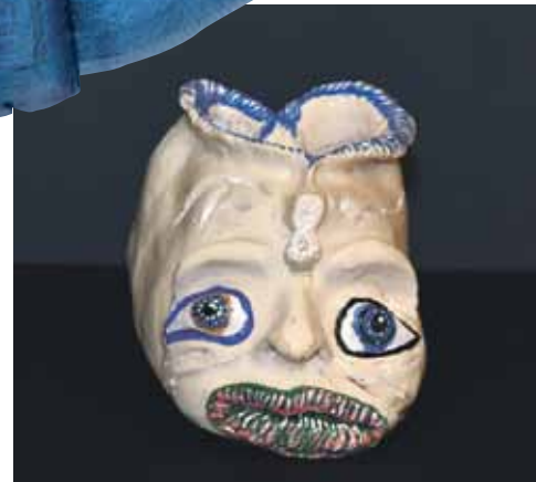
Neredzami redzamais – viens no Ivetas Asnes laikmetīgās keramikas darinājumiem, kurā paustas emocijas (skolotāja Danute Sīle).