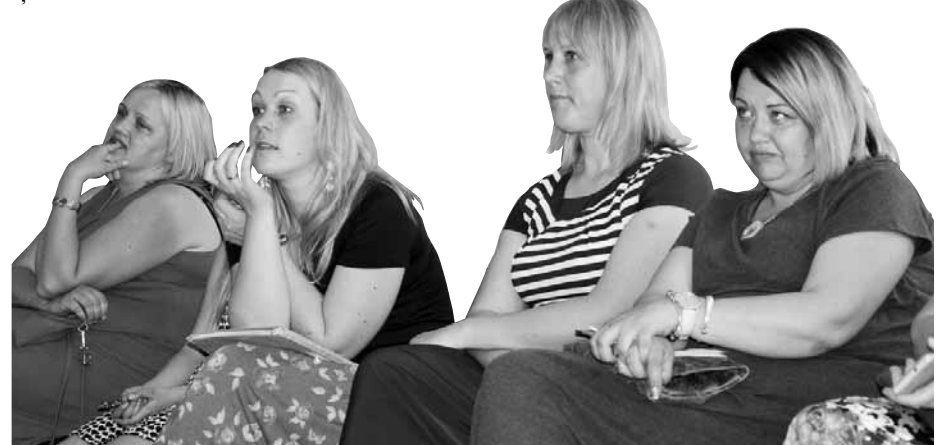
Jaunāka paaudze atceras laimīgo bērnību kolhoza laikos.