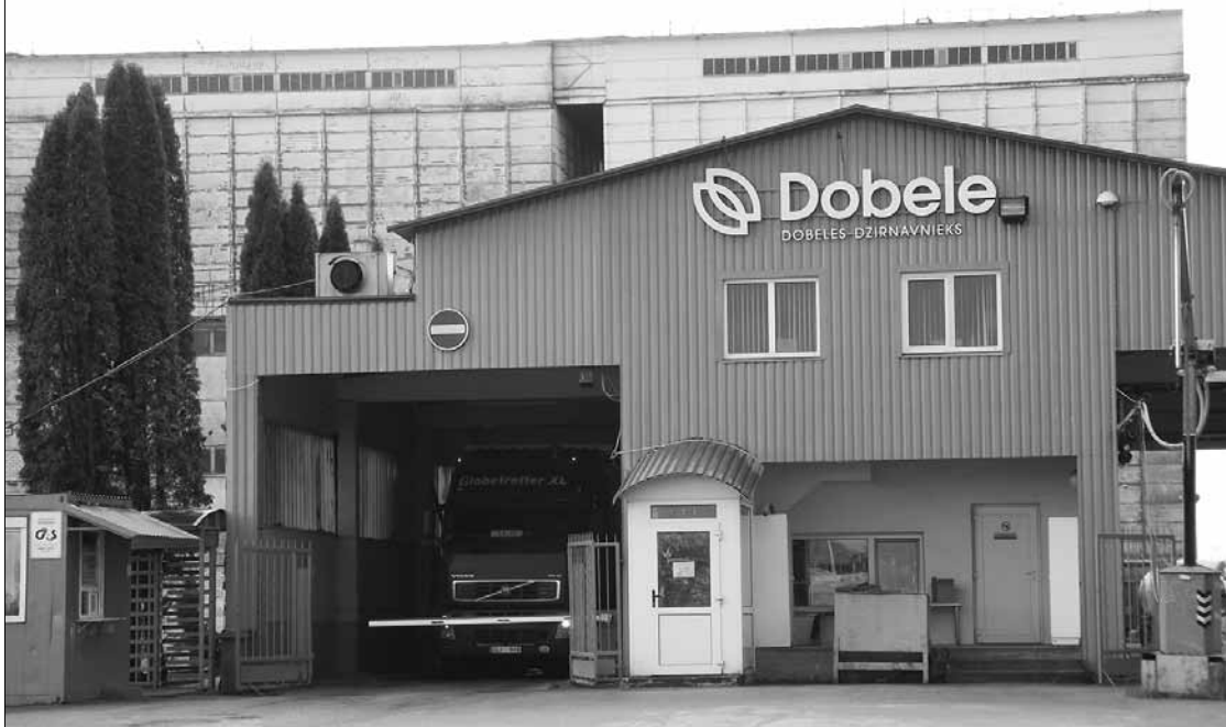
Uzņēmuma graudu pieņemšanas punkti ir ne tikai Dobelē, bet arī citās Latvijas vietās.

apjoms – sešu gadu laikā tas ir dubultojies, un šobrīd Dobelē gadā pārstrādā jau 200 000 tonnu graudu. "Paralēli ražošanas apjomu palielināšanai strādājām arī ar graudu piegādātājiem – lauksaimniekiem. Tā kā pārslu ražošanai nepieciešams ievērojams auzu apjoms, izveidojām īpašu auzu audzēšanas programmu, kurā uz abpusēji izdevīgiem noteikumiem aicinām iesaistīties zemniekus. Ro-