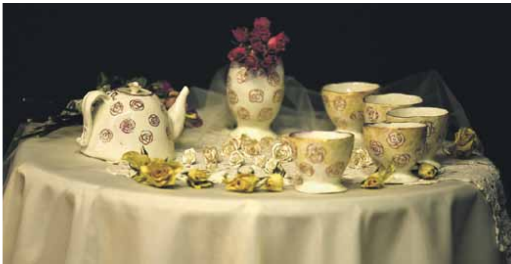
Zeltainās rozes – Beātes Annas Dzalbas porcelāna trauku un dekoratīvu rozišu komplekts (skolotāja Danute Sīle). Tikt pie zeltaini gaišās servīzes nav bijis viegli, jo šis materiāls krietni atšķiras no apgūtā māla.