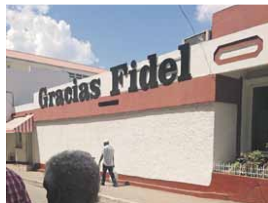
Revolucionārs, komunistis un bijušais valsts vadītājs Fidels Kastro joprojām tiek godināts ik uz soļa.