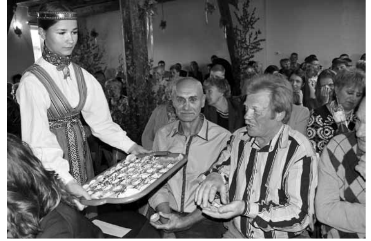
Katram salidojuma viesim tika viena no 285 mīlestībā ceptajām dzimšanas dienas kūciņām.