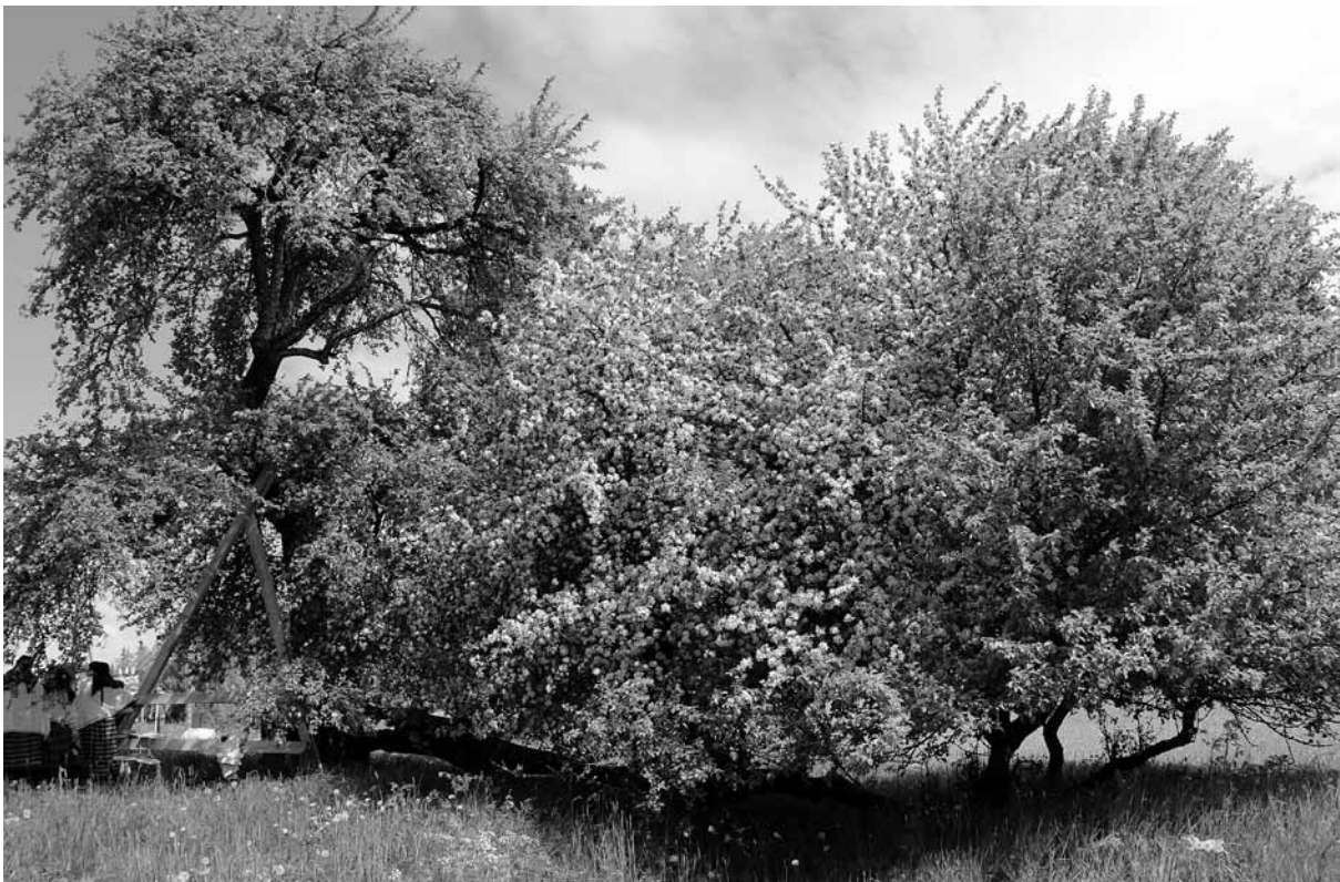
Vairāk nekā 300 gadu vecais koks zied arī šopavasār.