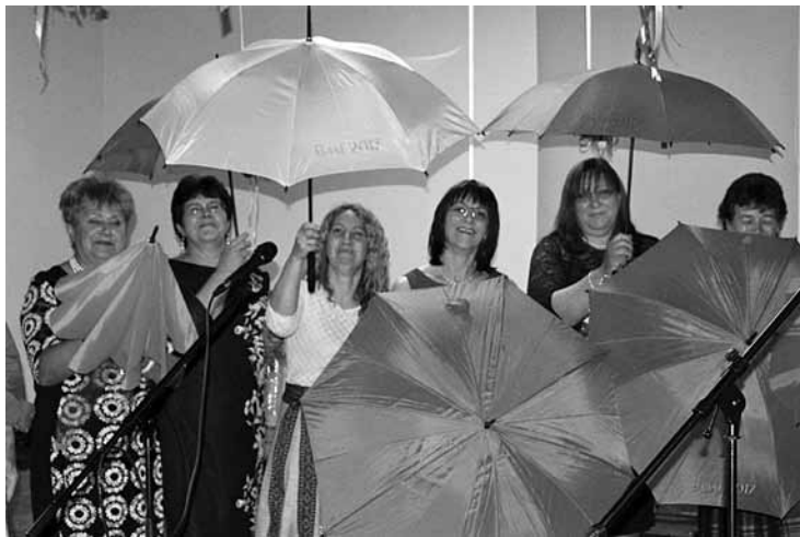
Basu filiāles skolotāji saņēmuši dāvanas. Lietussargi droši vien būs vajadzīgi, lai ne vien neizmirtu, bet arī izvairītos no pārmaiņu grūtībām. Pagaidām tikai diviem zināma jaunā darbavieta Kuldīgā.

Kuldīgas pamatskolas Basu filiāle aizvadījusi salidojumu un Basu skolas 95. gadskārtu. Ieradās aptuveni 200 absolventu un bijušo darbinieku, kuri līdz pat rīta gaismai ballējās un laiku vadīja atmiņās un sarunās.