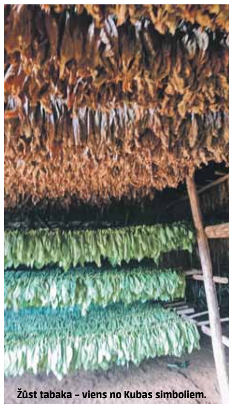
Žūst tabaka – viens no Kubas simboliem.