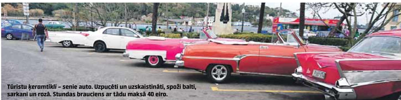
Tūristu ķeramīkli – senie auto. Uzpucēti un uzskaidināti, spoži balti, sarkani un rozā. Stundas brauciens ar tādu maksā 40 eiro.