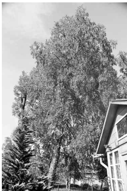
Vectēva Jēkaba Piļka stādītie koki vēl aizvien sargā Martas Pētersones māju.

Skolas gados viņa mācījās tagadējā Kuldīgas 2. vidusskolā, kas saukusies 4. pamatskola. Vidusskolas gadi pagājuši ēkā, kur tagad tehnikums. „No rītiem paps man izraka