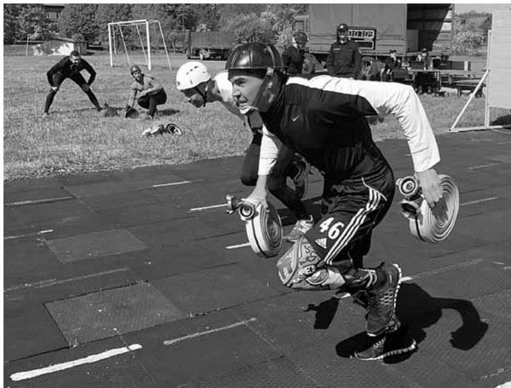
Kurzemes reģiona brigādes ugunsdzēsības sporta sacensībās Alsungā startē Liepājas 1. daļas komanda.