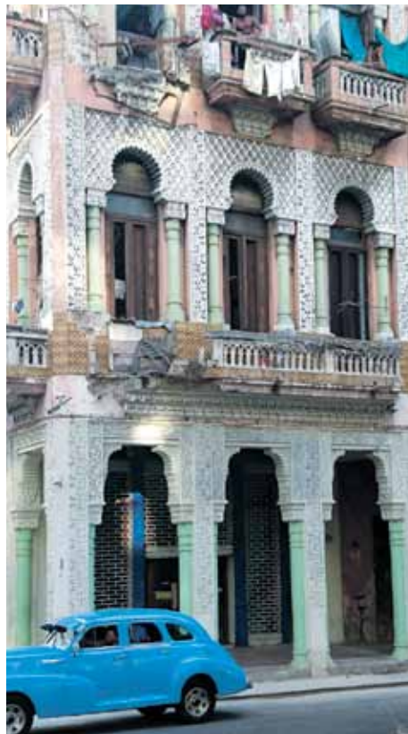
Galvaspilsēta Havana tiek kopta tūristiem, tomēr izskatās diezgan noplukusi.

„Kubā ir divas naudas vienības: vietējais peso – moneda nacional jeb MN un CUC jeb konvertējamais peso. Starpība ir 1:25. CUC pašlaik pielīdzināts vienam eiro vai dolāram, bet, mainot dolārus, 10% jāatskaita valstij. Maiņa notiek nedaudz mistiski viesnīcas uzņēmšanā. Kad atved