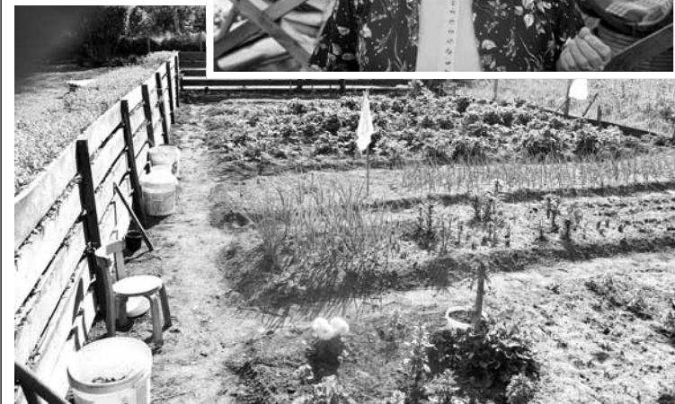
Mātei un meitai katrai sava daļa kopjama. Dzidras kundze savā dārziņā audzē zemenes, kādu sīpolu, protams, arī puķes. Meitas ziņā ir rožu dārzs un citi krāšņumaugi.