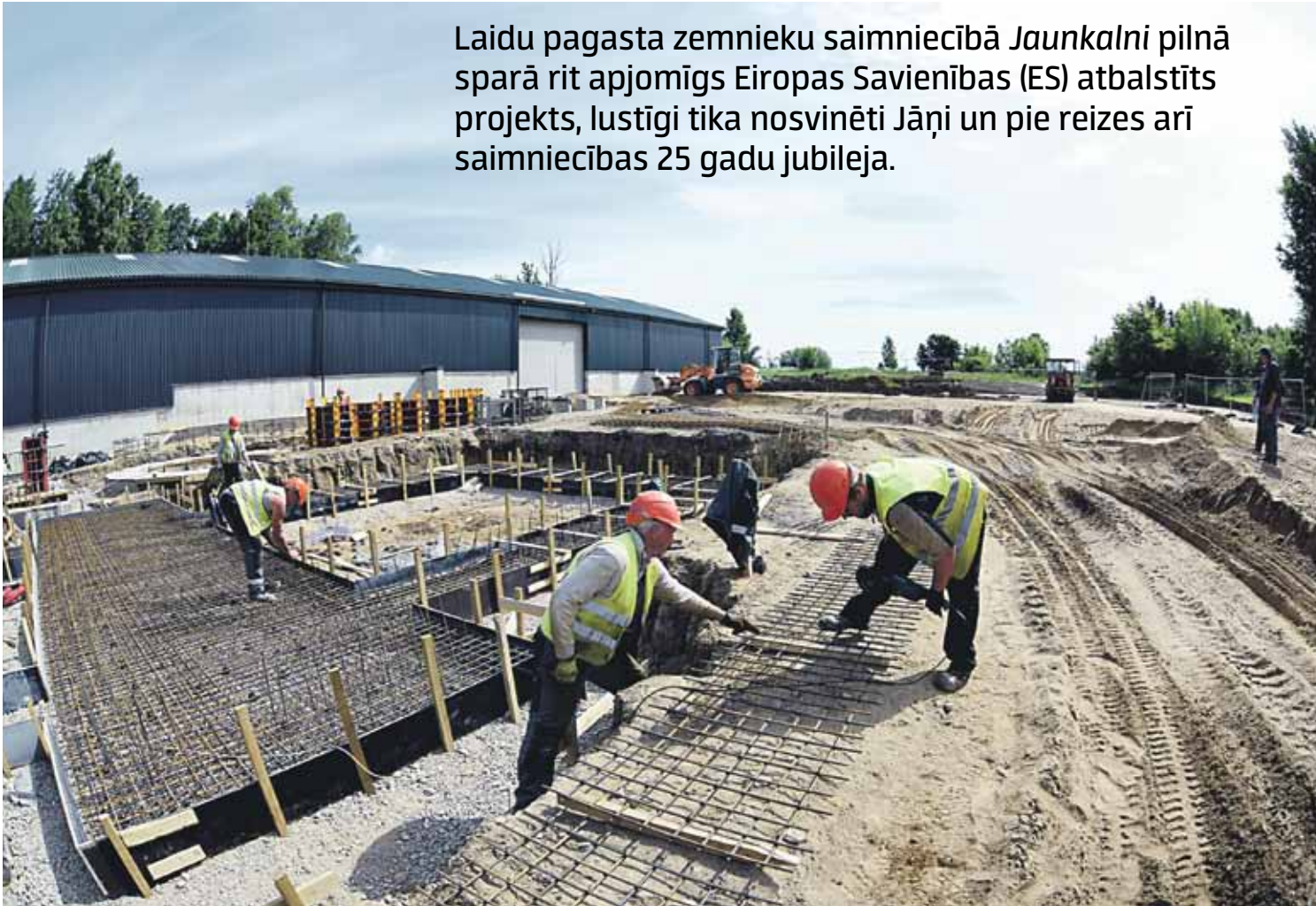
Laidu pagasta zemnieku saimniecībā Jaunkalni top jaudīga graudu kalte, ko būvē SIA Pretpils vīri.

Laidu pagasta zemnieku saimniecībā Jaunkalni pilnā sparā rit apjomīgs Eiropas Savienības (ES) atbalstīts projekts, lustīgi tika nosvinēti Jāņi un pie reizes arī saimniecības 25 gadu jubileja.