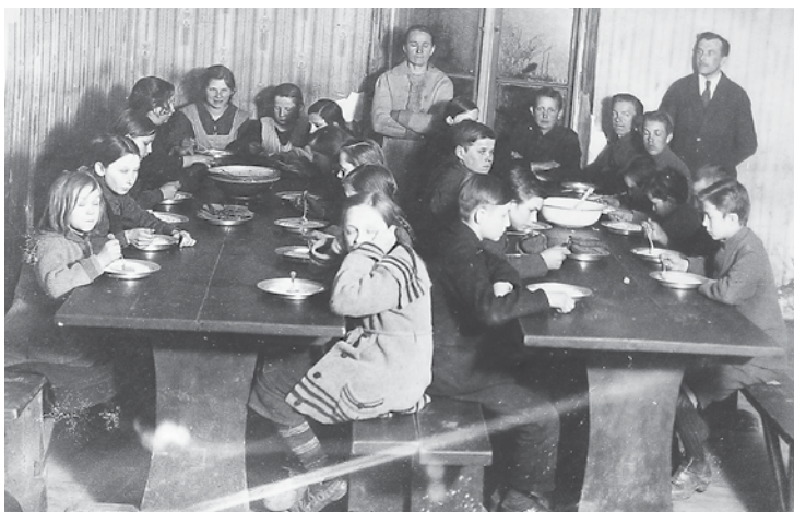
Skolas kopgalds 1924. gadā.

Tolaik skolas no valsts tika maz atbalstītas – tā deva galvenokārt malku, ko zemnieki piegādāja kļaušu kārtā. Visu pārējo gādāja skola pati. Kopgalds sāka darboties 1924. gada 3. martā. Sākumā bija tikai 32 dalībnieki, trūcīgie netika atbalstīti. Visiem, kuri gribēja skolā gulēt, bija pašiem