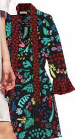
Lappusi sagatavoja Inese Slūka, interneta foto