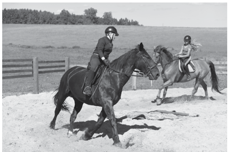
Uz Luniņiem brauc treniņos ap desmit Kuldīgas bērnu.