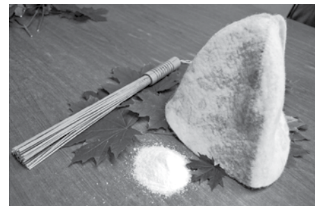
Minimālais pirts komplekts: obligātā cepure, vasaras sākuma slotiņa no kļavām, sāls skrubim un īpašās rīkstes, lai uzlabotu asinsriti zemādas slāņos.

„To mieru un atbrīvotību pēc pirts nevar aprakstīt... Kaut kur pagaist satraukums, bažas un ik-