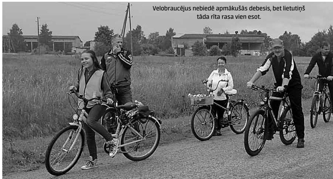
Velobraucējus nebiedē apmākušās debesis, bet lietutiņš tāda rīta rasa vien esot.