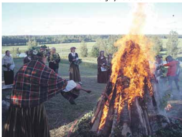
DAIGA ZVEJNICE. Sveiciens Kurzemniekam no Leišmalītes! Nosūtu fotokonkursam mirkļus no Jāņu nakts sagaidīšanas – uguns rituāla vasaras saulgriežos Kalnaišu kalnā. Kalnaišu kalns ir Nīgrandes pagasta augstākā vieta. Šeit uguns tiek degta gan vasaras saulgriežos, gan arī rudenī – Baltu vienības dienā. No kalna paveras skats par miljonu – tā pagājušā vasarā teica fonda 1836 gājēji, kuri veido maršrutu apkārt Latvijai un viesojās arī Kalnaišu kalnā.