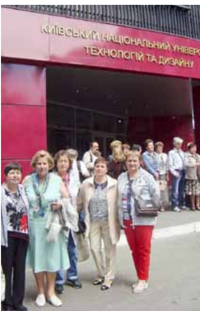
Kopā ar pārējiem salidojuma dalībniekiem pie augstskolas.

Krievijas u.c. Viņa gan ir turīga sieviete.