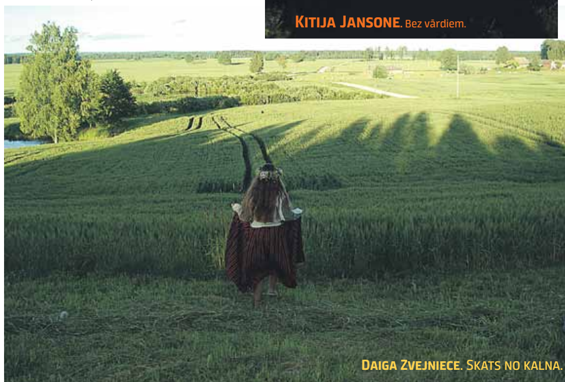
DAIGA ZVEJNICE. SKATS NO KALNA.