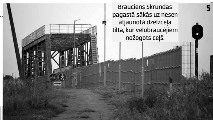
Braucieni Skrundas pagastā sākās uz nesenu atjaunotā dzelzceļa tilta, kur velobraucējiem nožogots ceļš.