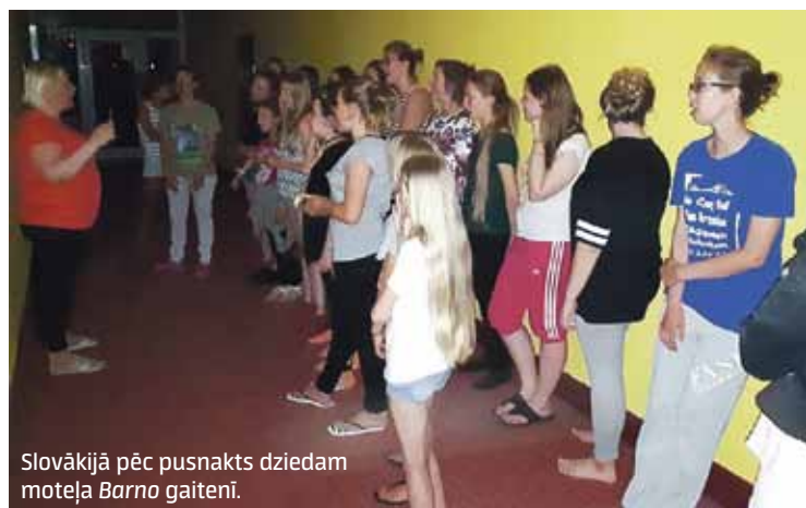
Slovākijā pēc pusnakts dziedam moteļa Barno gaitenī.