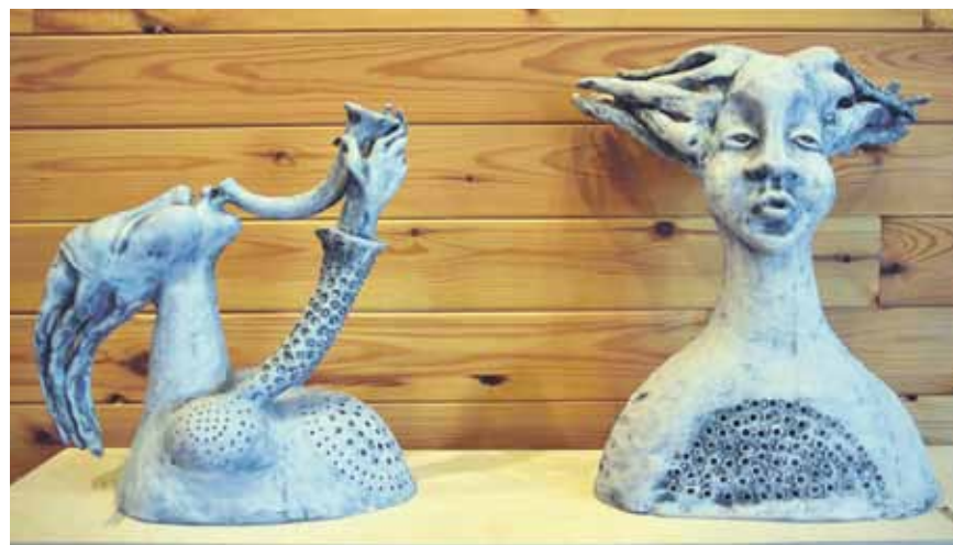
Vējš un pērcons.