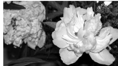
Peonijas vislabāk stādīt rudenī sausā, saulainā vietā.