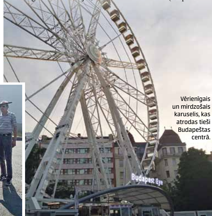
Vērienīgs un mirdzošais karuselis, kas atrodas tieši Budapeštas centrā.