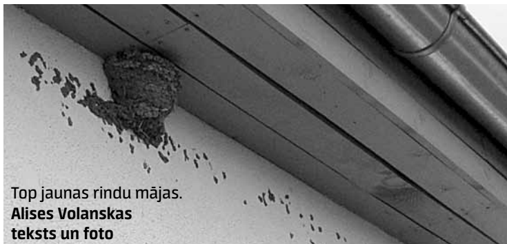
Top jaunas rindu mājas. Alises Volanskas teksts un foto