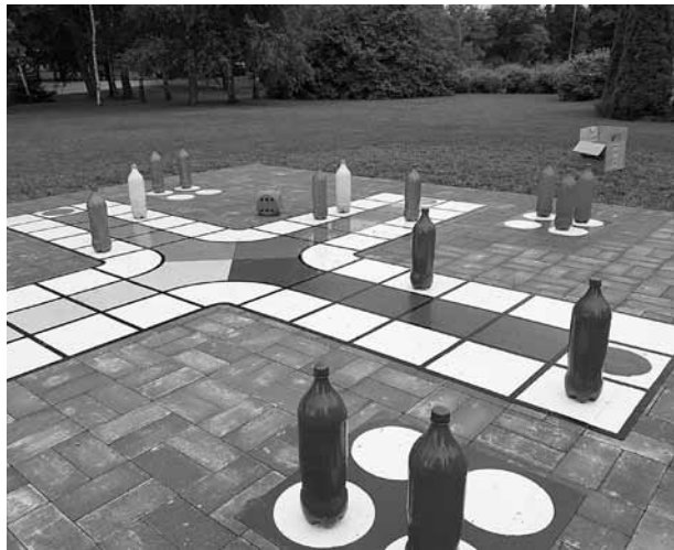
Ričurača laukumā pie Rumbas pagasta bibliotēkas varēs rīkot arī pasākumus.

Atpūtas vietas bērniem ierīkotas, īstenojot Eiropas Lauksaimniecības fonda lauku attīstībai projektu Stacionārās laukumu spēles . To piedāvā Latvijas lauku attīstības programmas apakšpasākums Darbības īstenošana saskaņā ar sabiedrības virzītas vietējās attīstības stratēģiju rīcībā „Atbalsts sabiedrisko aktivitāšu dažādošanai un teritorijas sakārtošanai” .