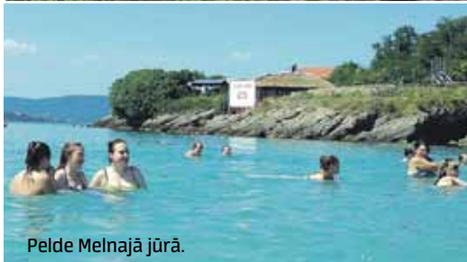
Pelde Melnajā jūrā.

ņi, izlikti suvenīri, izslavētās rožu preces un saldumi. Kad pie Melnās jūras nokļūstam dienasgaismā, esam pārsteigti par tirkīzzilo ūdeni. Pārāk ilgi priecāties gan neiznāk, jo pienāk kāds vīrietis un pieprasa samaksu, ja vēlamies šeit uzturēties. Tā nu ejam prom un atgriezāties pie baseina.