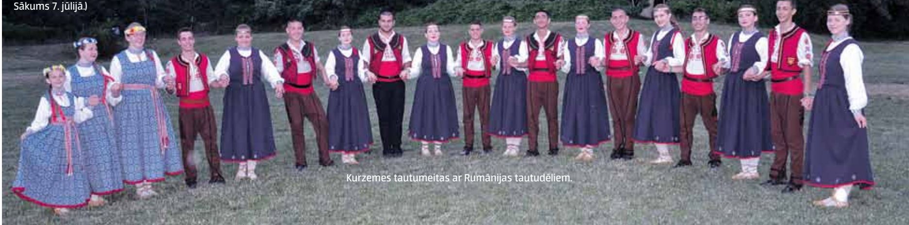
Kurzemes tautumeitas ar Rumānijas tautudēliem.