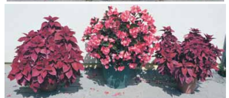
Tumšās krāsas, īpaši karoga tumšsarkanā, latviešiem ir iecienītas.