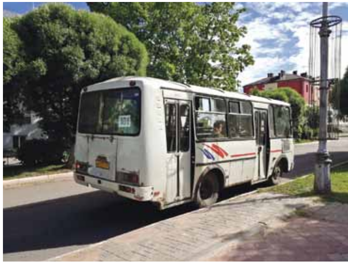
Čudovā kursē padomju laika autobusi, kuros biļetes tirgo konduktori, bet līdz Sanktpēterburgai var nokļūt ar mūsdienīgu vilcienu, kas brauc ar 120 km/h.