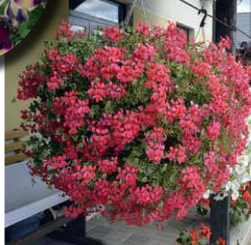
Šī jaunas šķirnes pelargoniju bumba (ar gaiši robotām lapām) izveidojusies no 16 stādiņiem.

Toveraugus pieprasa valsts un pašvaldību iestādes, viesnīcas un uzņēmumu biroji Rīgā, lai izliktu pie durvīm.