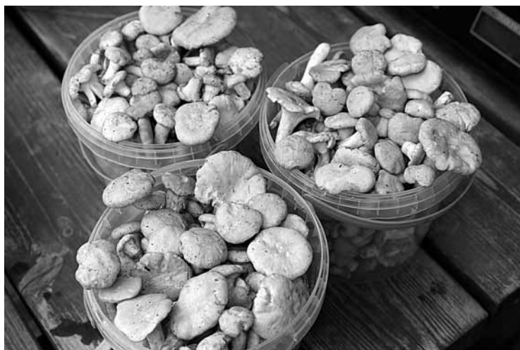
Gailēņu šovasar ļoti maz. Kuldīgā tirgotāji domā, ka pie vainas ir vēsais laiks un sausums.

„Nevaru izpaust, no kurienes sēnes nāk,” saka kurmālniece