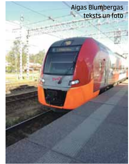
Aigas Blumbergas teksts un foto