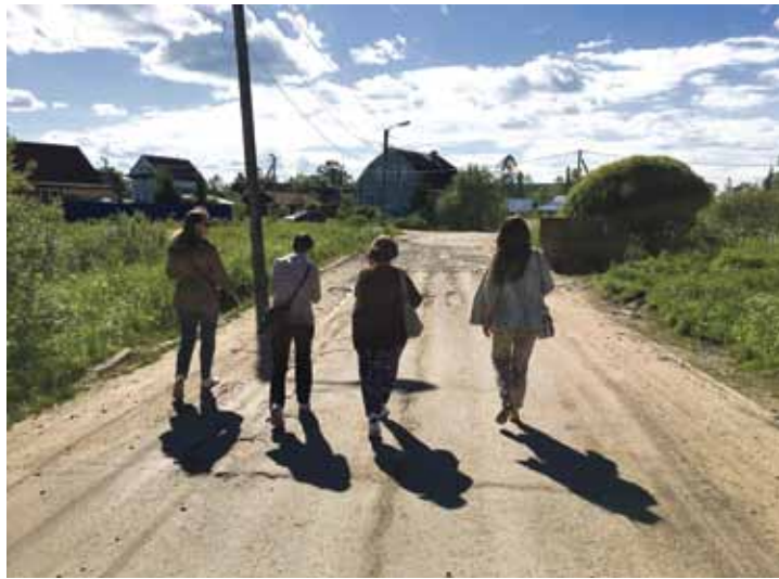
Pastaiga pa Čudovu var sākties. Jau nākamajā dienā agri no rīta šis ceļa posms noasfaltēts. Varbūt mums par godu...