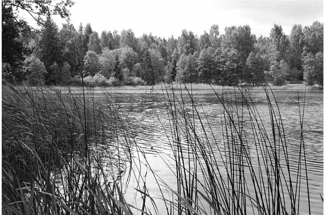
Īvandes Dzirnava ezerā skaistā laikā esot vairāk Kuldīgas atpūtnieku nekā vietējo.

Tā kā netālu ir atkritumu tvertnes, atpūtnieki lielākoties tās izmanto un apkārtni nepiemēlo. Vismaz pāris reizi nedēļā atkritumus te savāc algoto pagaidu sabiedrisko darbu strādnieki. Tomēr dažreiz kāds kaut ko salauž. „Viens ceļš pieved pie paša ūdens. To visādi cenšamies norobežot, lai taču nebrauc smiltīs iekšā! Bet tur palaikam norobežojumus salauž. Siltās vasarās te ir vairāk atbraucēju, nevis pagasta iedzi-