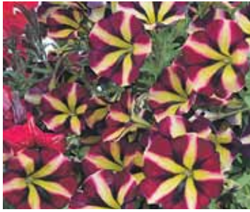
Stripainās petūnijas – modes lieta.