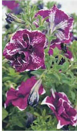
Jaunums pildīto petūniju klāstā.

* Pergola – dekoratīvs režģis vītenaugiem. Arī balstu rinda, kas tur sijas, nojume dārzos un parkos, bieži kā ēkas piebūve. Uz pergolas var arī stiprināt grozus ar augiem, lai radītu ēnu.