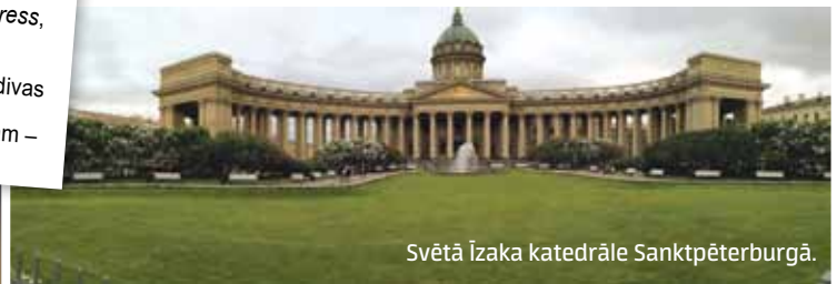
Svētā Īzaka katedrāle Sanktpēterburgā.