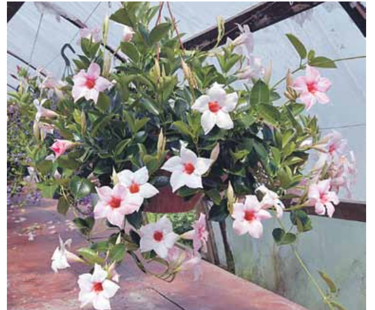
Mandevillas sāk iekarot ne tikai audzētāju, bet arī pircēju piekrišanu.

Toveraugus pieprasa valsts un pašvaldību iestādes, viesnīcas un uzņēmumu biroji Rīgā, lai izliktu pie durvīm.