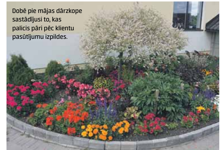
Dobē pie mājas dārzkope sastādījusi to, kas palicis pāri pēc klientu pasūtījumu izpildes.