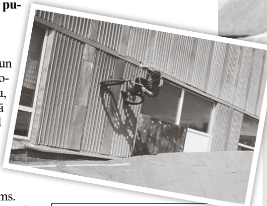
Treniņi notiek Kuldīgas skeitparkā divas reizes nedēļā – pirmdienās, ceturtdienās 17.00-19.00.

„Kad biju mazs, aizbraucu uz lielākām sacensībām, un jau tad bija sapnis kādreiz tādās piedalīties. To arī izdarīju. Šogad kvalificējos pasaules lielākajām sacensībām Simple Session Igaunijā. Tur negāja labi, tomēr ieguvi pieredzi un atbalstītājus. Vislabākajiem braucējiem pasauleslavenais sponsors Cult maksā naudu, bet citiem sponsorē visas detaļas, tostarp man. Ritenis ir dārgs, un, ja detaļas var saņemt par brīvu, tas ir ļoti labi. Ja divritenis būtu jāsaliek