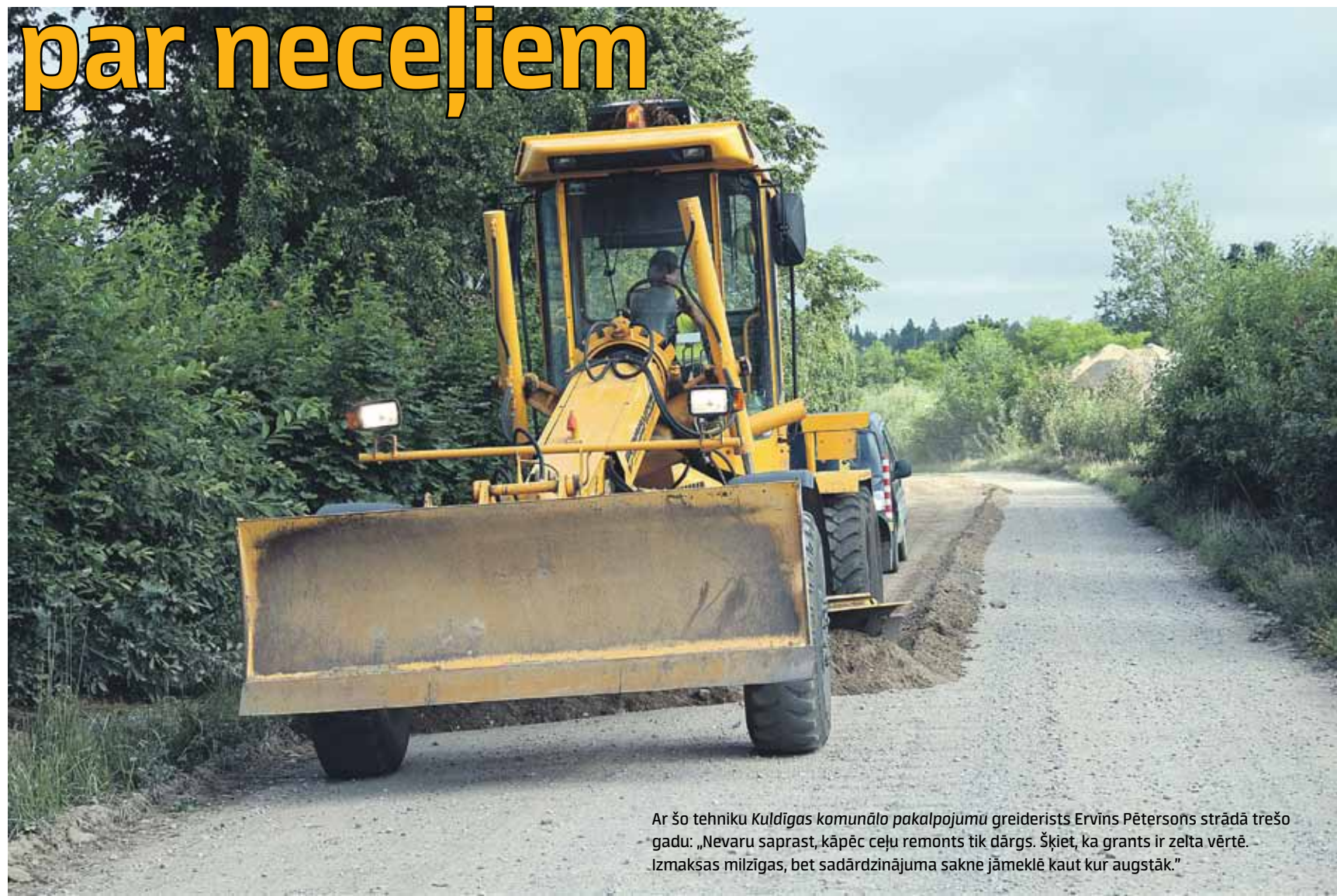
Ar šo tehniku Kuldīgas komunālo pakalpojumu greiderists Ervins Pētersons strādā trešo gadu: „Nevaru saprast, kāpēc ceļu remonts tik dārgs. Šķiet, ka grants ir zelta vērtē. Izmaksas milzīgas, bet sadārdzinājuma sakne jāmeklē kaut kur augstāk.”

A grupa – tie, kas nodrošina satiksmi starp apdzīvotām vietām vai savieno tās ar valsts ceļiem. To kopgarums ir 38,7 km, tostarp 4,1 km ir asfaltēti (10,6%) un 34,6 km ar granti un šķembām (89,4%). B grupa – ceļi, kas ved vismaz uz trim viensētām. Skrundas novadā tādi ir 54 ar 108,1 km kopgarumu. 94% ir grantēti, pārējiem vispār neskaitās, ka būtu segums. C grupa – ceļi, kas nodrošina piebraukšanu zemes īpašumiem vai mazāk nekā trim viensētām. Tādi ir 30 (kopā 48,5 km), tai skaitā 44,8 km grantēti. D grupa ietilpst ielas un stāvlaukumi pie daudzdzīvokļu mājām pilsētā, pagastu un ciemu centros. Tie gan lielākoties asfaltēti – 30 no 50 km.