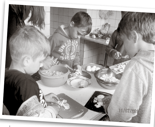
Jaunmuižā bērni mācījās gatavot maltīti sev un citiem.

Vasaras skoliņai vēl var pieteikties mazie