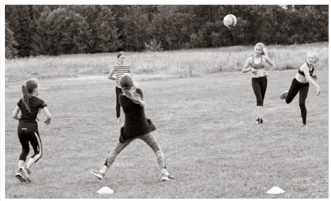
Kuldīgas novada sporta skolas vieglatlētu nometnē Īvandē bērni un jaunieši arī spēlēja komandu spēles un mācās būt saliedēti.

Ceturto gadu Kuldīgas novada sporta skola Īvandes muižā organizē nometni Vieglatlēti.