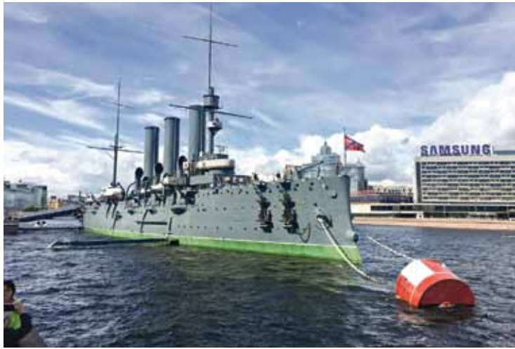
Krievijas impērijas Baltijas flotes karakuģis Aurora .