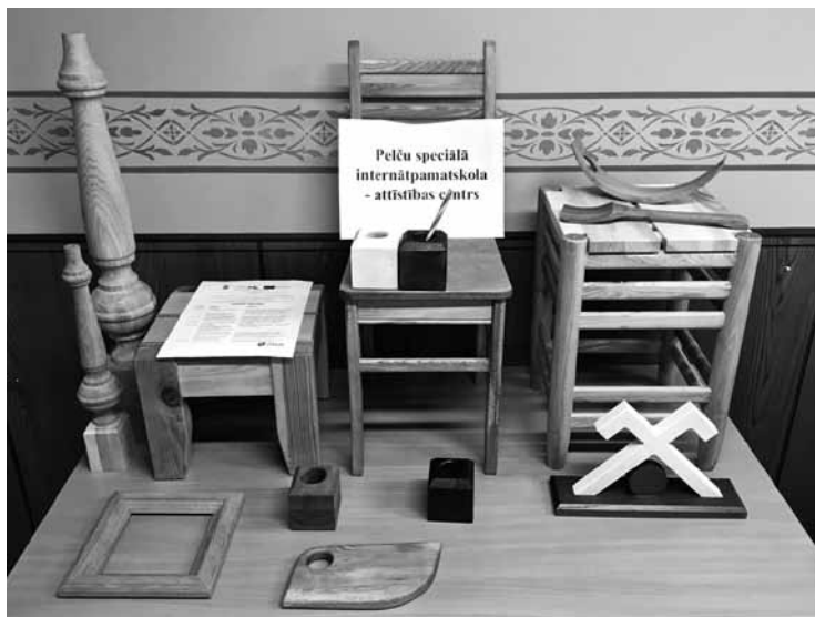
Pelču speciālās internātpamatskolas-attīstības centra audzēkņu darbi.