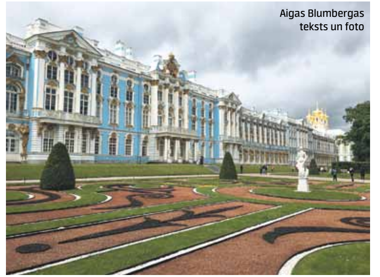
Katrīnas pils Puškinā.

Ir vēls, esam piekusuši, tāpēc somā meklēju piepūšamo spilvenu – ņemot to ārā no maciņa, līdz izraujas arī salocītie 2200 rubļi. Atkal esmu bagāta! Tagad atceros, ka, izbraucot no Latvijas, tos paslēpu, lai nav jāatdod kā kukulis uz Krievijas robežas. Pastāstu pā-