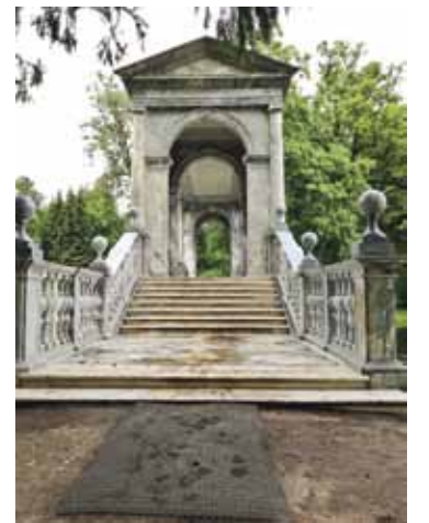
Marmora tilts Katrīnas pils parkā.

rējiem, kopā pasmejīamies. Latvijā rubļus samainu pret eiro un tieku pie jauna peldkostīma.