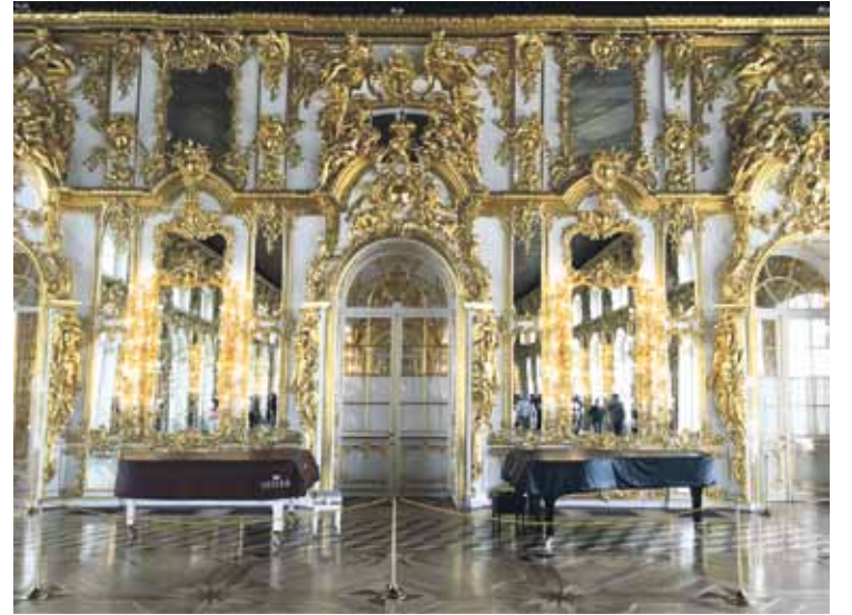
Katrīnas pils zelta zālei izmantoti 150 kg zelta.