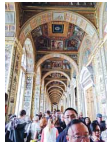
Ermitāžas bezgalīgās bagātības aptver vairāku valstu mākslu. Katrai valstij ierādītas savas telpas.