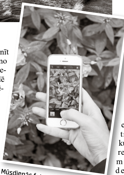
Mūsdienās fotografēt un attēlus ievietot sociālajos tīklos ir ļoti populāri.

Ļoti efektīvs portretu un pašbilžu redaktors ir Face Tune – tas ļauj padarīt fotogrāfijā iemūžināto smaīdu izteiksmīgāku, izbalināt zobus, izlīdzināt grumbiņas, noņemt no sejas dažādus plankumus, pumpas, rētas un tumšos lokus zem acīm. Tāpat tā nodrošina iespēju likvidēt tā dēvēto sarkano un balto acu efektu, mainīt matu krāsu, izveidot efektīgu grīmu un pat veikt nelielu