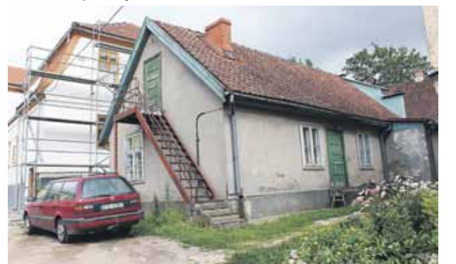
Vēl neatjaunota Kalna ielas pusē stāv maza mājiņa. Arī tā pieder pie sporta skolas kompleksa. Kad būs skaidrs finanšu avots, tad tur varēsot iekārtot telpas šahistiem.