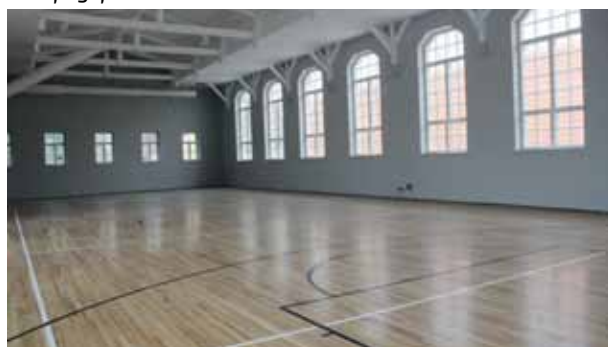
Kopš sporta zālei vairs nav restes pie logiem un lielo radiatoru gar sienām, tā visiem šķiet kļuvusi daudz plašāka un gaišāka.