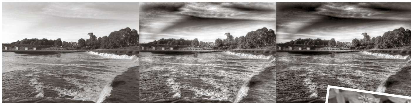
Ar aplikāciju palīdzību var piešķirt spilgtākas krāsas vai mainīt tās līdz nepazīšanai.

Katru dienu pasaulē tiek publicētas vairāk nekā 350 miljoni feisbuka un 95 miljoni instagrama fotogrāfiju, kā arī uzņemti video, kuri augšupielādēti sasniedz 300 stundas. Lai piešķirtu skaistākajiem, ar viedtālruni iemūžinātajiem dzīves mirkļiem īpašu noskaņu, pieejamas neskaitāmas bilžu un video apstrādei paredzētas mobilās aplikācijas.