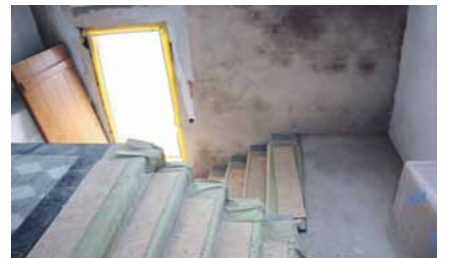
Ieeja no pagalma paredzēta cilvēkiem ar īpašām vajadzībām. Te tiks uzlikts pacelājs.