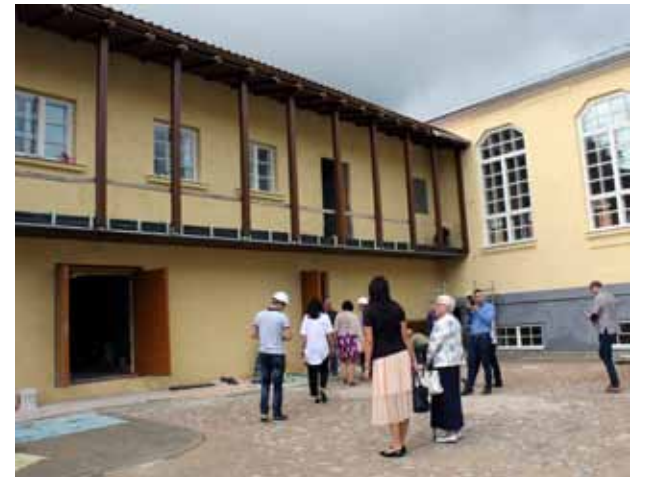
Sporta skolas pagalmi. Kreisajā pusē redzama topošā velomāja, kur darboties riteņbraucējiem.