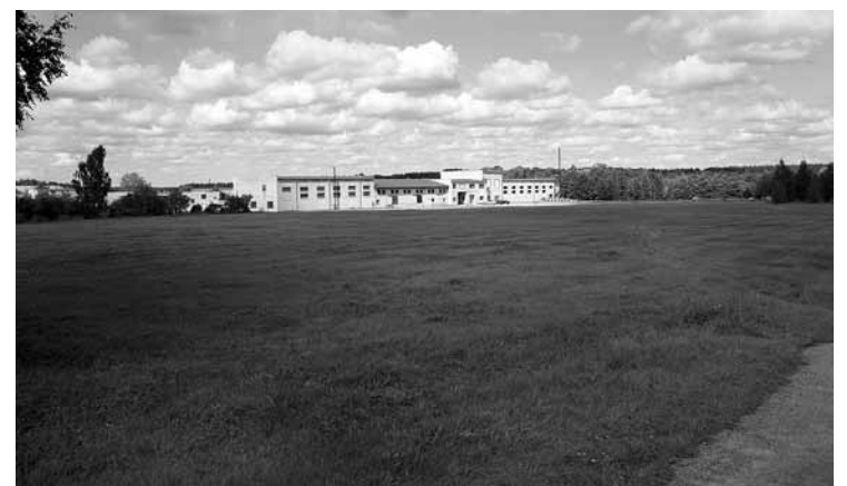
Kuldīgā, Akmeņu ielā 1 iecerēts ierīkot ģimeņu atpūtas parku.