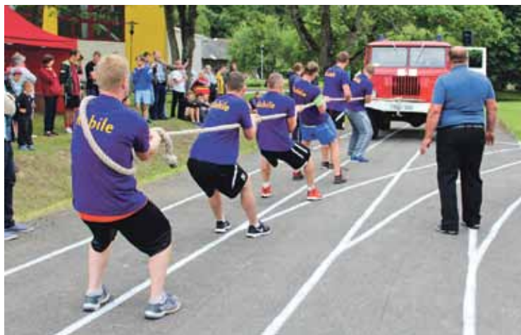
40 gadus seno ugunsdzēsības un glābšanas dienesta auto, kurš svēra ap 5 tonnām, visātrāk varēja pavilkt kabilnieki.

bija novērojama liela konkurence, un tas tikai norāda, ka sportisti gatavojās šīm sacensībām. Bija pat ārzemēs dzīvojošie novadnieki, kuri plānoja brīvdienas, lai piedalītos. Nākamgad plānojam organizēt arī aktivitātes bērniem. Liels paldies Vārmes pagasta pārvaldei un visiem iesaistītajiem – tiesnešiem, tehniskajiem darbiniekiem – par augsto profesionalitāti, kopīgi organizējot spēles.”