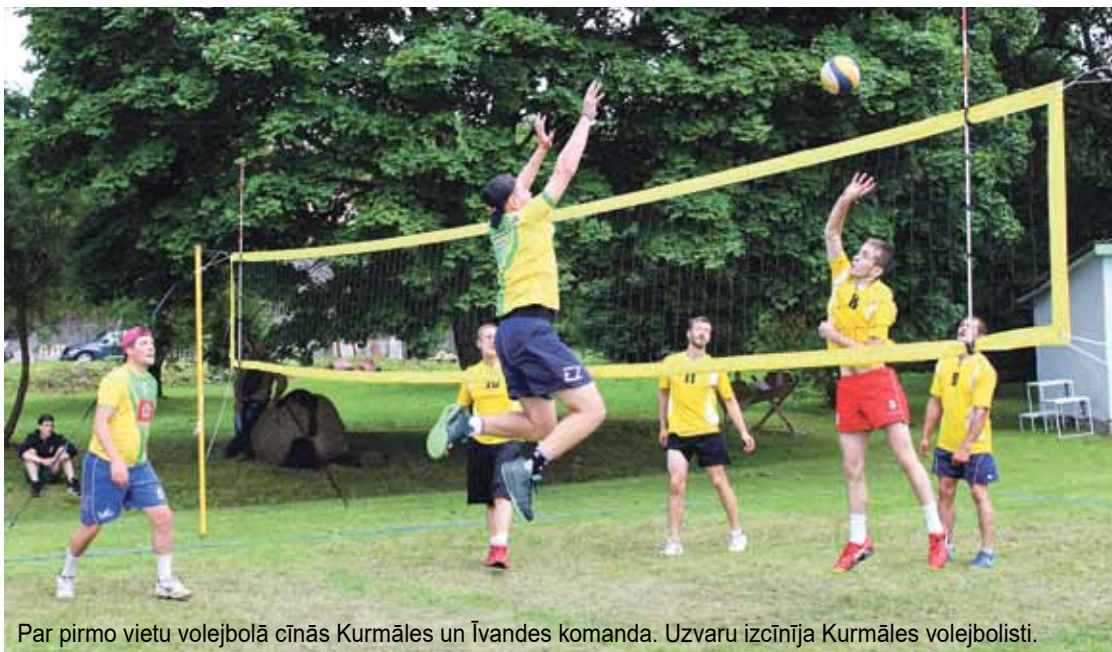
Par pirmo vietu volejbolā cīnās Kurmāles un Īvandes komanda. Uzvaru izcīnīja Kurmāles volejbolisti.