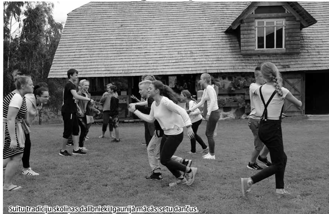
Suitu tradīciju skoliņas dalībnieki Igaunijā mācās setu dančus.

Ar braucienu uz Igauniju, setu karaļa vietnieka zemes virsū vēlēšanām, garmoškas spēlēšanu, burdonu un leelo daudzbalssīgo dziedāšanu un citām senču tradīcijās balstītām izdarībām pagājušajā nedēļā noritēja Suitu tradīciju skoliņa.