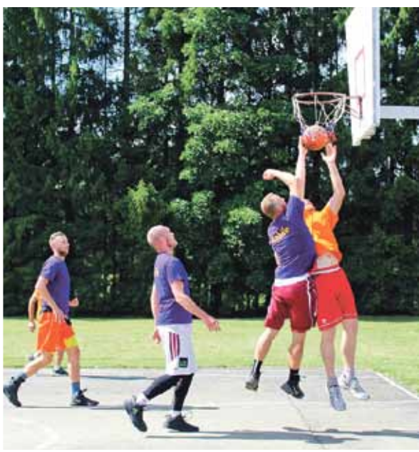
Spraigā strītbola spēlē uzvarēja Kabiles sportisti; otrie palika vārmenieki.