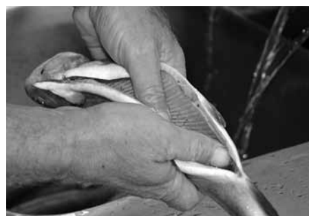
Zivij iztīra iekšas, bet galvu un žaunas atstāj, lai pircējs vēlāk nešaubītos, ka tā tiešām ir varavīksnes forele.

Daļa pāri jūrai vesto zivju tiek pārstrādātas jau uz kuģa. Anzāģei ir plāns pilnveidoties no A līdz Z, tas ir, no mazuļu pavairošanas un izaudzēšanas līdz apstrādei svaigas filejas veidā vai kūpinājumos vakuuma iepakojumā. Varbūt ar laiku arī konservos.