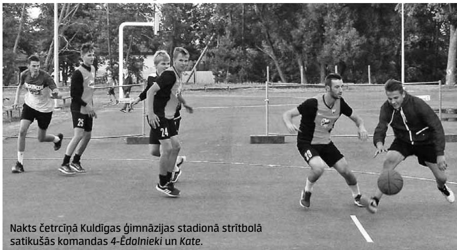
Nakts četrciņā Kuldīgas ģimnāzijas stadionā strītbolā satikušās komandas 4-Ēdālnieki un Kate .