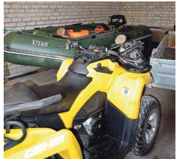
Darbā labi noder pērn iegādātā piepūšamā laiva ar dzinēju, kvadracikls un piekabe.

Jolanta Hercenberga Pašvaldības policijas arhīva foto