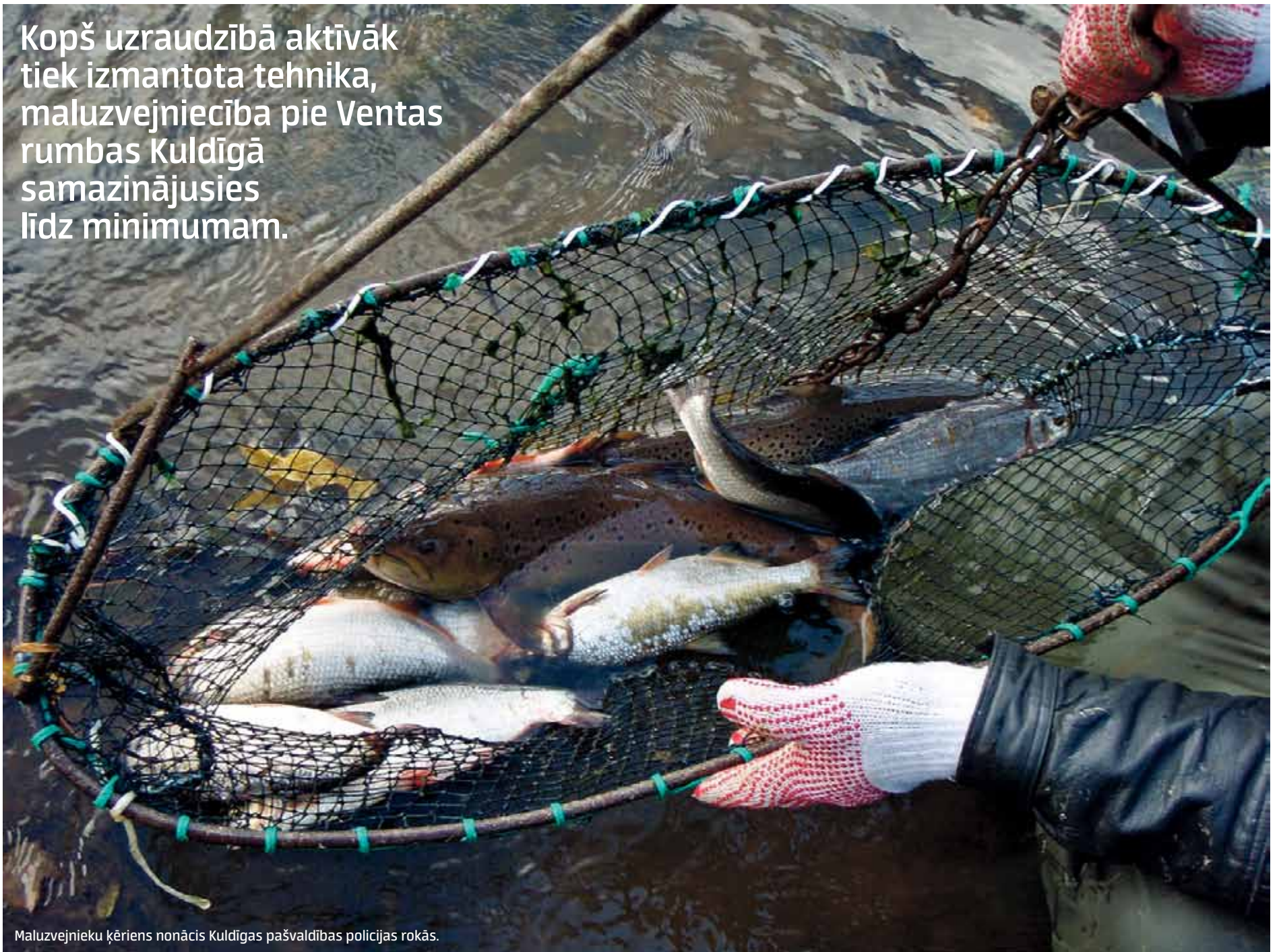
Maluzvejnieku ķēriens nonācis Kuldīgas pašvaldības policijas rokās.

Kopš uzraudzībā aktīvāk tiek izmantota tehnika, maluzvejniecība pie Ventas rumbas Kuldīgā samazinājusies līdz minimumam.