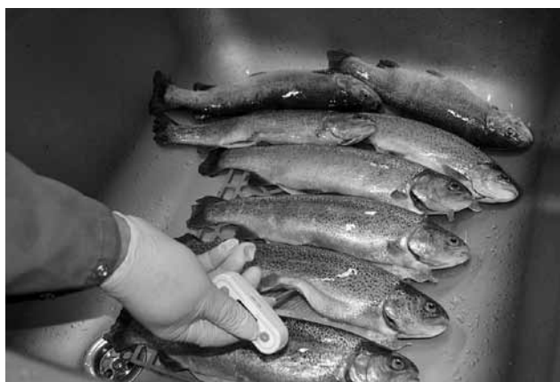
Apstrādātās zivis nevis sasaldē, bet atdzesē. Tās nogulda uz ledus gabaliņiem (speciāla iekārta tos saražo dažās minūtēs), tad uzber vēl vienu kārtu. Tādā vēsumā produkciju var pārvadāt tālu.