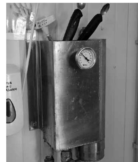
Smalka ierīce apstrādes instrumentu destilēšanai. Var diskutēt par Pārtikas un veterinārā dienesta prasībām, taču tās jāievēro, lai zivs gaļa saglabātu veselīgu uzturvērtību.