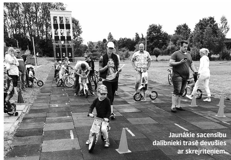
Jaunākie sacensību dalībnieki trasē devušies ar skrejriteniem.

Laika apstākļu lutināti, ap simt cilvēku no Jūrkalnes, Ventspils, Pāvilostas, Ēdoles un Kuldīgas piedalījās Alsungas sportiskajā sestdienā .