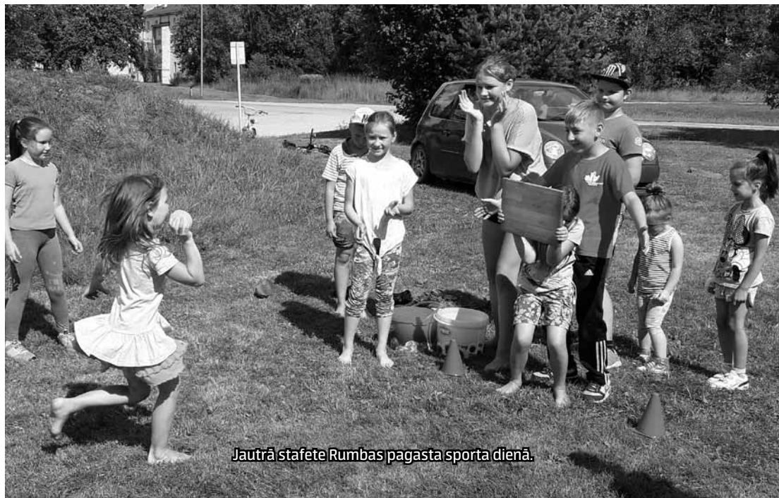
Jautrā stafete Rumbas pagasta sporta dienā.