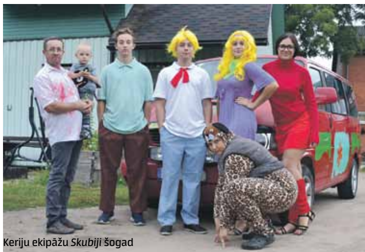
Keriju ekipāžu Skubiji šogad ietekmējuši multfilmā varoņi.