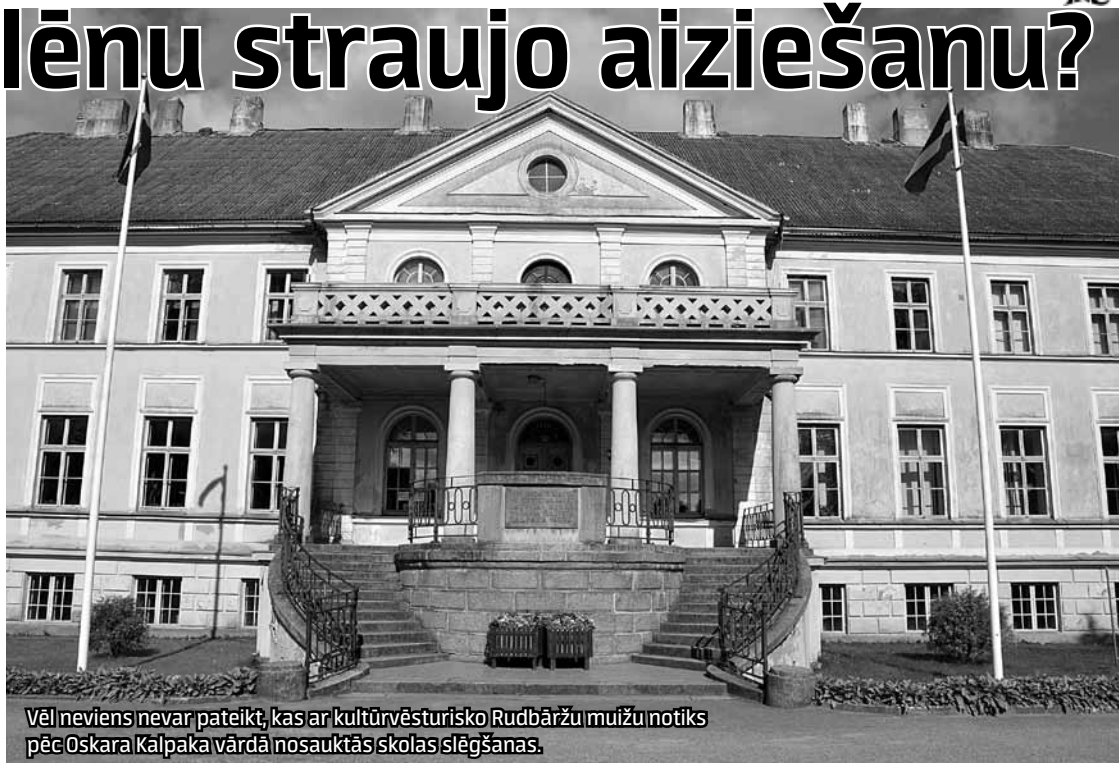
Vēl neviens nevar pateikt, kas ar kultūrvēsturisko Rudbāržu muižu notiks pēc Oskara Kalpaka vārdā nosauktās skolas slēgšanas.