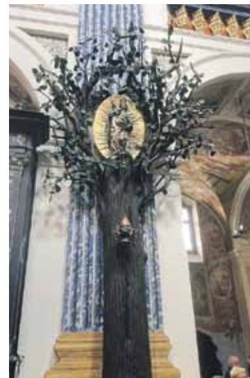
Pie otrā pīlāra galvenajā jomā atrodas liepas koks ar Dievmātes sudraba figūru, kas pēc tradīcijas stāv tajā pašā vietā, kur augs legendā minētais koks.

mentos minēta 15. gs. otrajā pusē, taču 16. gs. svētnīca sagrauta. Lai atturētu svētceļniekus, kapelas vietā uzceltas karātavas, liepa tika nocirsta, votas nozagtas, bet pati figūra iemesta ezerā.