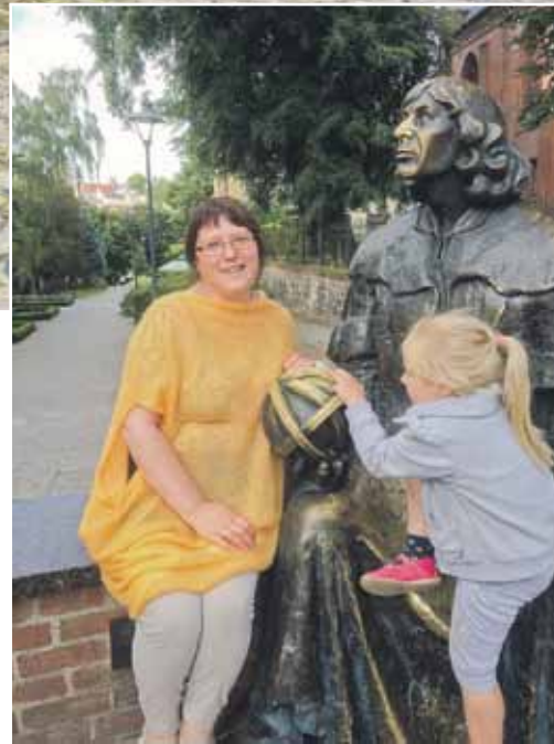
Raksta autore pie Polijas dižākā zinātnieka Kopernika pieminekļa kopā ar kādu zinātkāru meitenīti.

jums, kas ļoti izdevies, pateicoties māsām un mūsu priesterim. Visi jūtamies papildīti, apmierināti un laimīgi. Tāpēc nav viegli atvadīties no jaukās Olštīnas un viesmīlīgajiem cilvēkiem, kuri mūs uzņēma.