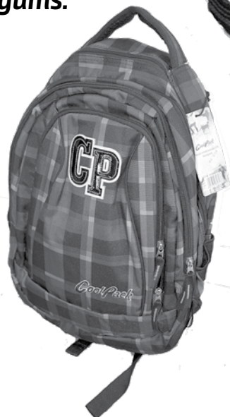
Veikalos skolas somu klāsts ir plašs, un katrs var piemēlēt sev piemērotāko. Cena – no 16 līdz 50 eiro.

„Svarīgi, lai soma mugurai pieguļ arī tad, kad tajā salikts smagums.”