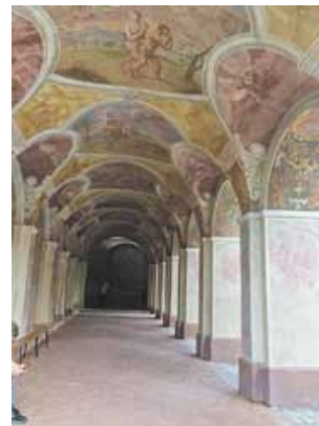
Kad lasītprasme vēl nebija populāra, klosterī Bībeli cilvēki mācījās no griestu un sienu gleznojumiem.