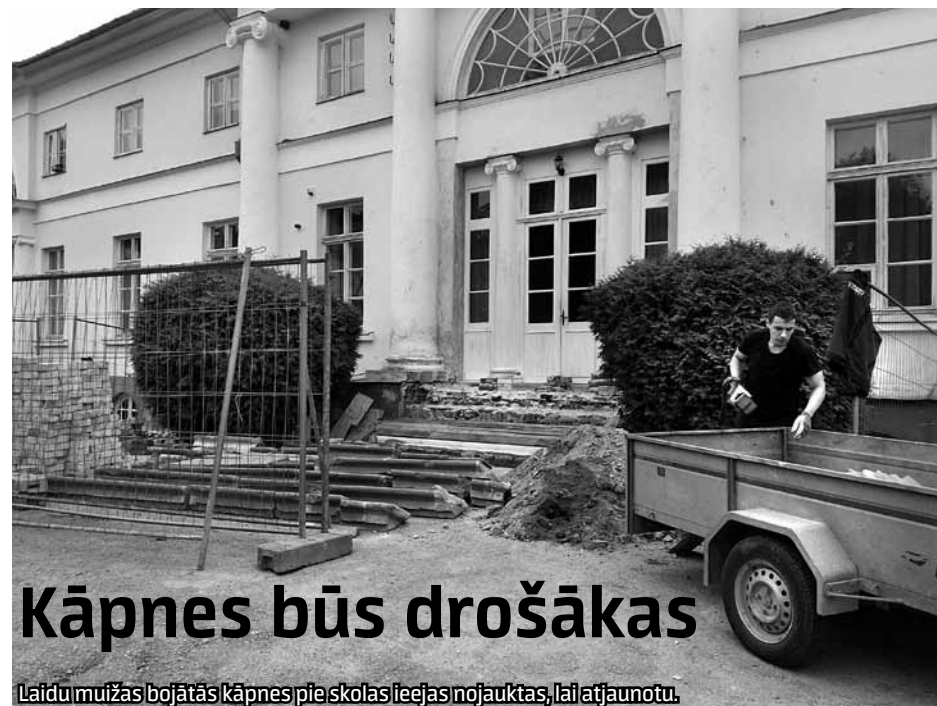
Laidu muižas bojātās kāpnis pie skolas ieejas nojauktas, lai atjaunotu.

Kuldīgas būvfirmā Genus restaurē Laidu pamatskolas ieejas kāpnis, kas laika gaitā bija izšķobījušas un kļuvušas nedrošas.