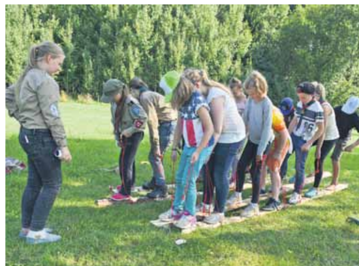
Spēles nav tikai izklaide, bet arī veids, kā trenēt veiklību un prasmi sadarboties.

J. Bubinduss atzīst: LVM pārstāvji sākumā bažījušies, kāda pēc tik daudzu bērnu dzīves mežā izskatīsies nometnes vieta. Taču beigās bijuši apmierināti un aicinājuši ciemos vēl. „Aiz skautiem nekas lieks nepaliek, viņi pat vēl savāc citu nometos atkritumus.”