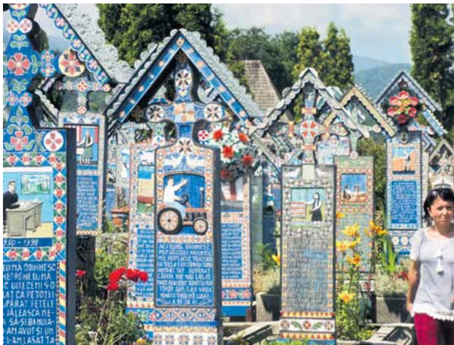
Sapantas jautrā kapsēta ir neatkārtojams stāsts par šejeniešu dzīvi un raksturiem.

pie privātajiem var norēķināties arī ar eiro, veikalos – ar kartēm), un tad prom uz tirgu! Atkal kā pie mums: ieejot tirgū, kāda dāmīte steidz piedāvāt cigaretes, protams, pa lēto , vēl ko saka. Laika nav daudz, un žigli tiek pirkti saldie un skābie ķirši, aprikozes. Pēc tam skats ir uzmanības vērts: pie pumpja nomazgājuši pirkumu, parka malā vismaz pārdesmit cilvēku, pulciņā sastājušies, pārlaimē loka iekšā sulīgās ogas.