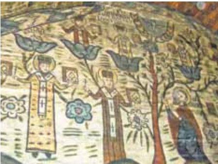
Bizantijas laika sienu gleznojumi Desesti baznīcā.