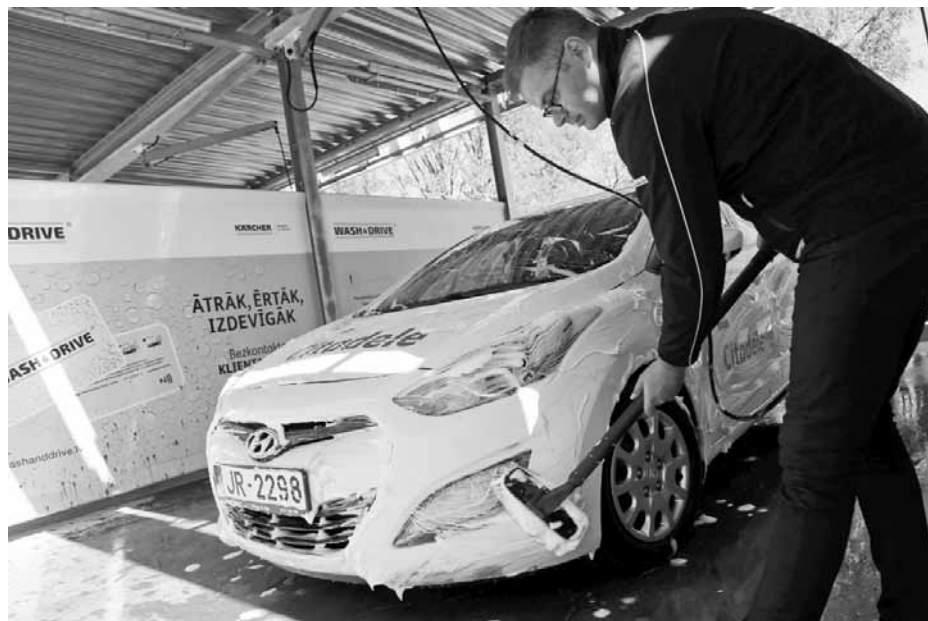
Wash and Drive atvēris divas jaunas automazgātavas – Saldū pie apvedceļa, Kuldīgas ielā 79, un Ventspilī, Durbes ielā 29.

Apmaksu pašapkalpošanās Wash and Drive automazgātavā var veikt, izmantojot monētas, kā arī maksājumu karti. Juridiskām personām mēneša beigās iespējams saņemt rēķinu par visām spēkratu mazgāšanas reizēm.