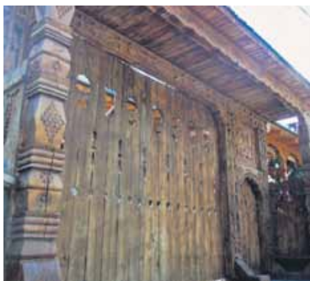
Maramurešas reģionā izsenis darbojušies meistariģi kokgriezēji, tradīcijas nav zudušas – šie vārti tapuši 1989. gadā.