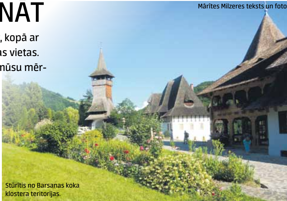
Stūrītis no Barsanas koka klostera teritorijas.