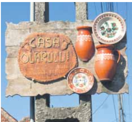
Podnieku darbnīcai garām pabraukt nevar.