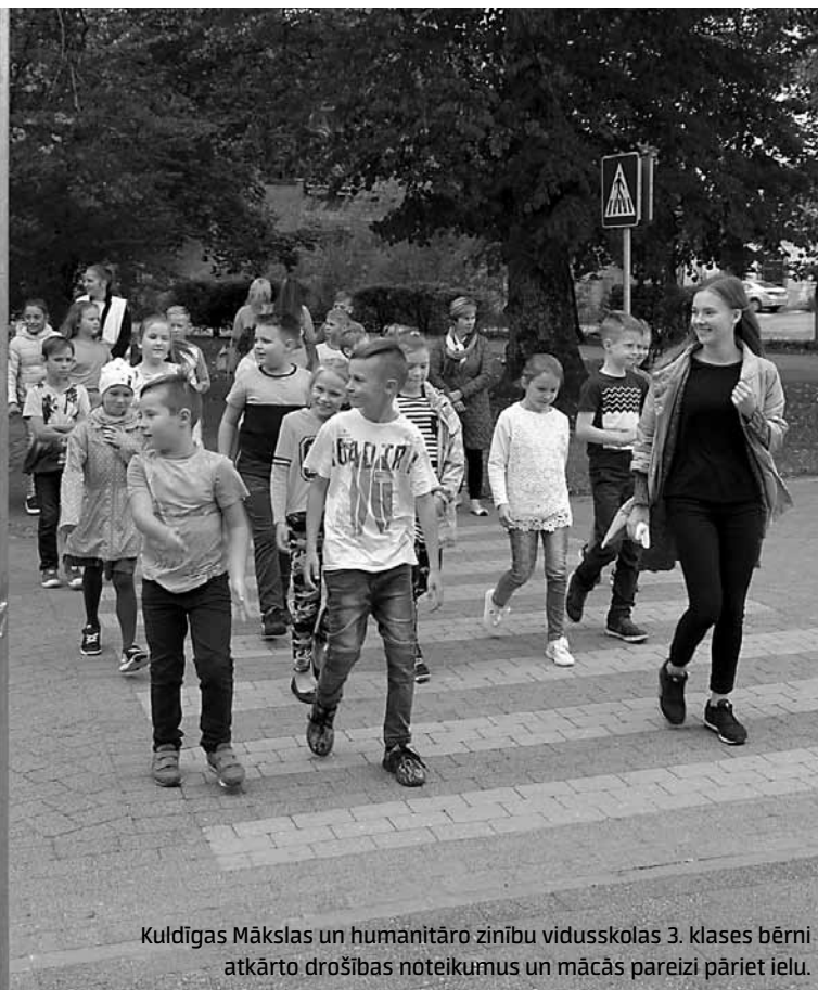
Kuldīgas Mākslas un humanitāro zinību vidusskolas 3. klases bērni atkārtro drošības noteikumus un mācās pareizi pāriet ielu.

Lai pēc garā vasaras brīvlaika bērniem atgādinātu par drošību uz ceļa, Kuldīgas Mākslas un humanitāro zinību vidusskolā 6. septembrī šādu mācību stundu 3. klasei vadīja 11. klases skolnieces.