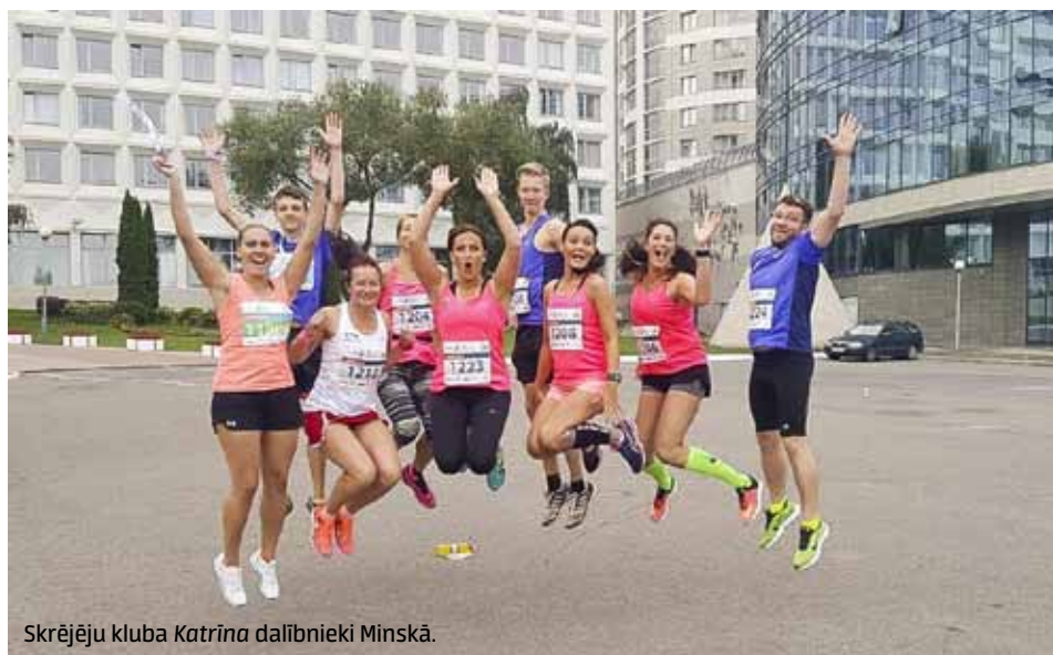
Skrējēju kluba Katrīna dalībnieki Minskā.

Otro gadu arī kuldīdznieki stājās uz starta līnijas Minskas pusmaratonā, kas šogad bijis īpaši grandiozs, jo noticis Minskas 950. jubilejas laikā.