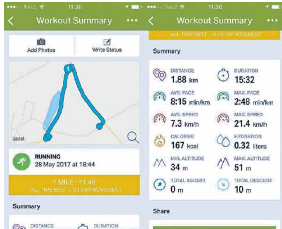
Endomondo ir viena no populārākajām lietotnēm skrējējiem, tā reģistrē laiku, kilometrus un personīgos rekordus.

Šī lietotne izstrādā svara zaudēšanas plānu, ir kā personīgais treneris un uztura speciālists, kas ir kopā ar jums visu laiku. Faktiski tā visu izdara jūsu vietā. Vien jāievada informācija, cik kilogramu gribat