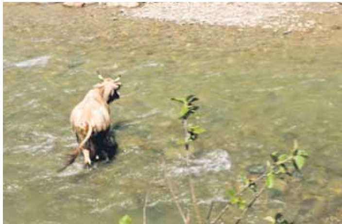
No viena krasta uz otru leknāku ganību meklējumos dodas zemnieku govīs.

19. gadsimtā liela poļu kopiena apmetusies Bukovinā, un nelielā pilsētiņā Pojana Miku-