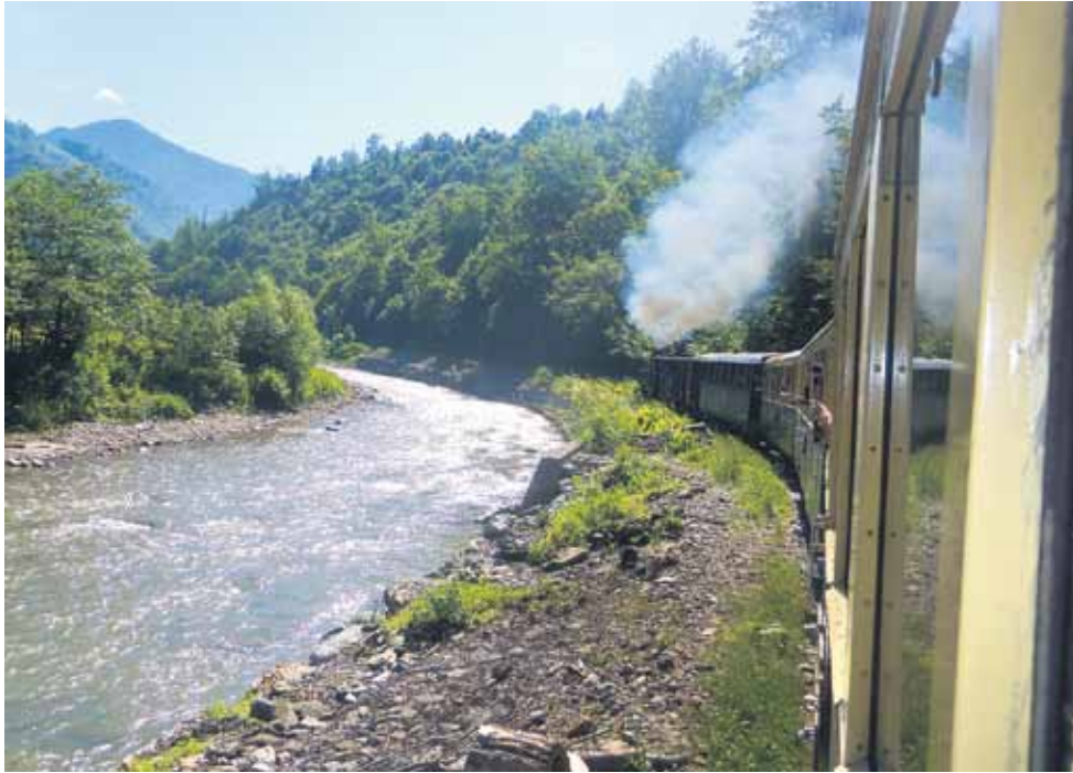
Dūmu mutuļus mezdams, bānītis mēro Karpatu meža dzelzceļu.

Pēcjaņu nedēļā kopā ar daudzus braucienos iepazīto Kuldīgas grupu cauri Polijai, pieķerot klāt pa stūrītīm no Slovākijas un Ungārijas, devos uz Rumānijas rietumu apgabaliem Maramurešu, Bukovinu un Transilvāniju.