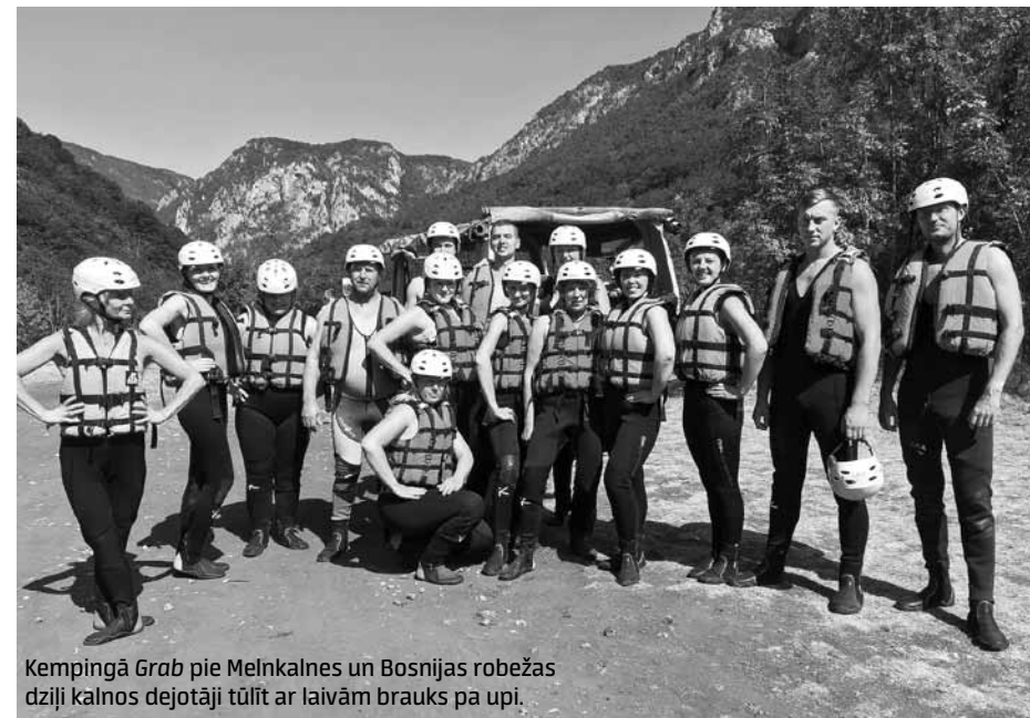
Kempingā Grab pie Melnkalnes un Bosnijas robežas dzīji kalnos dejotāji tūlīt ar laivām brauks pa upi.