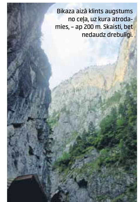
Bikaza aizā klints augstums no ceļa, uz kura atrodami, – ap 200 m. Skaisti, bet nedaudz drebulīgi.