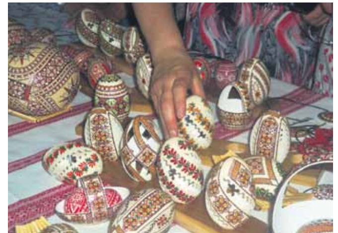
Olu čaumalas pārtapušas krāšņos mākslas darbos.

Bikaza aizu esot izgraudusi tāda paša nosaukuma upīte; braucot gar to, nešķiet, ka necilā tece ko tādu spēj. Upes nosaukums nozīmējot ‘varde’, bet neviena varde te neesot manīta, jo ūdens par aukstu. Senāk straujā Bikaza izmantota koku pludināšanai, taču, kad uz tās ierīkots dambis, vietējiem