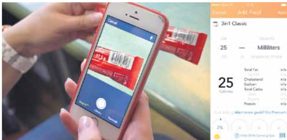
Aplikācija Lose it piedāvā svītrkodu lasītāju, lai par produktiem uzzinātu kalorijas u.c. specifisku informāciju. Tā var zināt, cik tiek apēsts.

Sports iet roku rokā ar tehnoloģijām. Arī viedtālrunos pieejams plašs speciālu programmu klāsts, kas piedāvā dažādas funkcijas veselīgam dzīvesveidam, lai atvieglotu un veicinātu sportošanu.