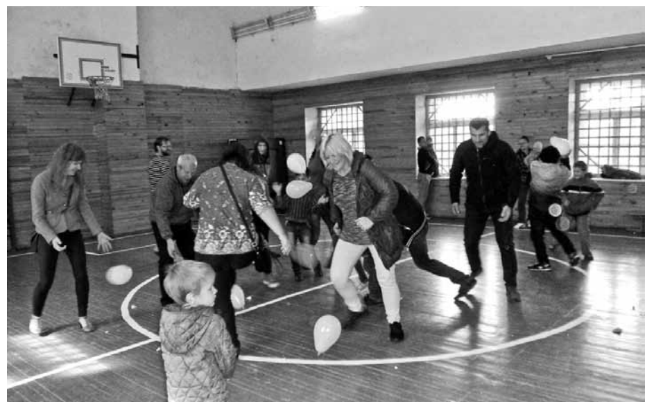
Pasākums par godu Tēva dienai vecāku vidū uzņemts ar atsaucību.