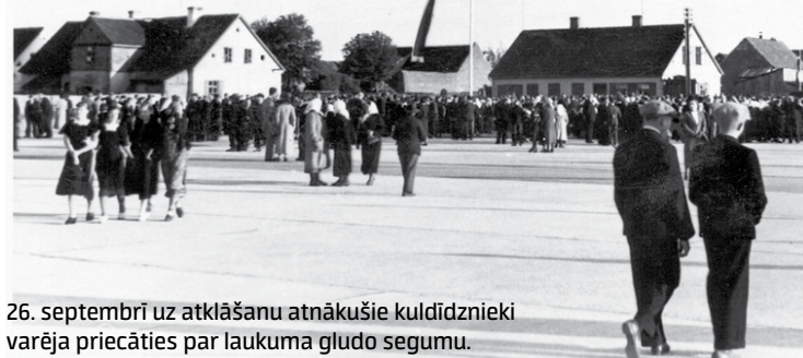
26. septembrī uz atklāšanu atnākušie kuldīdznieki varēja priecāties par laukuma gludo segumu.