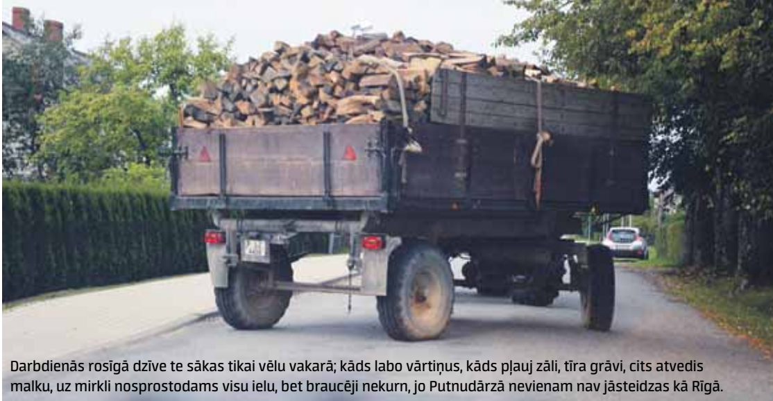
Darbdienās rosīgā dzīve te sākas tikai vēl vakarā; kāds labo vārtnis, kāds pļauj zāli, tīra grāvi, cits atvedis malku, uz mirkli nosprostodams visu ielu, bet braucēji nekurn, jo Putnudārzā nevienam nav jāsteidzas kā Rīgā.

Dzelzceļa iela Putnudārzā savu vārdu noturējusi pie visām varām. Vietējie zina teikt, ka pirmās Latvijas brīvvalsts laikā te domāts būvēt dzelzceļu uz Stendi. Tagad tā ir viena no artērijām, kas ved uz vairākām šķērsielām.