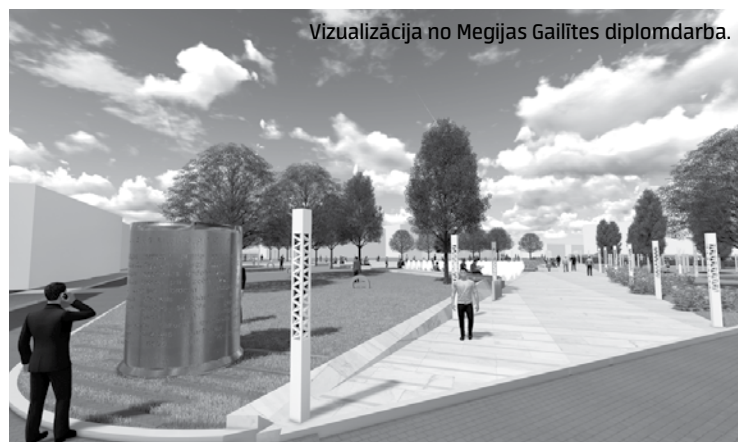
Vizualizācija no Megijas Gailītes diplomdarba.