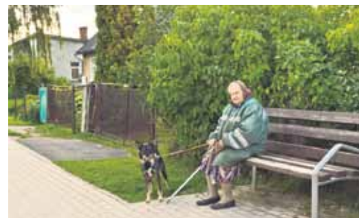
Elgas kundze no 14. nama priecājas, ka nu Dzelzceļa iela sakārtota kā pilsētas centrā un ierīkoti soliņi, kur piesēst un atpūtināt kājas, ja pastaiga ar suni bijusi pagarāka.