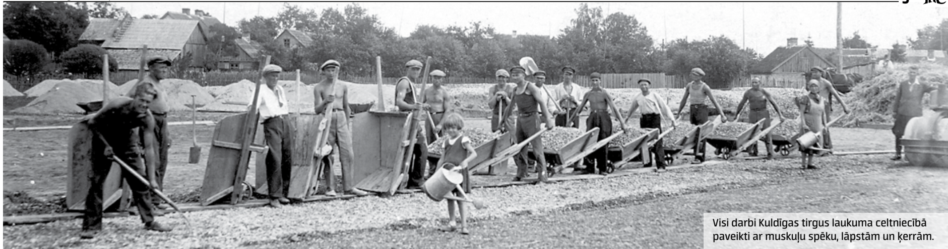
Visi darbi Kuldīgas tirgus laukuma celtniecībā paveikti ar muskuļu spēku, lāpstām un ķerrām.