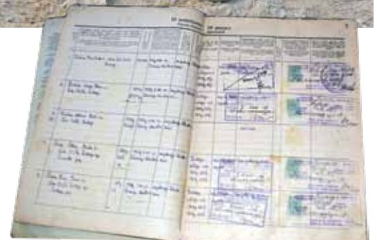
Dzelzceļa ielas 19. nama bēniņos vēl glabājas mājas grāmata, kādu padomju gados izsniedza milicija pilsoņu pierakstīšanai.