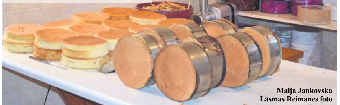
Maija Jankovska