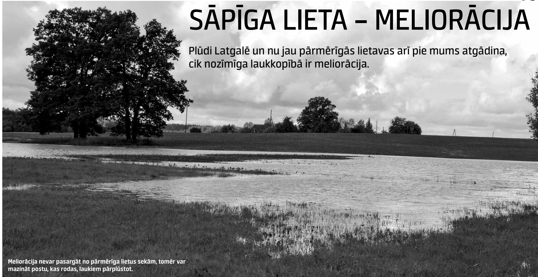
Meliorācija nevar pasargāt no pārmērīga lietus sekām, tomēr var mazināt postu, kas rodas, laukiem pārplūstot.

Plūdi Latgalē un nu jau pārmērīgās lietavas arī pie mums atgādina, cik nozīmīga laukkopībā ir meliorācija.