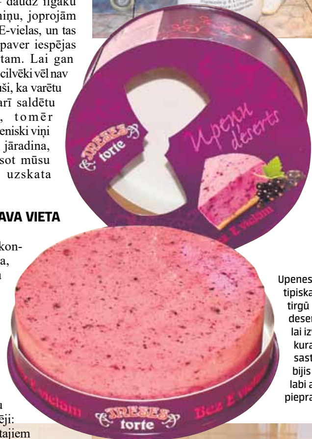
Upenes nav viena no tipiskajām sastāvdaļām tirgū pieejamajiem desertiem, līdz ar to, lai izveidotu torti, kuras galvenā sastāvdaļa ir upenes, bijis risks, taču tas labi atmaksājies – pieprasījums ir liels.