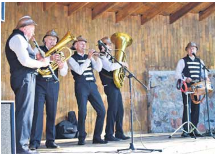
Viesus izklaidēja pūtēju ansamblis Pažarnieku dixi .

jam, un mūsu gaļas produkti ir ļoti pieprasīti.”