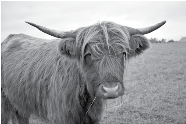
Ganībās ar dambriežiem draudzīgi sadzīvo Hailanderu šķirnes liellopi.

Pelču pagasta saimniecība Liepnieki EKO šīgada 4. septembrī saņēmusi bioloģiskās saimniecības sertifikātu. Jau no pagājušā rudens, braucot no Kuldīgas uz Pelčiem, kreisajā pusē redzami divarpus metrus augsti žogi – te ierīkoti aploki dambriežiem un liellopiem.