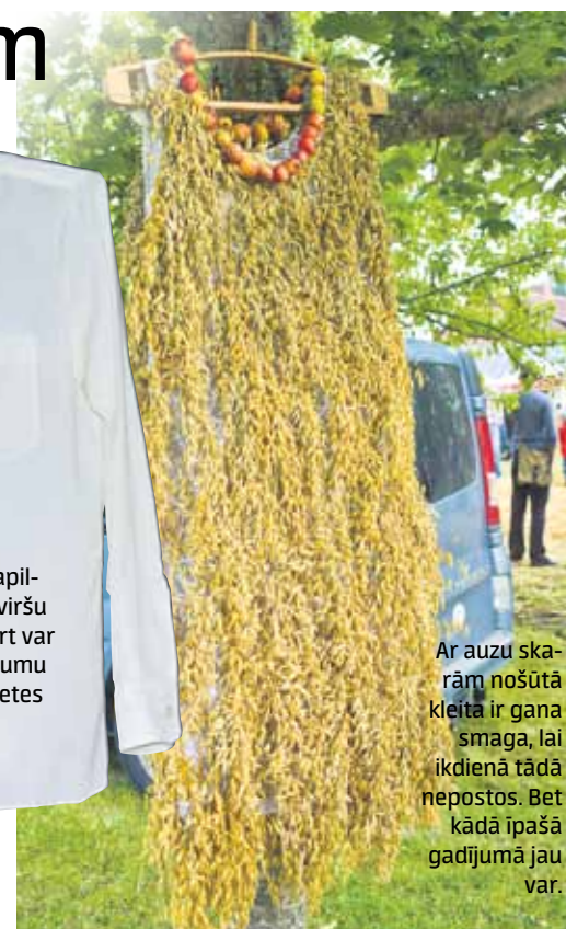
Ar auzu skarām nošūtā kleita ir gana smaga, lai ikdienā tādā nepostos. Bet kādā īpašā gadījumā jau var.