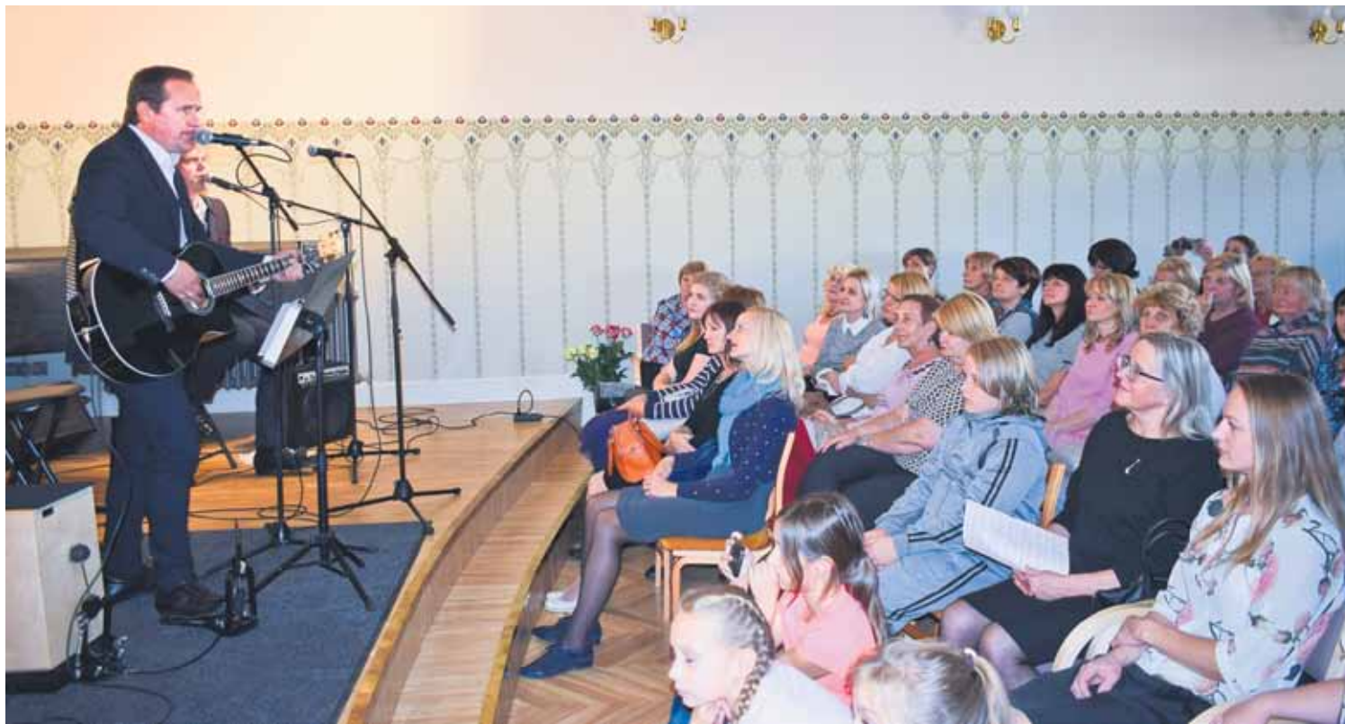
Dzejnieks, komponists un mūziķis Guntars Račs sava talanta cienītājiem Kuldīgā dzeju lasīja un to arī izdziedāja.

Paša autora nolasīts dzejolis dzimšanas dienā un kopīgas dziesmas – tik sirsnīga bija Kuldīgas bibliotēkas rīkotā tikšanās ar dzejnieku un mūziķi Guntaru Raču un viņa krājuma 365 pirmās daļas prezentācija mūzikas skolā.