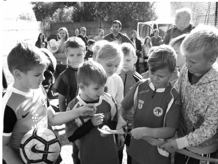
Atklājot mākslīgā futbola laukumu A.Grundmaņa stadionā Kuldīgā, ikviens varēja par piemiņu nogriezt gabaliņu lentes.

Biedrība Es par futbolu programmas LEADER projektā saņēma 45 000 eiro no Lauku atbalsta dienesta, 5000 eiro – no Kuldīgas novada pašvaldības. Kurzemnieks jau rakstījis, ka