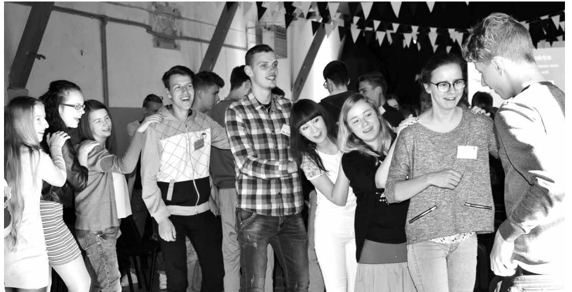
Jauniešu forums sākās ar dažādām spēlēm, lai palīdzētu jauniešiem iejusties un sadraudzēties.