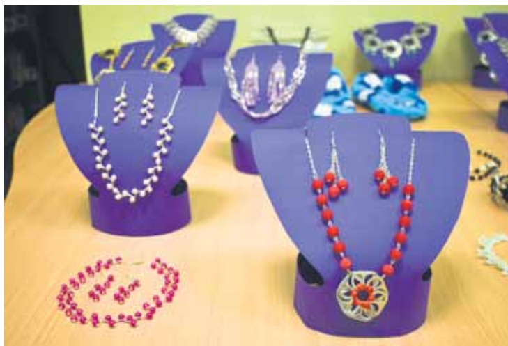
Pērļītes rotām tiek pasūtītas internetā.