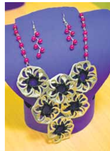
Kaklarota no skārdeņu attaisāmajiem.