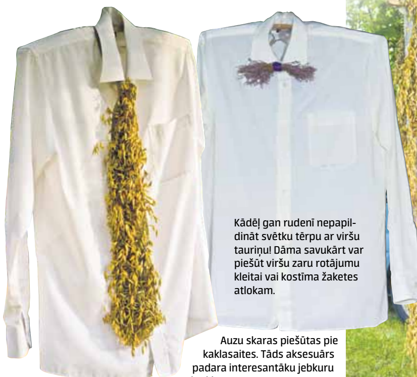
Kādēļ gan rudenī nepapildināt svētku tērpu ar viršu tauriņu! Dāma savukārt var piešūt viršu zaru rotājumu kleitai vai kostīma žaketes atlokam.