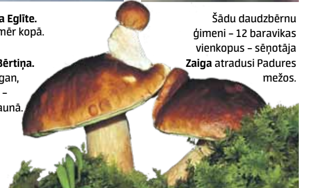
Šādu daudzbrūnu ģimēni – 12 baravikas vienkopus – sēņotāja Zaiga atradusi Padures mežos.