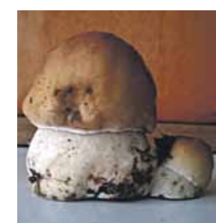
Gunta Eglīte. Vienmēr kopā.