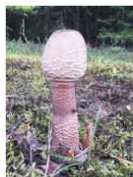
Inguna Spuleniece, Lauras Dzērves arhīva un Lāsma Reimanes foto