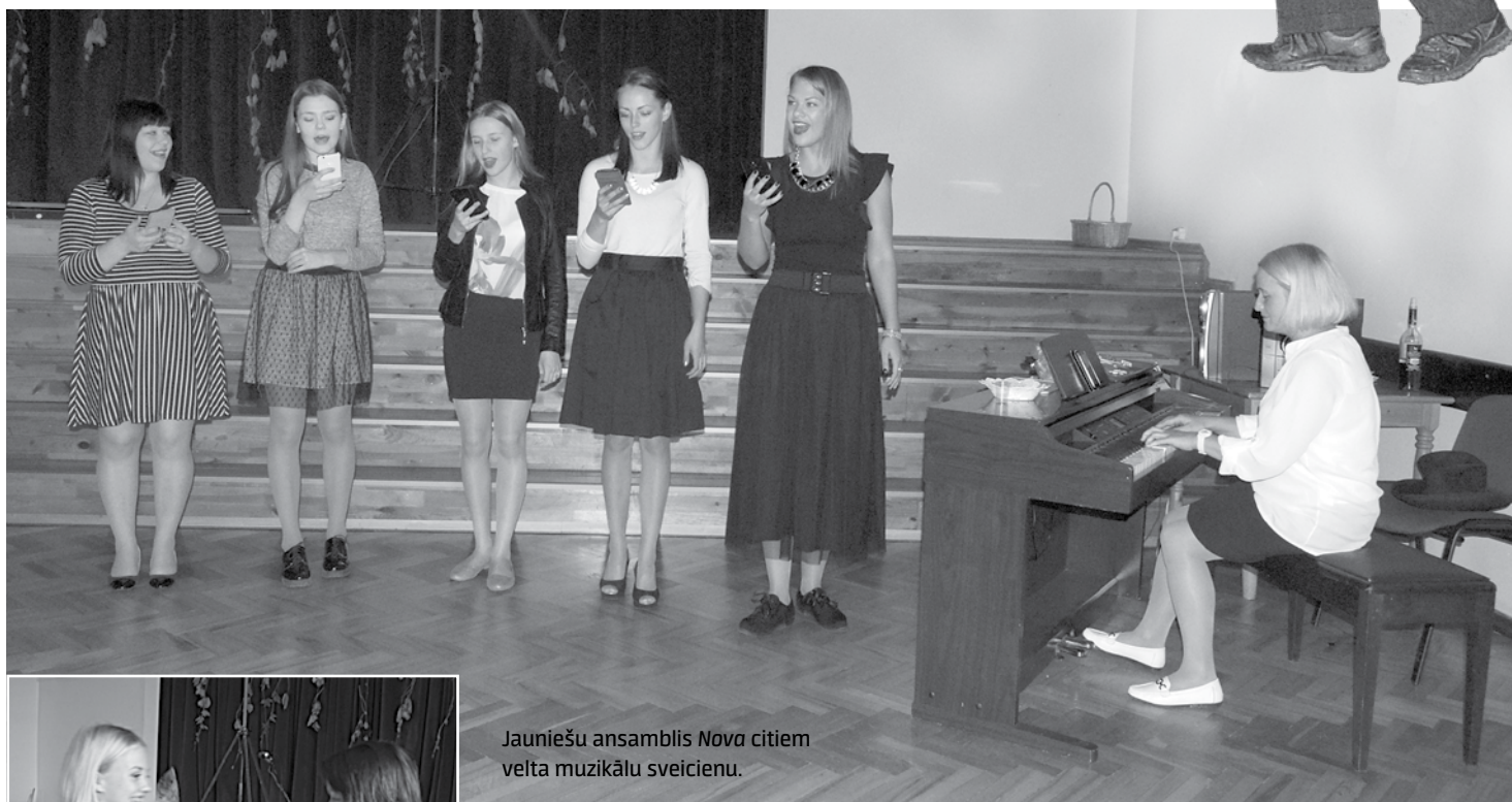
Jauniešu ansamblis Nova citiem velta muzikālu sveicienu.