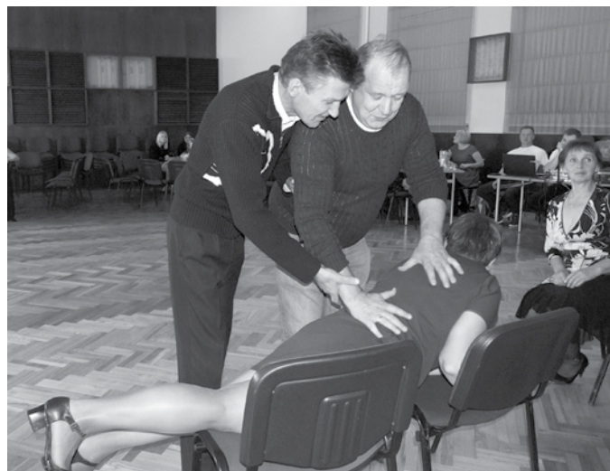
Amatierteātra aktieri apsveikumā citiem kolektīviem rāda improvizāciju.