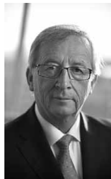
Žans Klods Junkers, Eiropas Komisijas prezidents