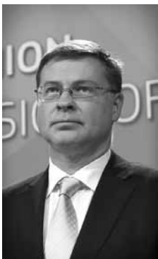
Valdis Dombrovskis, Eiropas Komisijas viceprezidents