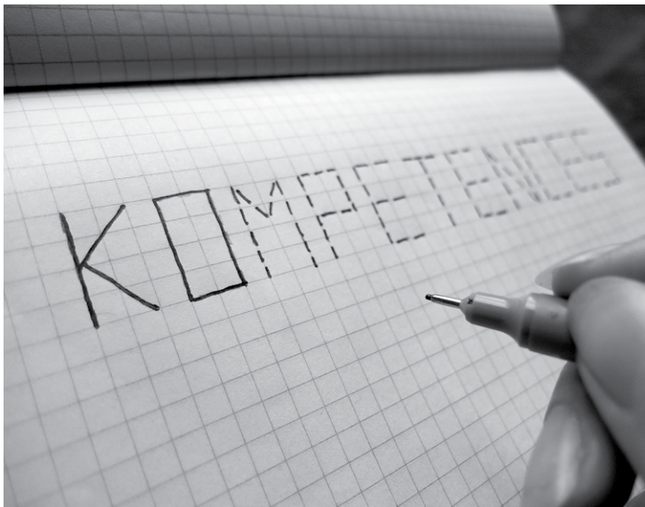
Kamēr daļa skolu vēl tikai cenšas saprast, ko ietvers jaunais izglītības modelis, citas izvēlējušās piedalīties tā veidošanā.