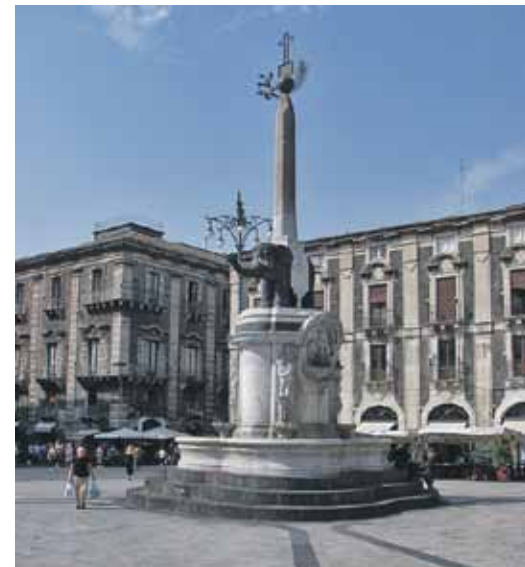
48. kārtas atbilde: La Scala (Teatro alla Scala), Milāna, Itālija.

Pilsētas centrālajā laukumā iepretī katedrālei atrodas melna zilonu statuja, kas ir arī strūklaka ar dīvainu, 3,66 metru augstu obelisku uz muguras. Tā tur stāv jau kopš 1736. gada. Konstrukcija lielākoties atgādina Indiju vai Taizemi, tomēr tā ir ļoti populāra pazīšanās zīme tieši šai vietai. Zilonis ir spēka, uzticības un ilgas dzīves simbols. Domājams, ka tuvumā esošā vulkāna izvirdumu dēļ tas izmantots veiksmēi.