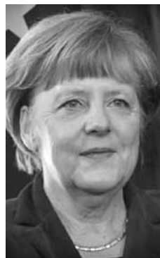
Angela Merkele, Vācijas kanclere