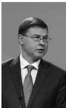
Valdis Dombrovskis, Eiropas Komisijas viceprezidents