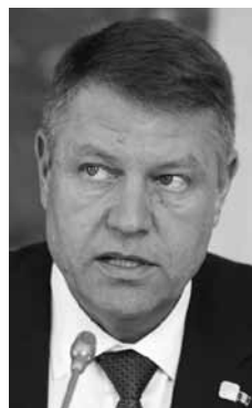
Klaus Johannis, Rumānijas prezidents