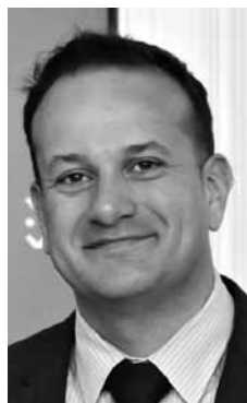
Leo Varadkar, Īrijas premjerministrs