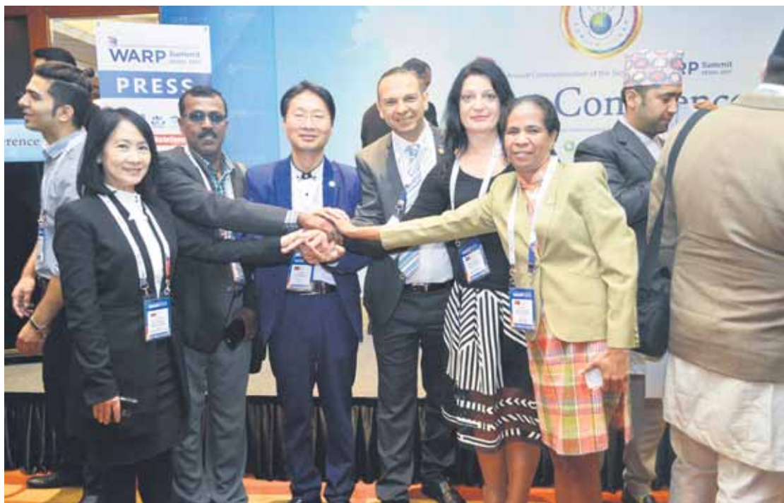
Pēc konferencēm, kurās blakus sēdošie jau bija iepazinušies un šo to pārrunājuši, ikreiz notika fotografēšanās.

Viesnīcā ik uz soļa ievēroju, ka tehnoloģijas tiek izmantotas daudz plašāk nekā pie mums. Cilvēku tur