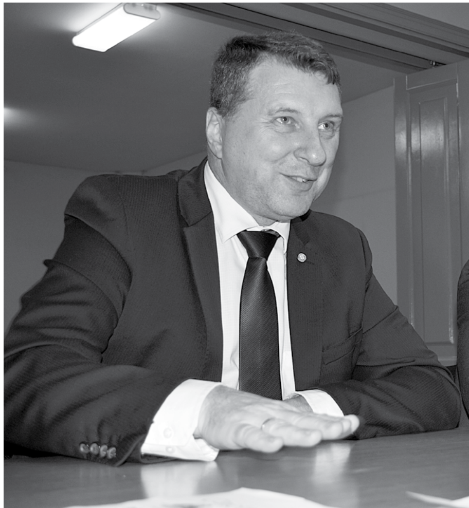
„Stipras valsts pamatā ir neatkarīgi mediji,” intervijā Kurzemnieka redakcijā atzina Valsts prezidents Raimonds Vējonis.

Otrdien apmeklējot Kuldīgu, Valsts prezidents Raimonds Vējonis bija izteicis vēlmi tikties ar vietējiem žurnālistiem. Kurzemnieks prezidentu uzaicināja uz sarunu redakcijā. Tajā klāt bija arī Jauno žurnālistu skolas dalībnieces.