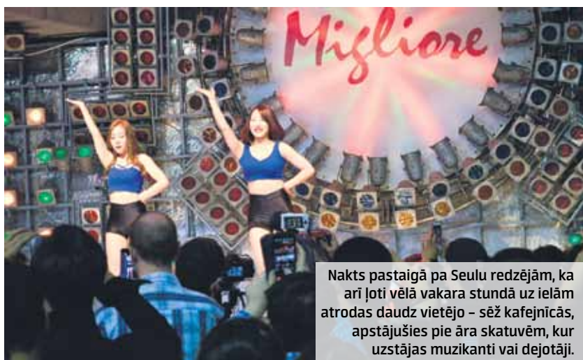
Nakts pastaigā pa Seulu redzējām, ka arī ļoti vēlā vakara stundā uz ielām atrodas daudz vietējo – sēž kafējnīcās, apstājušies pie āra skatuvēm, kur uzstājas muzikanti vai dejojāji.