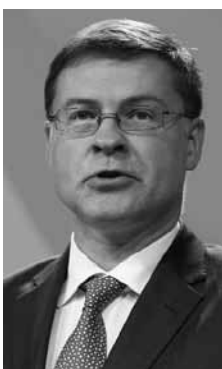
Valdis Dombrovskis, Eiropas Komisijas viceprezidents