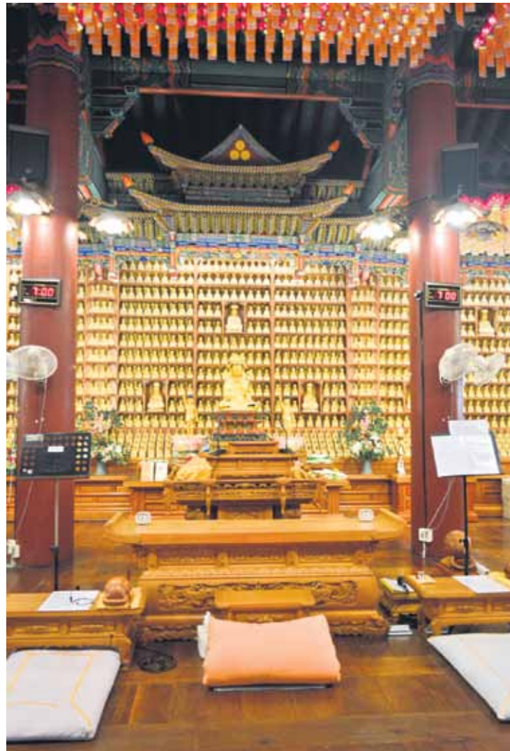
Vienā no budistu tempļa ēkām vietējie atstāj figūriņas, pie kurām pēc tam nāk aizlūgt par mirušajiem tuviniekiem.