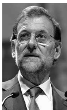
Mariano Rahojs, Spānijas premjerministrs