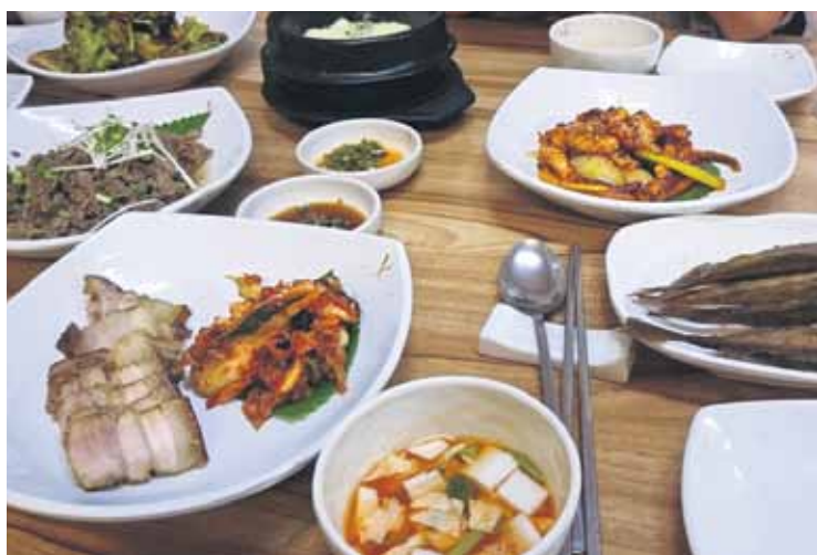
Korejiešu virtuvei raksturīgi, ka maltīte sastāv no daudzām komponentēm.

dot pilsētu, vizinot ar metro, takso metru un kuģi, vedot vakariņas uz restorāniem, stāstot, rādot un par mums rūpējoties. Atvadoties līdzostā, teicām par to paldies un devāmies 15 stundu ilgajā mā-jupceļā līdz Kuldīgai.