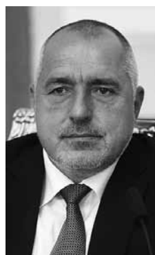
Boiko Borisovs, Bulgārijas premjerministrs