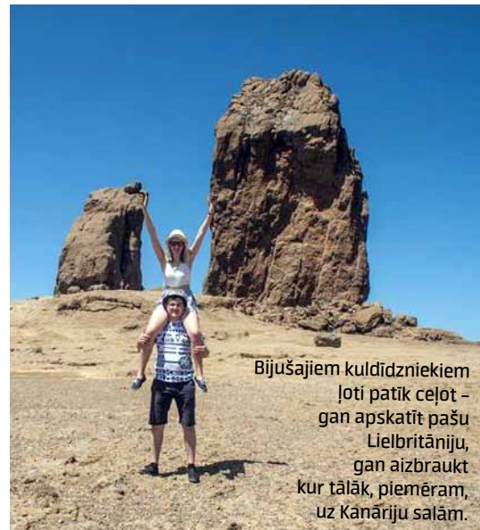
Bijušajiem kuldīdzniekiem ļoti patīk ceļot – gan apskatīt pašu Lielbritāniju, gan aizbraukt kur tālāk, piemēram, uz Kanāriju salām.

J: – Iepriekš strādāju nelielā ciematīnā zemeņu fermā, tas bija daudz citādāk. Ar šī brīža domāšanu nesaprotu, kāpēc jau toreiz negāju uz celtniecību, jo nav nemaz tik grūti tur tikt iekšā, arī atalgojums labāks. Tas bija diezgan bezmērķīgi, jo ar to fermas naudu neko daudz nevar atļauties – vienkārši labi dzīvot. Pēc tam atgriezos Latvijā, bet atkal sailgojos pēc naudas un aizbraucu vēlreiz. Puķu saimniecībā bija labāk, bet tur mani ātri ielika citā darbā – taisīt apūdeņošanas sistēmas. Visi redzēja, ka es labi strādāju, un mani neviens gandrīz vairs nekontrolēja. Nedaudz vēlāk pārcēlos uz saimniecības meitas uzņēmumu, kur mani jau pirmajā dienā iecēla par darbu vadītāju. Taču tas nebija ilgstošs variants, jo tur uz strādniekiem nevarēja paļauties. Viņi daudz dzēra, un tādus ļoti grūti vadīt. Atkal atgriezos, un