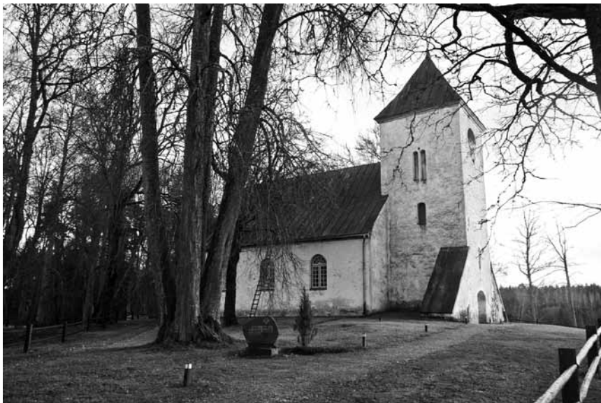
Lielīvanes baznīca 16. gs. būvēta no koka, bet tagadējā mūra ēka celta 1815. gadā. 1936. gadā uzlikts cinkota skārda jumts, bijis vēl cits remonts, bet nu jau tas laika zoba skarts.

Līdz ar to, ka balkons, altāris un daļa grīdas nokrāsota balta, Īvanes baznīca ieguvusi jaunu veidolu. To paveikusi draudze, iesniedzot projektu Kuldīgas novada pašvaldības konkursā Daršim paši .