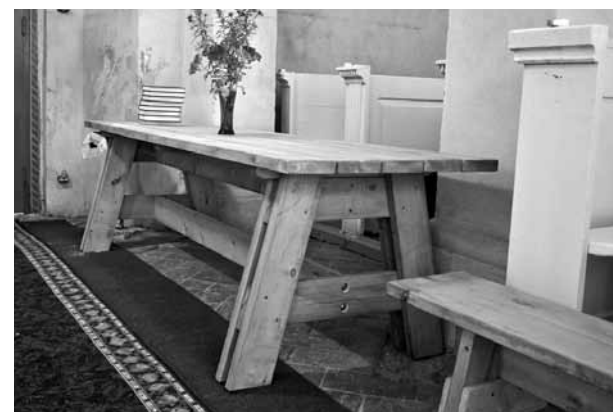
Konkursa Daršim paši projektā iegādāts arī koka galds un soli.

pamati, tad otrajā kārtā varēsim ķerties pie iekšdarbiem un arī fasādes,” skaidro A.Upleja. Projektā prasīti 25 000 eiro, no kuriem 10% būtu Kuldīgas novada pašvaldības finansējums.