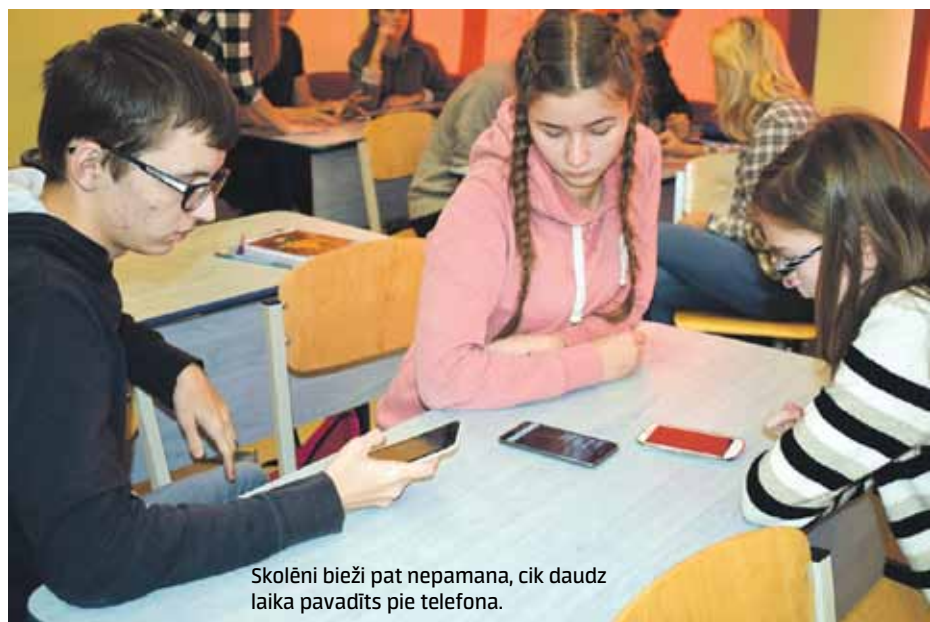
Skolēni bieži pat nepamana, cik daudz laika pavadīts pie telefona.