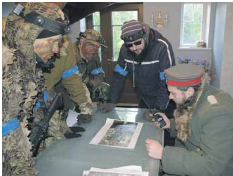
Spēles vadītājs jeb ģenerālis grupu vadītājus iepazīstina ar kaujas situāciju un uzdevumiem, kas tālāk tiek nodoti dalībniekiem jeb karavīriem.

Visi tiek iepazīstināti ar leģendu, kas šoreiz veidota pēc filmas Rīgas sargi motīviem. Spēles vadītājs stāsta: „Ir 1919. gada novembris. Pirmais pasaules karš beidzies, un neviens nenojauš, ka izšķirīgā cīņā par jaundibināto Latvijas valsti vēl tikai priekšā. Vācu karaspēks krievu virsnieka Pāvela Bermonta vadībā grasās sagrābt Rīgu, un šķiet, ka iepretī vācu pārspēkam vienīgā cerība ir sabiedroto valstu atbalsts. Bet Rīgas sargi ir gatavi drošsirdīgi cīnīties. Viņi nav ar pliku roku ņemami un pilsētu noturēs. Tagad izklīstam! Pārējo uzziņāsiet bāzē no saviem ģenerāļiem.”