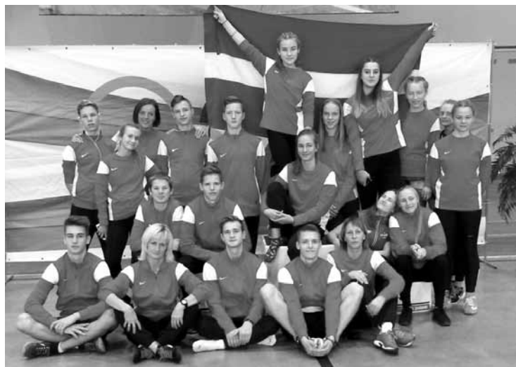
Kuldīgas novada sporta skolas vieglatlētjiem labs starts izdevies Baltijas rudenī Kaļiņingradā.

U-16 grupā Kuldīga ar 59:79 zaudēja Ventspils vienībai Spars .