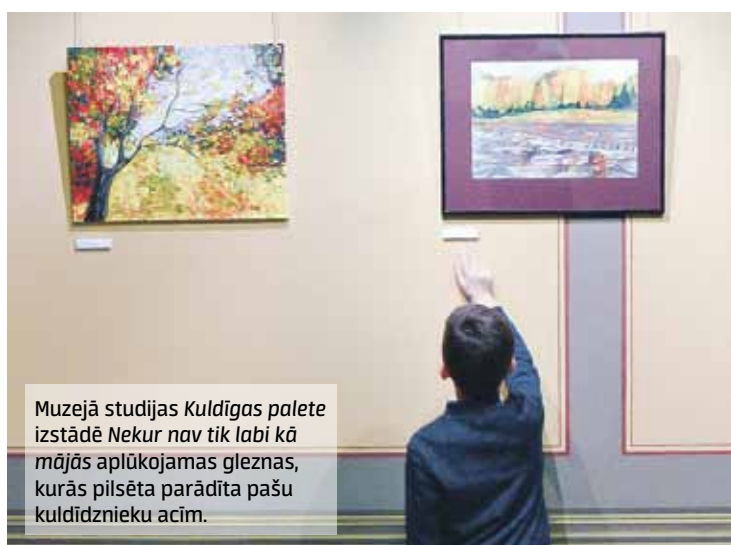
Muzejā studijas Kuldīgas palette izstādē Nekur nav tik labi kā mājās aplūkojamās gleznas, kurās pilsēta parādīta pašu kuldīdznieku acīm.