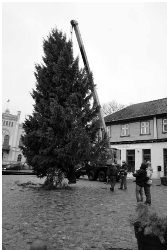
Jau pirmdien Kuldīgā, Rātslaukumā, tika atvesta svētku egle, kura tiks iedegta šo sestdien.

Ap 17.00 galvenās egles iedegšana Rātslaukumā.