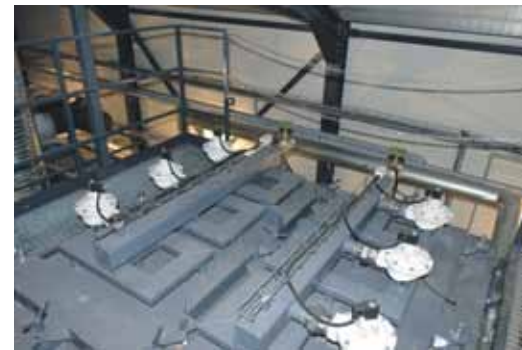
Ūdens sildāmais katls, kas aprīkots ar automātisko tīrīšanu.