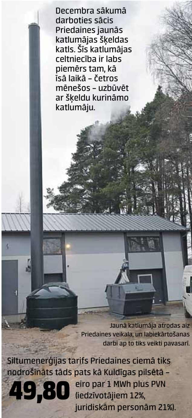
Jaunā katlumāja atrodas aiz Priedaines veikala, un labiekārtošanas darbi ap to tiks veikti pavasarī.

Decembra sākumā darboties sācis Priedaines jaunās katlumājas šķeldas katls. Šīs katlumājas celtniecība ir labs piemērs tam, kā īsā laikā – četros mēnešos – uzbūvēt ar šķeldu kurināmo katlumāju.