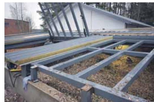
Daži darbi vēl ir jāpabeidz, viens no tiem ir jumts šķeldas noliktavai.

Katlumājā ir ekrāns, kurā redzama ūdens temperatūra un citi galvenie rādītāji.