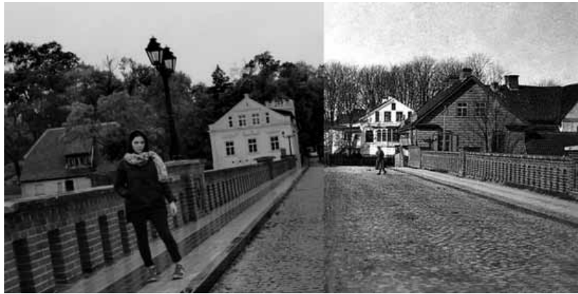
Džeinas Lauvas kolāža Pilsētas sirds .