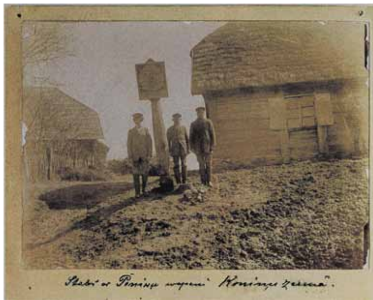
J.Krēslīšs. Stabs ar Peniķu vapeni Ķoniņu ciemā. 1895. g.

Peniķu stabs izsenis atradies pie mājas, kurā mīt tā brīža vecākais dzimtas vīrietis.