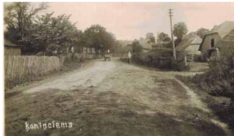
Nezināma autora fotogrāfija. Ķoniņciems.