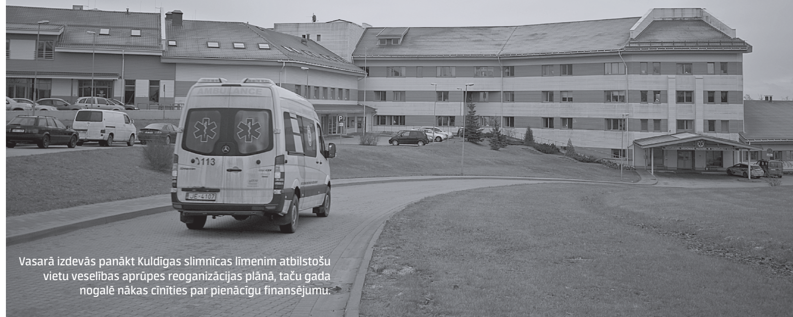
Vasarā izdevās panākt Kuldīgas slimnīcas līmenim atbilstošu vietu veselības aprūpes reorganizācijas plānā, taču gada nogalē nākas cīnīties par pienācīgu finansējumu.