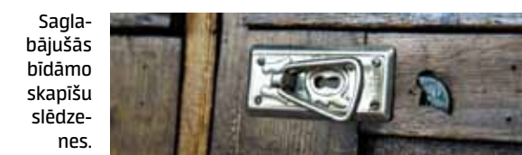
Saglabājušās bīdāmo skapīšu slēdzenes.

Viens no seifiem, kas te droši vien stāv no ēkas pirmsākumiem. Tas ir tik smags, ka to izkustināt būtu ļoti grūti.