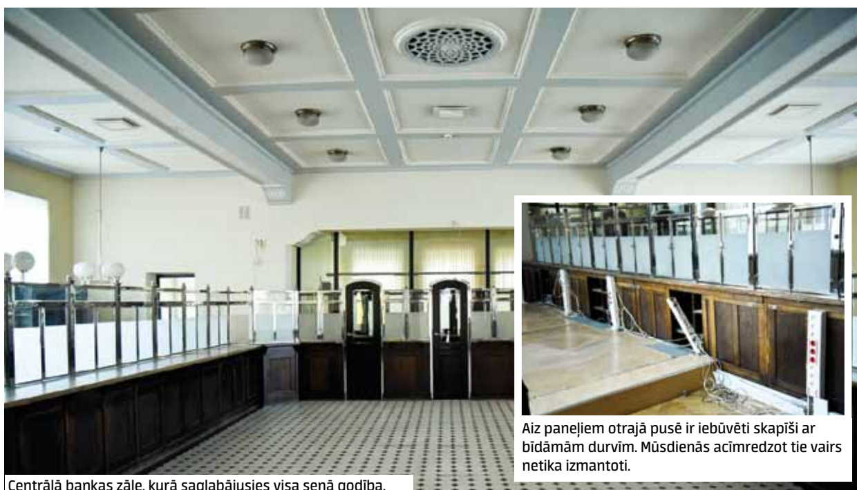
Centrālā bankas zāle, kurā saglabājusies visa senā godība.