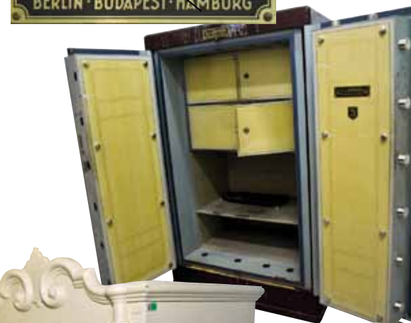
Naudas krātuves seifs. Krātuve ar restēm priekšā un 10 cm biežām durvīm atradās 2. stāvā aiz kasēm.

Viens no seifiem, kas te droši vien stāv no ēkas pirmsākumiem. Tas ir tik smags, ka to izkustināt būtu ļoti grūti.