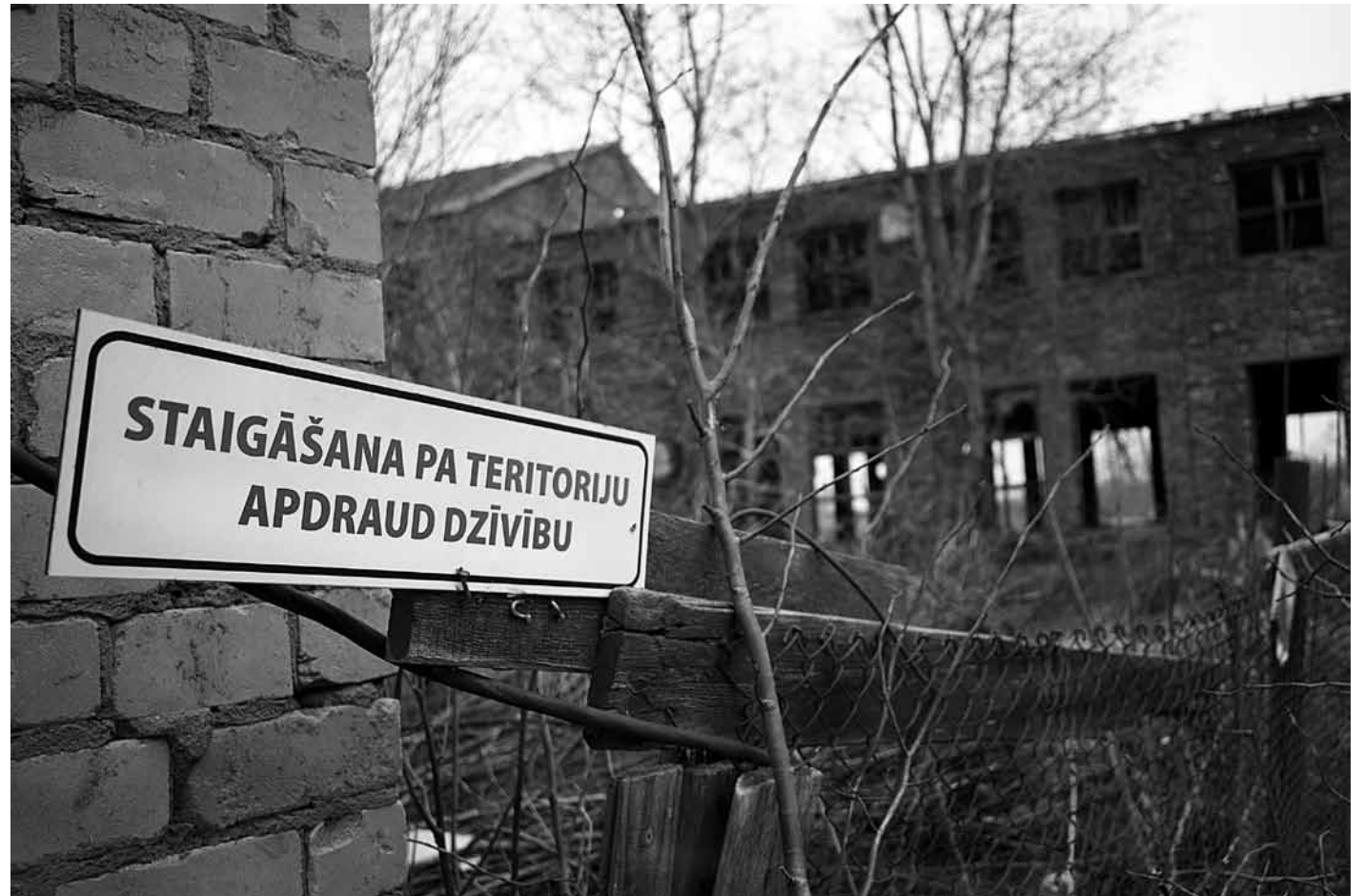
Agrākās fabrikas Vulkāns teritorijā izliktas brīdinājuma zīmes, bet tas cilvēkus neattur tur ložņāt, riskējot ar veselību.

Graustu īpašniekiem nodoklis ir 3% no kadastrālās vērtības (parasti augstākā robeža ir 1,5%). Domes sēdē deputāti no saraksta izņēma tos objektus, kuros saimnieki sākuši kaut ko darīt vai arī vismaz solījušies graustus sakopt tuvākajā nākotnē. Piemēram, tāda ir ēka Kuldīgā, Dārza ielā 10, jo tajā dzīvokļi izsolē nopirkti tikai gada otrajā pusē.