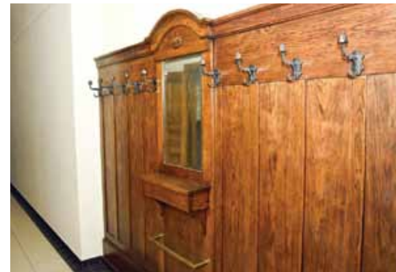
Sienu paneļi ir tik kvalitatīvi uzbūvēti, ka laika zobs tos neskar.