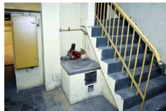
Pagrabā kādreiz esot bijis pārvaldnieka dzīvoklis. No tiem laikiem te saglabājusies plīts.