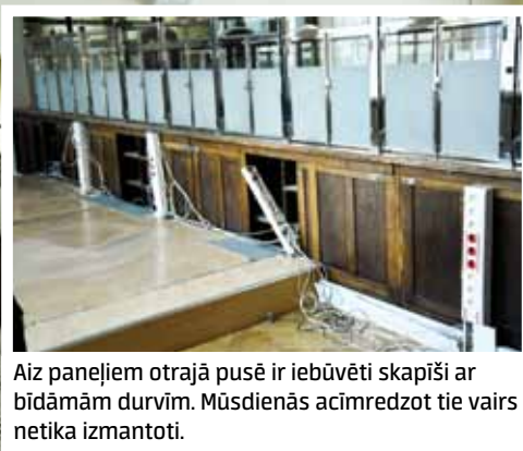
Aiz paneļiem otrajā pusē ir iebūvēti skapīši ar bīdāmām durvīm. Mūsdienās acīmredzot tie vairs netika izmantoti.