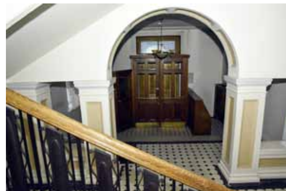
Ieejas durvis – tikpat reprezentablas, cik pati banka. Kuldīznieki atceras laikus, kad, ieejot bankā, viņus laipni sveicināja sirms kungs.