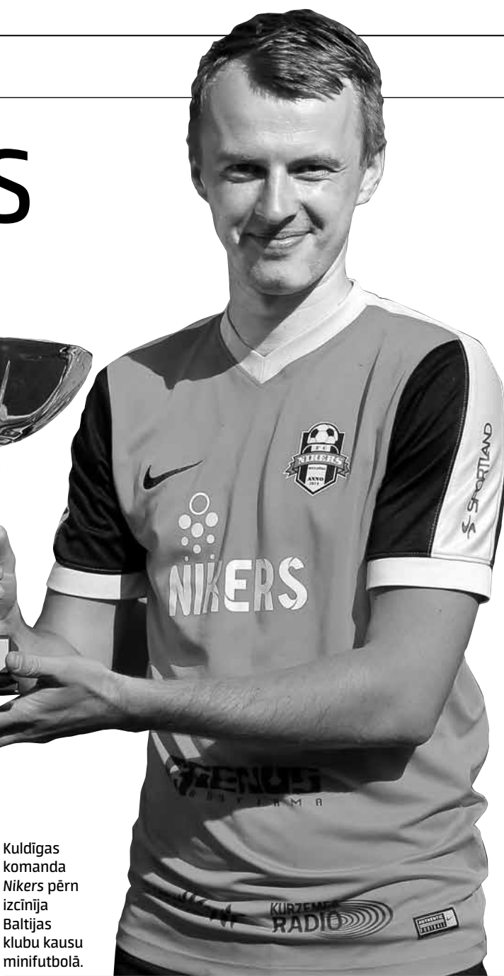
Kuldīgas komanda Nikers pērn izcīnīja Baltijas klubu kausu minifutbolā.