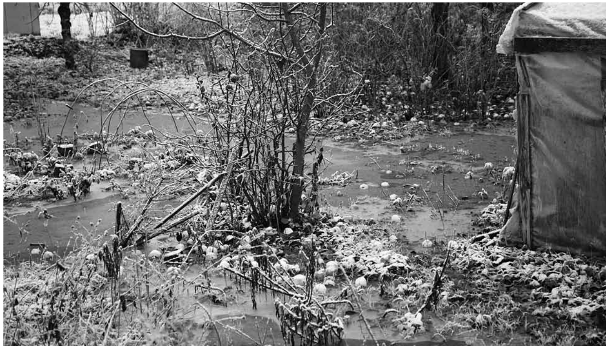
Tāds dārzs Kaļķu ielā izskatās vēl tagad. Īpašnieki uztraucas, ka ūdens šķūnišos mērcē malku, drīz smelsies arī istabās.

Šis nebūt nav pirmais gads, kad Kaļķu ielas 18., 20. un 22. nama pagalmi Kuldīgā burtiski pludo. Palīdzība meklēta gan uzņēmumā Kuldīgas ūdens (KŪ), gan pašvaldībā.