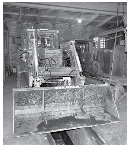
Remonta zona, kurā tiek labota un glabāta tehnika.

„Parasti šajā laikā remontējam tehniku, bet šogad pabeidzam nepabeigtos darbus. Daudzi ir nokavēti. Kūtmēsli jāizved – tos vedam uz kukurūzas laukiem. Sen jau zemei bija jābūt uzartai, bet