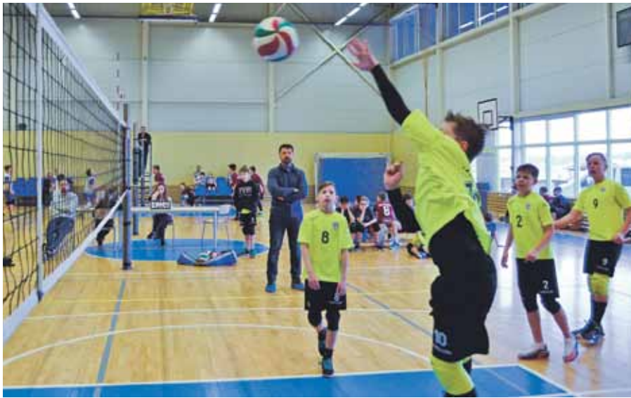
Kuldīgas volejbolisti no U-13 grupas ziemas kausa izcīņā Mārupē.

Ziemas volejbola kausa izcīņā Mārupē Kuldīgas novada sporta skolas U-13 grupas 1. komandas zēni var lepoties ar bronzas godalgām.