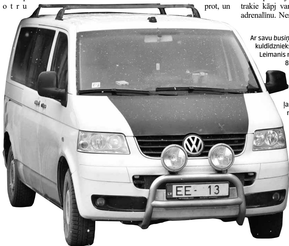
Ar savu busiņu kuldīdznieks Normunds Leimanis nobraucis 850 000 kilometru. Cipars 13 numura zīmē nekādu jaunumu nav nesis.