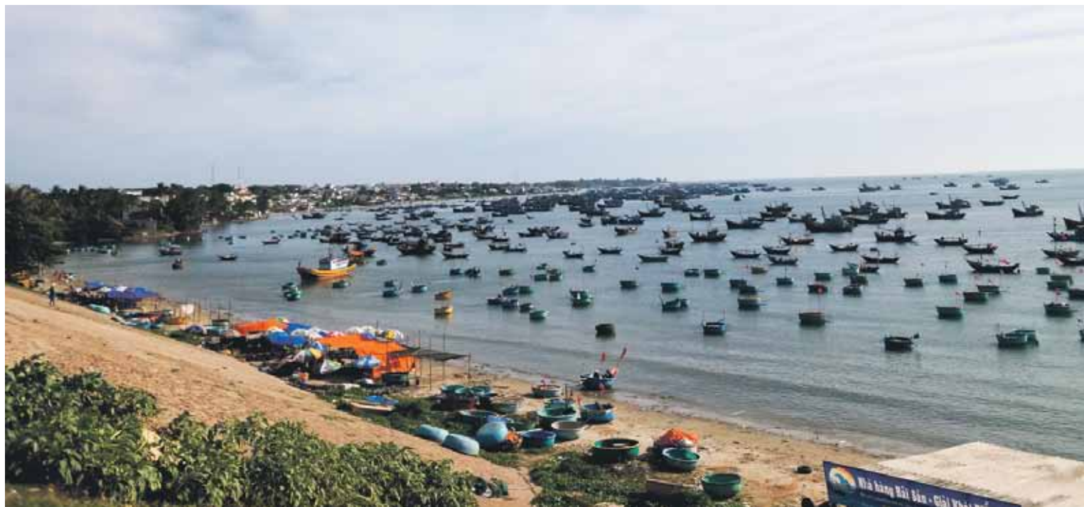
Ar šīm bļodas lieluma peldierīcēm vietējie ik rītu dodas jūrā zvejojot un jau pēc brītiņa svaigo lomu piedāvā tirgū.