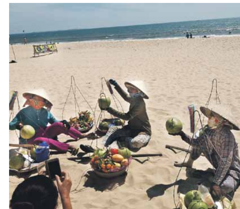
Pludmalē vjetnamietes, ķermeņi no saules paslēpušas, atpūtniekiem piedāvā augļus.