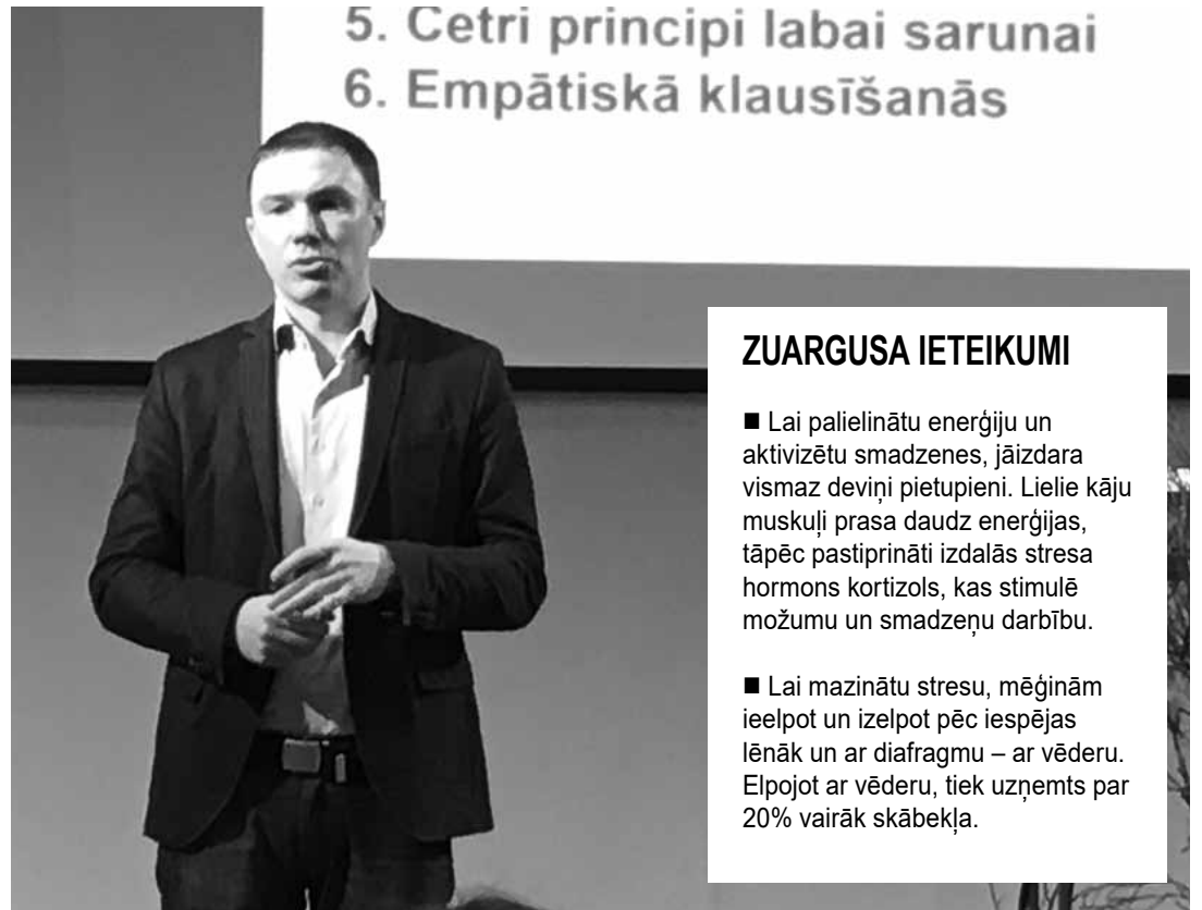
„Lai veiksmīgi sarunātos ar citiem, vispirms jāietiek skaidrībā ar sevi,” iesaka emocionālā intelekta treneris Zuarguss.

Mūsdienās ar šo iekļautību saprotam novērtējumu – esam vai neesam iekļauti kādā kolektīvā.