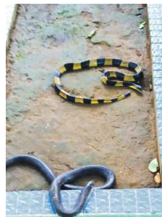
Čūskas Vjetnamā visbiežāk varot redzēt audzētavā vai uz pusdienu galda, bet dabā tās bieži ceļā negadoties.