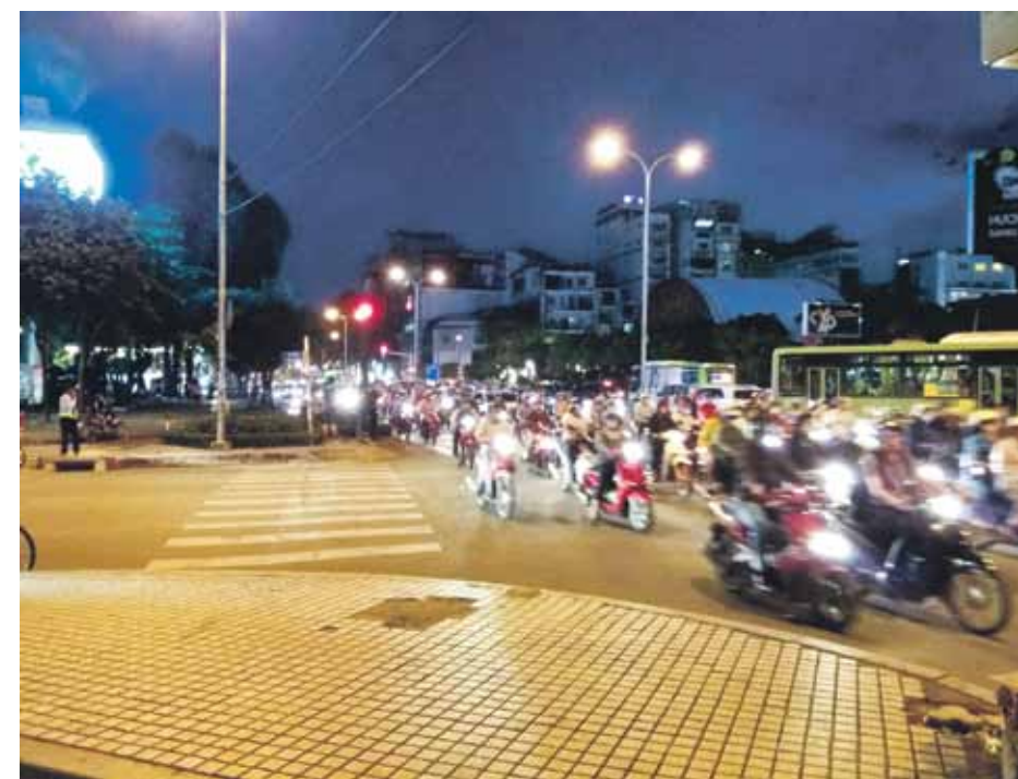
Vjetnamā šādas mašīnu un motociklu pārpildītas ielas, īpaši vakaros, ir ierastas.