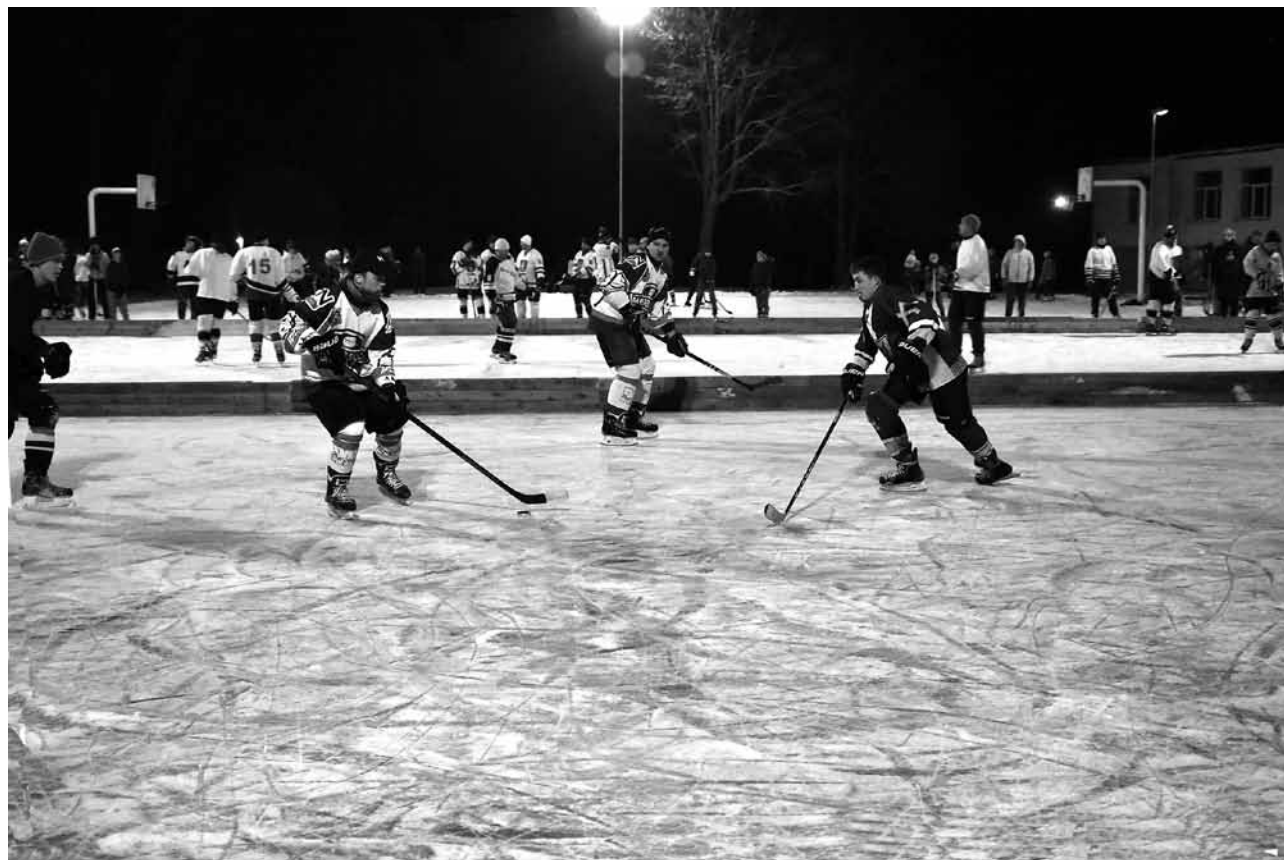
Kuldīgas zibensturnīrā – līderu cīņa starp Ventspils Marbellu un Priedaines komandu Bauer .

Kuldīgas hokeja zibensturnīrā piektdienas vakarā uzvarējusi komanda Marbella no Ventspils.