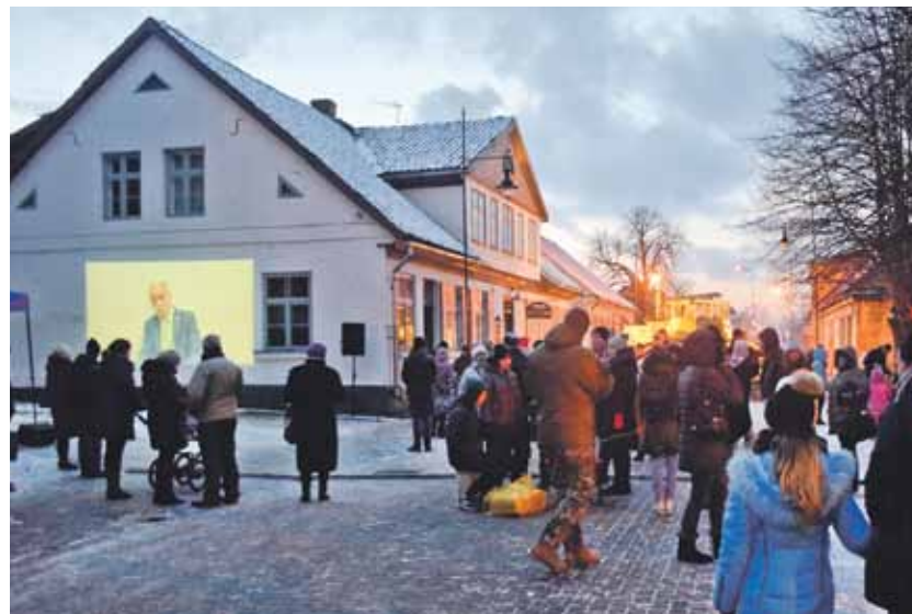
Bērnu un jauniešu centra darbinieku filmētās barikāžu dalībnieku atmiņas par to, kā cilvēki militāram pārspēkam stājās pretī kailām rokām, ar interesi noskatījās daudzi.