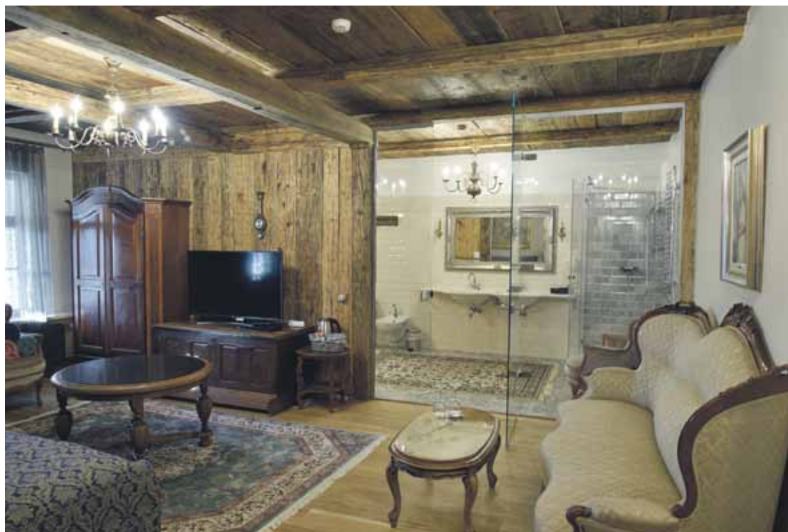
Virkas muižā 17 numuri viesiem iekārtoti moderni un vienlaikus senatnīgi – katrs ir unikāls, ar atšķirīgu noskaņu.

2016. gadā otrajā stāvā atjaunots viens spārns, pērn tajā iekārtoti 17 grezni numuri. „Katru gadu naktsmītņu īpašnieki sāk raudāt rudenī un beidz tikai, kad sākas vasara. Neesmu pārliecināta, ka nākotnē klimats un ceļotāju paradumi mainīsies. Tā kā vaimanāšana nepalīdz viesnīcu piepildīt, esam mainījuši koncepciju, lai mūsu naktsmītņi padarītu interesantāku, lai atpūtniekus un ceļotājus piesaistītu arī ziemā. Piedāvājam romantisku atpūtu muižā, kas atrodas skaistajā pilsētā Kuldīgā. Tādēļ esam pietuvojušies lielajam mērķim – viesiem ļaut justies tiešām kā muižā. Tas nenozīmē, ka jādzīvo pagājušā gadsimta ērtību līmenī – ir mūsdienīga santehnika. Numuru noformējumā esam izmantojuši Kuldīgai mazraksturīgu iekārtošanas veidu, ar to izpelnoties lielu apmeklētāju uzmanību. Numuriņos ir vannasistabas ar stiklotām sienām: esam noņēmuši padomju laikos aizkrāsoto, ar tapetēm aizlīmēto un