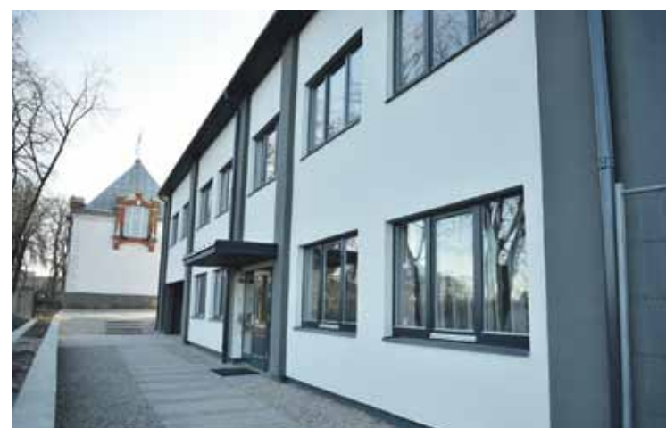
Pērn pārdesmit metru tālāk pie stadiona pamestas ēkas vietā tapis viesnīcas Virkas muiža otrais korpuss Sport Hotel Virka .