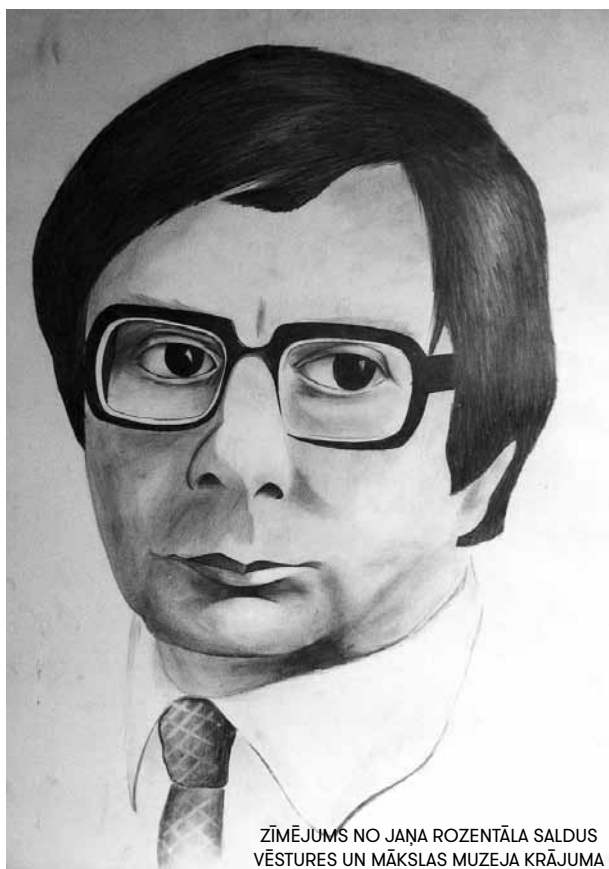
ZĪMĒJUMS NO JAŅA ROZENTĀLA SALDUS VĒSTURES UN MĀKSLAS MUZEJA KRĀJUMA

Dzejnieka Māra Čaklā portrets (autors un zīmēšanas laiks nezināms), ko 2013. gadā kopā ar simtiem citām dzejniekam piederējušām lietām viņa ģimene uzdāvināja Jaņa Rozentāla Saldus vēstures un mākslas muzejam.