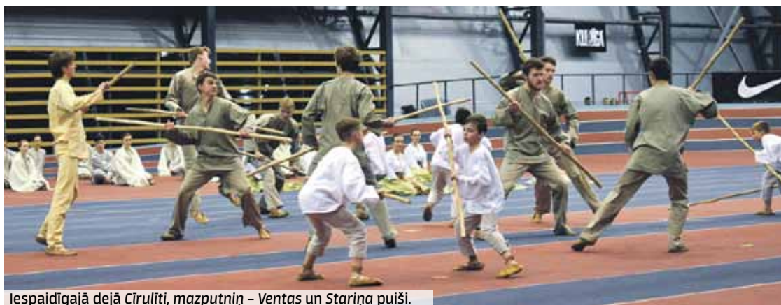
Iespaidīgajā dejā Cīrulīti, mazputniņ – Ventas un Stariņa puīši.