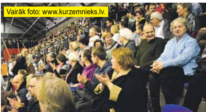
Pilnas tribīnes manēžā, izrādās, spēj pulcēt ne tikai sporta sacensības vien.