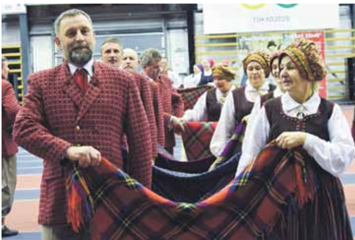
Dejo Kuldīgas seniori.