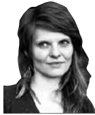
Maija Jankovska, tāl. 63323021, redakcija@ kurzemnieks.lv

Reiz kāda kolēģe universitātē sūdzējās, cik grūti ar studentiem runāt par feminismu, sievietes tiesībām u.tml. tēmām. Studentiem liekoties, ka tā vairs nav problēma, jo balsot taču sievietes var, karjeru izvēlēties var, viņas ieņem augstus amatus utt.