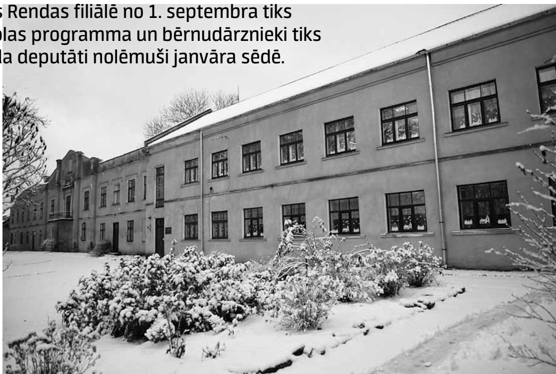
Lielrendas muižas kompleksā, kurā atrodas Rendas skola, ietilpst muižas ēka, saimniecības ēka, veļasmāja un katlumāja. Apkārt liels parks. Bērni un skolas darbinieki apdzīvo mazu daļiņu – to, kuras logos redzami rotājumi.