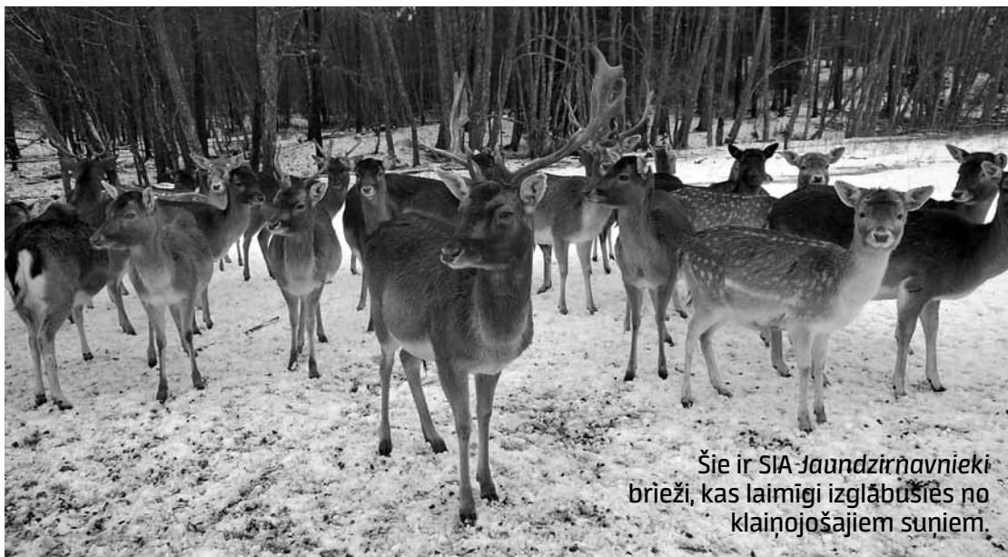
Šie ir SIA Jaundzirnavnieki brieži, kas laimīgi izglābušies no klaiņojošajiem suņiem.