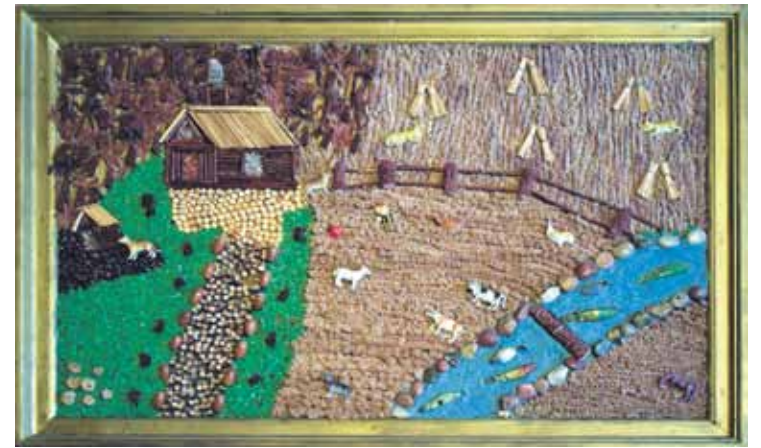
Autore idejas smeļas televīzijas raidījumos, ainavās, ceļojumos, bet šis darbs tapis pēc grāmatas izlasīšanas.