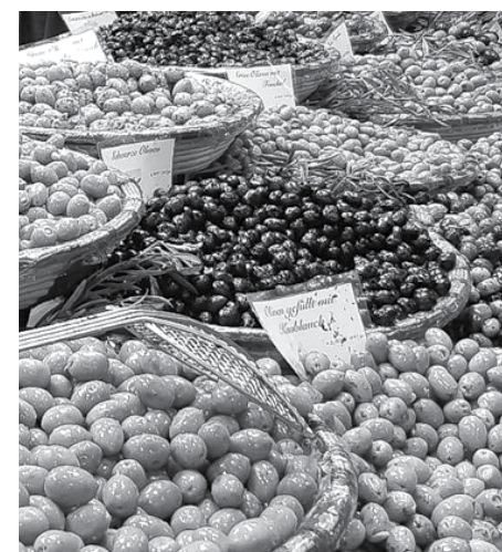
Mazsāliju saimniecei Gunitai pirms savas dzimšanas dienas bija iespēja iegādāties vislabākās sicīliešu olīvas.