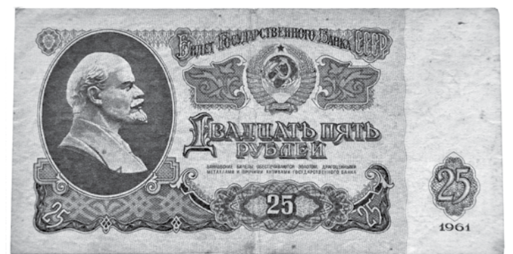
Padomju laiku nauda.