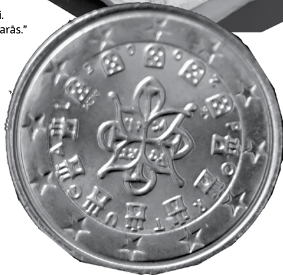
Portugāļu eiro monētas esot visgrūtāk atrodamas.