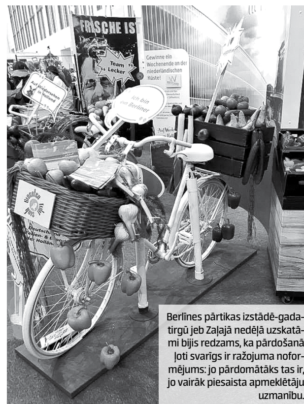
Berlīnes pārtikas izstādē-gadatirgū jeb Zaļajā nedēļā uzskatāmi bijis redzams, ka pārdošanā ļoti svarīgs ir ražojuma noformējums: jo pārdomātāks tas ir, jo vairāk piesaista apmeklētāju uzmanību.