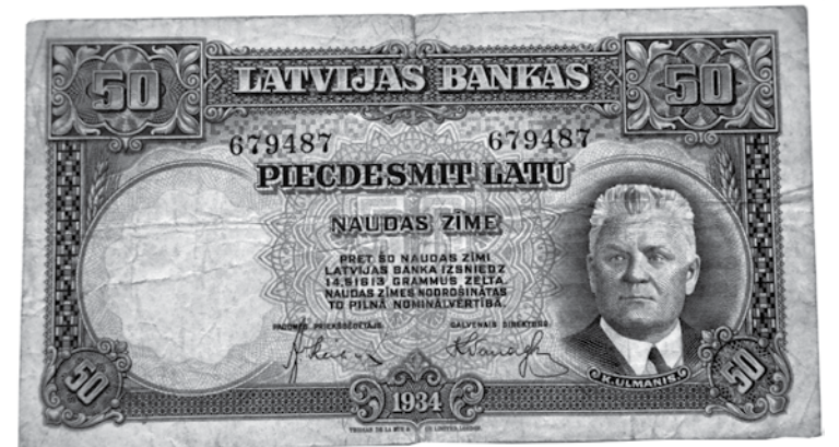
Ši iemainīta pret citām latu banknotēm. Ilga Nomme to nedaudz nožēlojot.